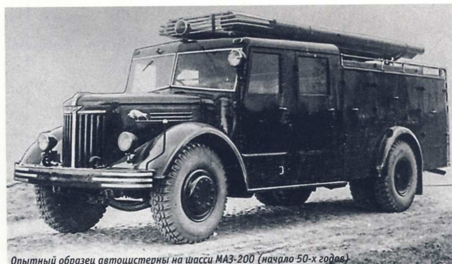
Опытный образец автоцистерны на шасси МАЗ-200 (начало 50-х годов)