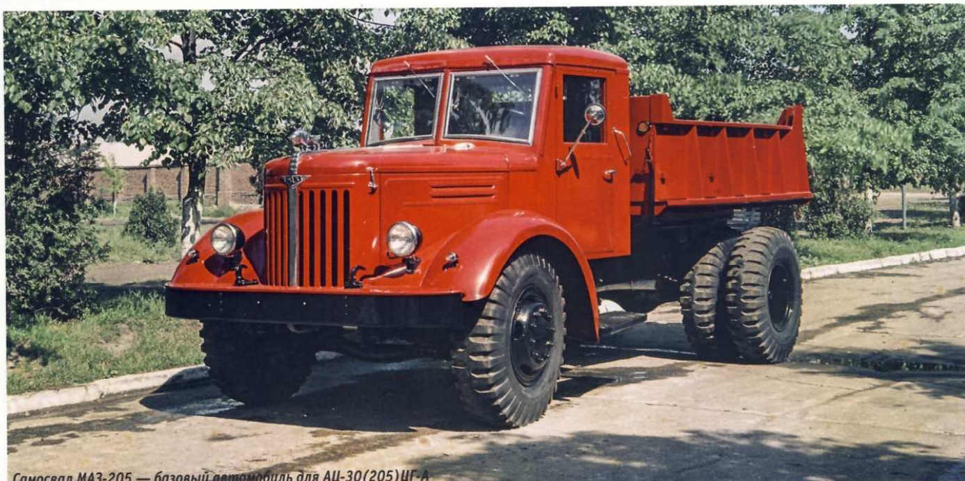
Самосвал МАЗ-205 — базовый автомобиль для АЦ-30(205)ЦГ-А

На основании этих цифр можно сделать вывод, что МАЗ-205 был одним из самых массовых изделий Минского автозавода за все время его существования. А вот