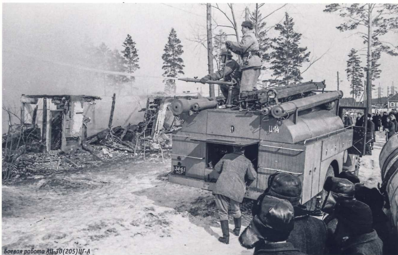
Боевая работа АЦ-30(205)ЦГ-А

сигналов. Естественно, устанавливалась специальная сирена, подающая громкий звуковой сигнал при движении. Автоцистерна оснащалась закрытым цельнометаллическим блочно-панельным сварным кузовом, состоящим из отдельных блоков. Блоки кузова соединялись между собой и жестко крепились к специальным кронштейнам цистерны автомобиля. Отсеки кузова снабжались полками и приспособ-