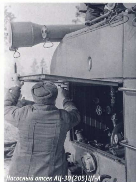
Насосный отсек АЦ-30(205)ЦГ-А