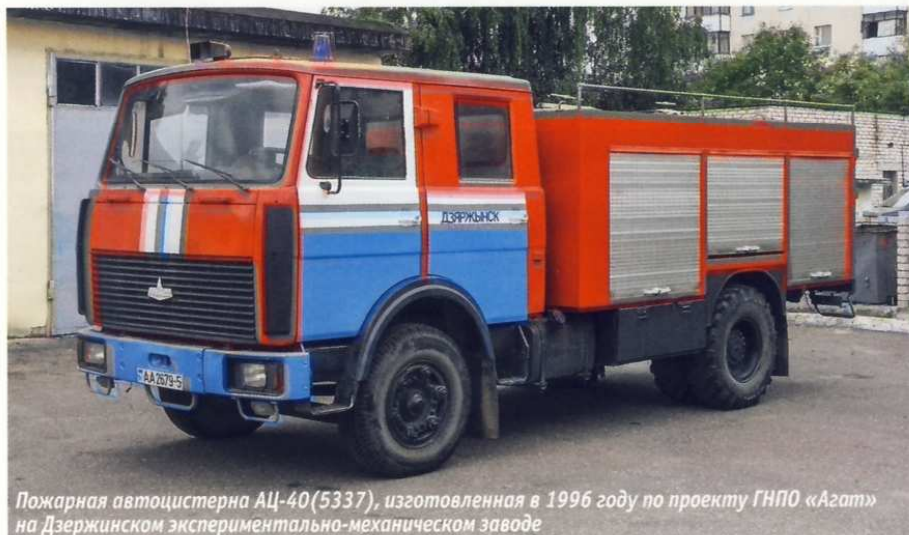
Пожарная автоцистерна АЦ-40(5337), изготовленная в 1996 году по проекту ГНПО «Агат» на Дзержинском экспериментально-механическом заводе