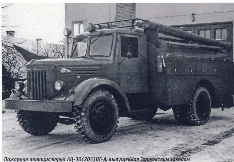
Пожарная автоцистерна АЦ-30(205)ЦГ-А, выпущенная Торжокским заводом

Лонжероны рамы приходилось удлинять надставками, на которых монтировались насос, буксирные крюки и задний бампер. Вместо стандартных подножек кабины устанавливались специальные кронштейны с ящиками для аккумуляторов и другого оборудования. Кузов, имевший сварной каркас, состоял из блоков, в которых размещалось пожарно-техническое вооружение (ПТВ). В средней части автомобиля размещалась цистерна для воды емкостью 5000 л, крепившаяся стремлянками через лапы к лонжеронам рамы. Бак для пенообразователя конструкцией не предусматривался.