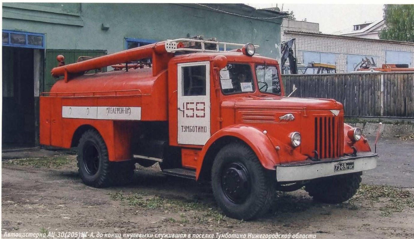
Автоцистерна АЦ-30(205)ЦГ-А, до конца «нулевых» служившая в поселке Тумботино Нижегородской области

В общей сложности самосвал МАЗ-205 находился в производстве 19 лет — с 1947 по самый конец 1965 года. За это время общий тираж модели чуть-чуть не дотянул до отметки в 100 тыс. штук. Согласно статистике, с конвейера Минского автозавода сошли 98 720 самосвалов МАЗ-205, а пик производства пришелся на 1964 год, когда собрали 10 018 самосвалов этой модели.