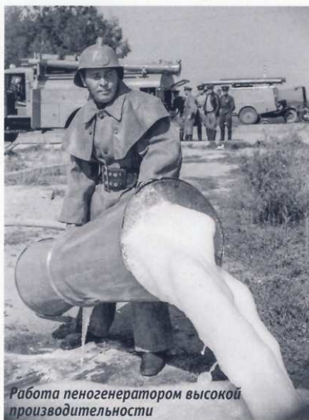
Работа пеногенератором высокой производительности

Именно АЦ-30(205)ЦГ-А стали «родоначальниками» целого направления в советском пожарном автомобилестроении — автоцистерн тяжелого класса. Они были первыми — первыми серийными тяжелыми и первыми дизельными. В этом их главная историческая роль.