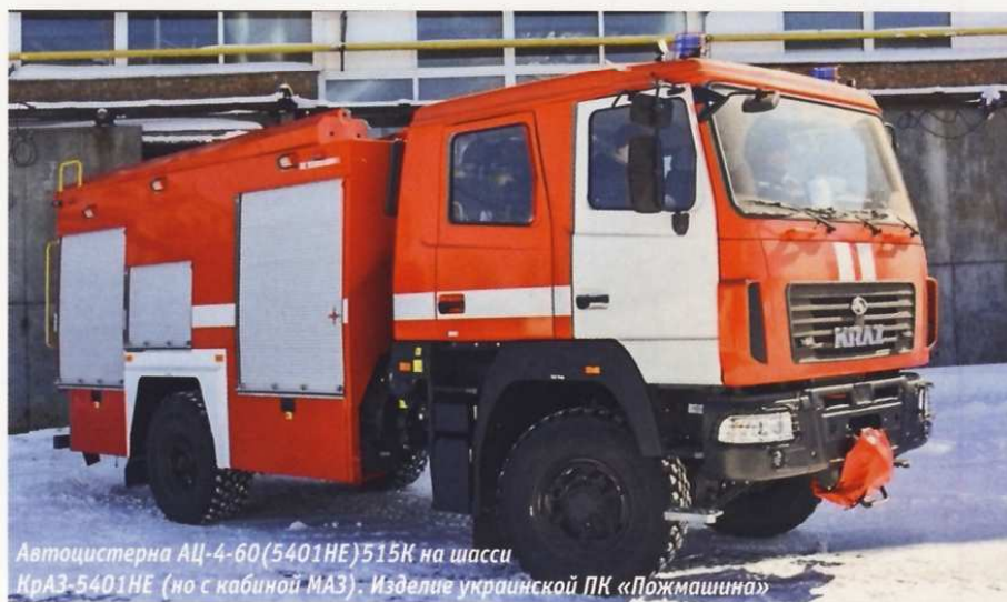
Автоцистерна АЦ-4-60(5401НЕ)515К на шасси КраЗ-5401НЕ (но с кабиной МАЗ). Изделие украинской ПК «Пожмашина»

Еще 25 пожарных автоцистерн в рамках тендера 2017 года изготовлены на шасси КраЗ-5401НЕ. Эта версия называется АЦ-4-60 (5401НЕ)-515К. Любопытный нюанс заключается в том, что на шасси КраЗ-5401НЕ используется двухрядная бескапотная кабина от МАЗ. Так что внешне модель 515М на шасси МАЗ и модель 515К на шасси КраЗ можно отличить только по эмблеме и по форме ступицы мостов. Этот новый контракт уже почти выполнен. Таким образом, в период с 2016 по 2018 год Украина пополнила свой пожарный автопарк более чем двумя сотнями пожарных автоцистерн на шасси МАЗ. И МАЗ неожиданно стал главным пожарным грузовиком Украины.