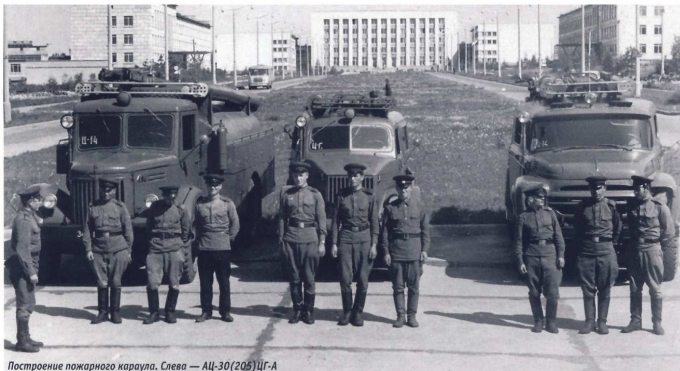
Построение пожарного караула. Слева — АЦ-30(205)ЦГ-А

Известна точная статистика выпуска этих автоцистерн. В 1962 году построили 70 таких машин, в 1963-м — 65, в 1964 году — 70,