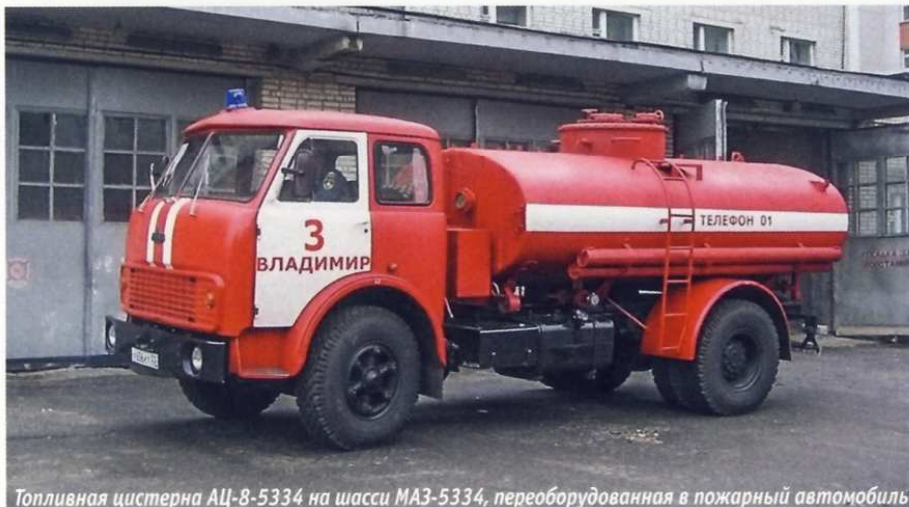
Топливная цистерна АЦ-8-5334 на шасси МАЗ-5334, переоборудованная в пожарный автомобиль