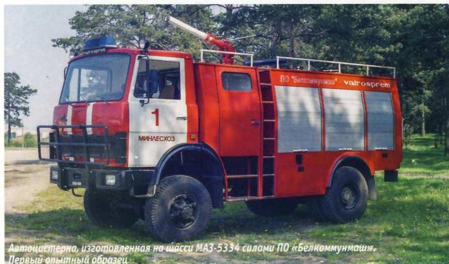
Автоцистерна, изготовленная на шасси МАЗ-5334 силами ПО «Белкоммунмаш». Первый опытный образец