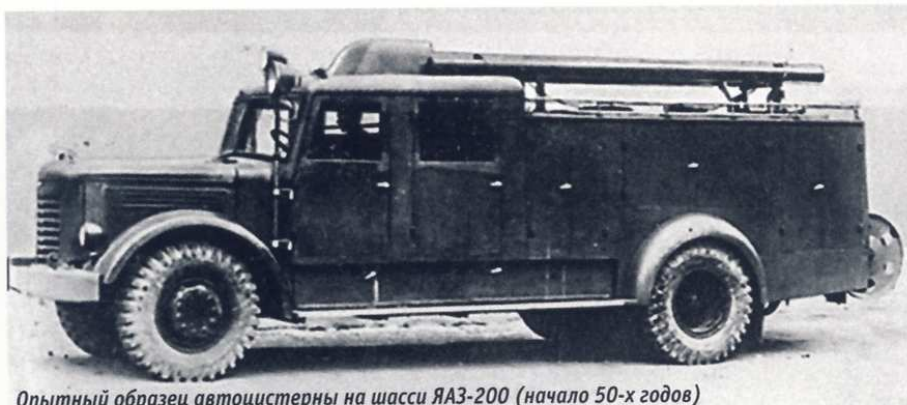
Опытный образец автоцистерны на шасси ЯАЗ-200 (начало 50-х годов)

Идею автонасоса быстро отменили, а опытный образец автоцистерны на шасси ЯАЗ-200 построили на заводе №2 хозяйственного управления МВД СССР (ХОЗУ №2). Затем там же был построен еще один опытный образец, уже на шасси МАЗ-200 (к этому