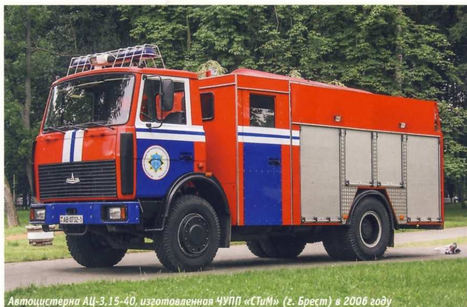
Автоцистерна АЦ-3,15-40, изготовленная ЧУПП «СТИМ» (г. Брест) в 2006 году

Пожарная техника не является специализацией компании, но как минимум одну модель пожарной автоцистерны на шасси МАЗ-5337 здесь создали. Ее характерный внешний признак — кабина боевого расчета, больше напоминающая небольшой кузов-фургон.