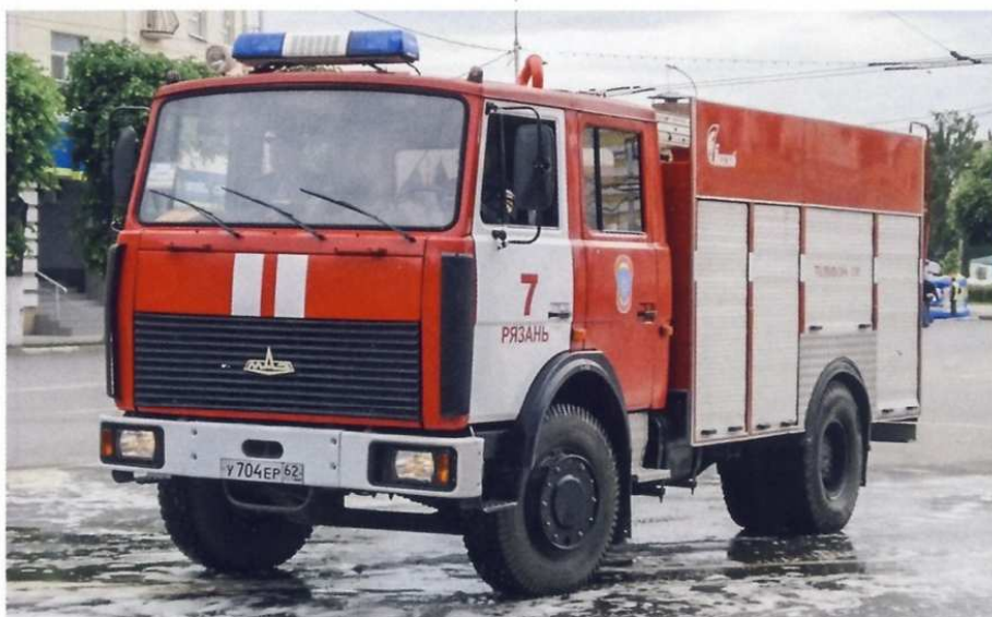
Первая пожарная автоцистерна на шасси MAZ-5337, изготовленная СООО «Пожснаб» в Борисове, служит в Рязани

Третья белорусская пожарная автоцистерна АЦ-40(5337) оказалась очень удачной и конструктивно проработанной машиной. На ней установили пожарный насос Rosenbauer NH-40 производительностью 4000 л/мин или 66 л/с, емкость водобака составляла 4700 л, пенобака — 450 л. Пожарное оборудование было размещено гораздо удобнее, чем на советских автоцистернах. Конструктивные особенности автомобиля давали возможность полумеханизированной прокладки рукавной линии. Гордостью разработчиков была двухрядная кабина, которую на сей раз изготавливал не МАЗ, а сам «Белкоммунмаш».