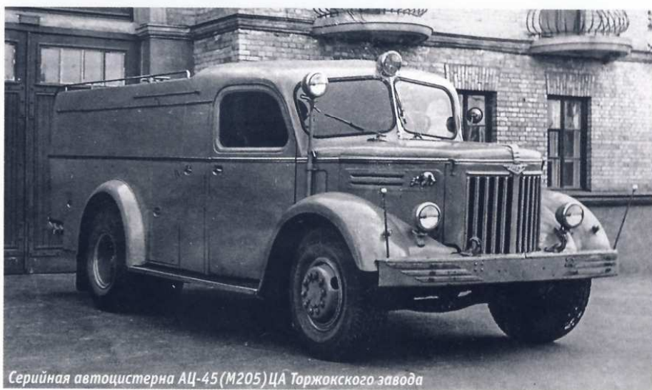
Серийная автоцистерна АЦ-45 (М205) ЦА Торжокского завода