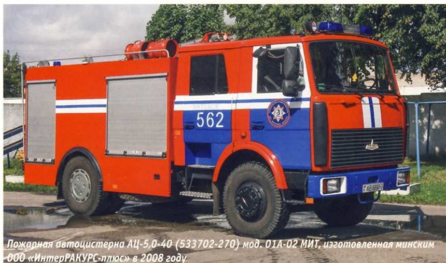
Пожарная автоцистерна АЦ-5,0-40 (533702-270) мод. 01А-02 МИТ, изготовленная минским ООО «ИнтерРАКУРС-плюс» в 2008 году

Торжокский завод «Пожтехника» — тот самый, где в 60-х годах производили пожарные автоцистерны АЦ-30(205)ЦГ-А, еще раз обратился к теме пожарных автоцистерн на шасси МАЗ в 2002 году. Тогда