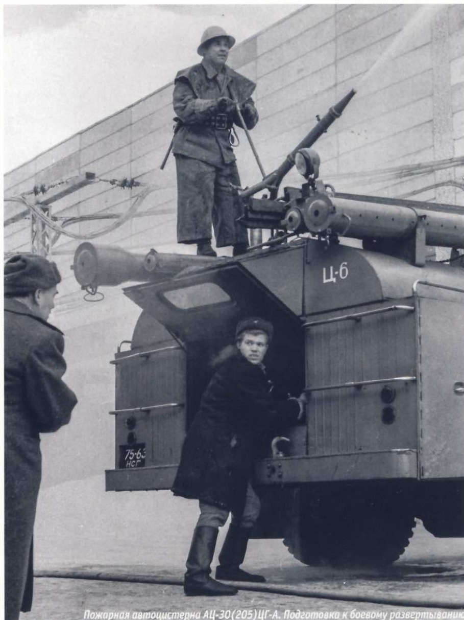
Пожарная автоцистерна АЦ-30(205)ЦГ-А. Подготовка к боевому развертыванию

Характерной внешней особенностью МАЗ-205, превращенного в пожарную автоцистерну, была фара-прожектор на специальном кронштейне, предназначенная для освещения места работы, и лобовая фара, смонтированная на крыше, предназначенная для подачи мигающих световых