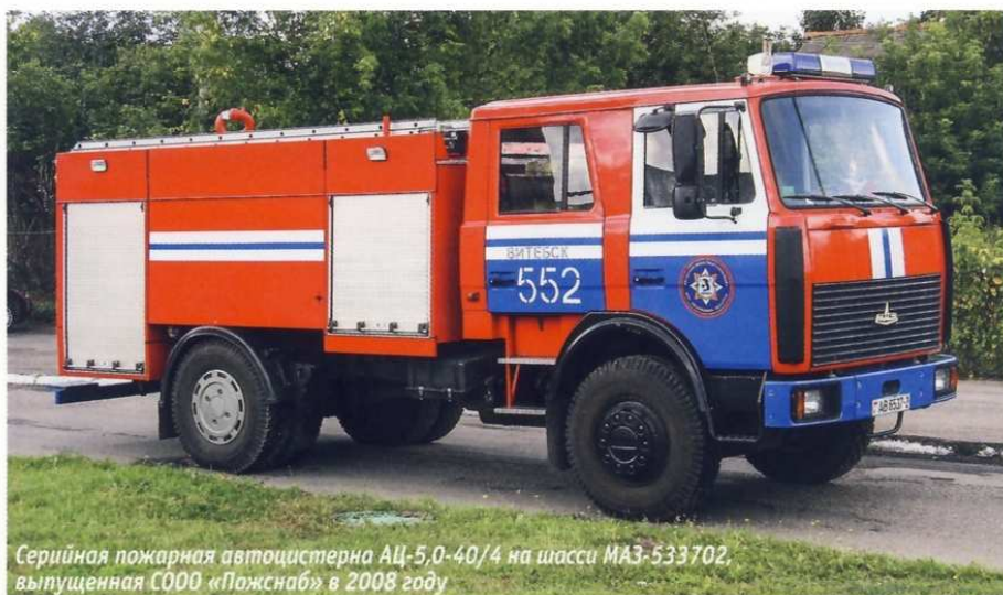
Серийная пожарная автоцистерна АЦ-5,0-40/4 на шасси МАЗ-533702, выпущенная СООО «Пожснаб» в 2008 году

Несомненно, связи «Белкоммунмаша» с австрийскими коллегами открывали новые возможности. Появилась амбициозная идея создать на шасси МАЗ автоцистерну европейского уровня, и руководство «Белкоммунмаша» решилось на этот шаг. В течение восьми месяцев была разработана эскизная документация, а в июле 1998 года состоялся первый показ новинки. Любопытно, что дата ее появления совпала с 25-летием ПО «Белкоммунмаш» и 145-летием пожарной службы Беларуси.