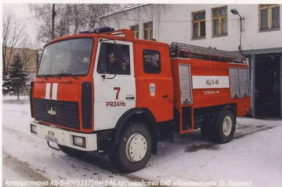
Автоцистерна АЦ-5-40(5337)ПМ-596 производства ОАО «Пожтехника» (г. Торжок)

была изготовлена АЦ-5-40(5337)ПМ-588 на шасси МАЗ-5337 с оригинальной «пожтехниковской» дубли-кабиной и довольно изящными формами кузова. Эта машина, построенная в единственном экземпляре, попала на службу на родину шасси — в Минск.