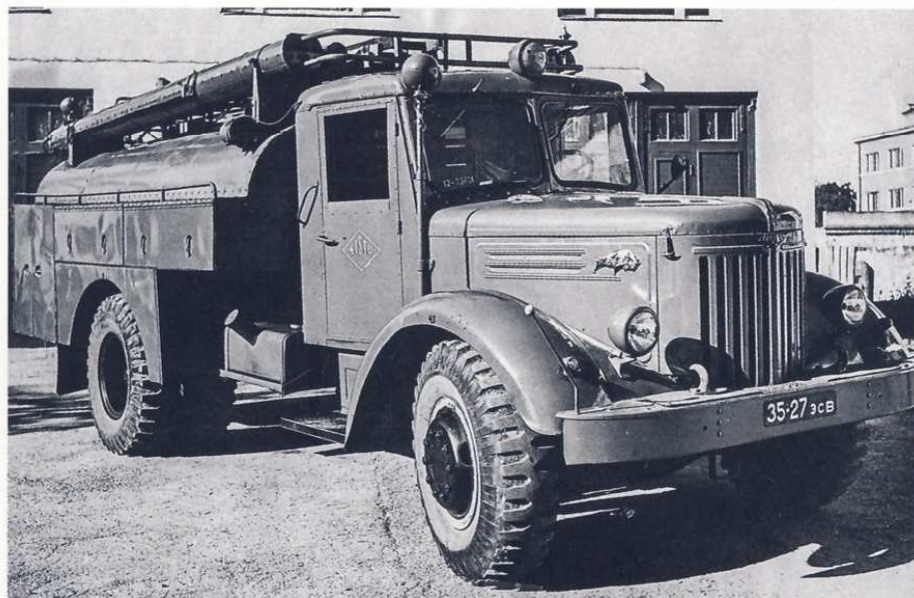
Пожарная автоцистерна АЦ-30(205)ЦГ-А