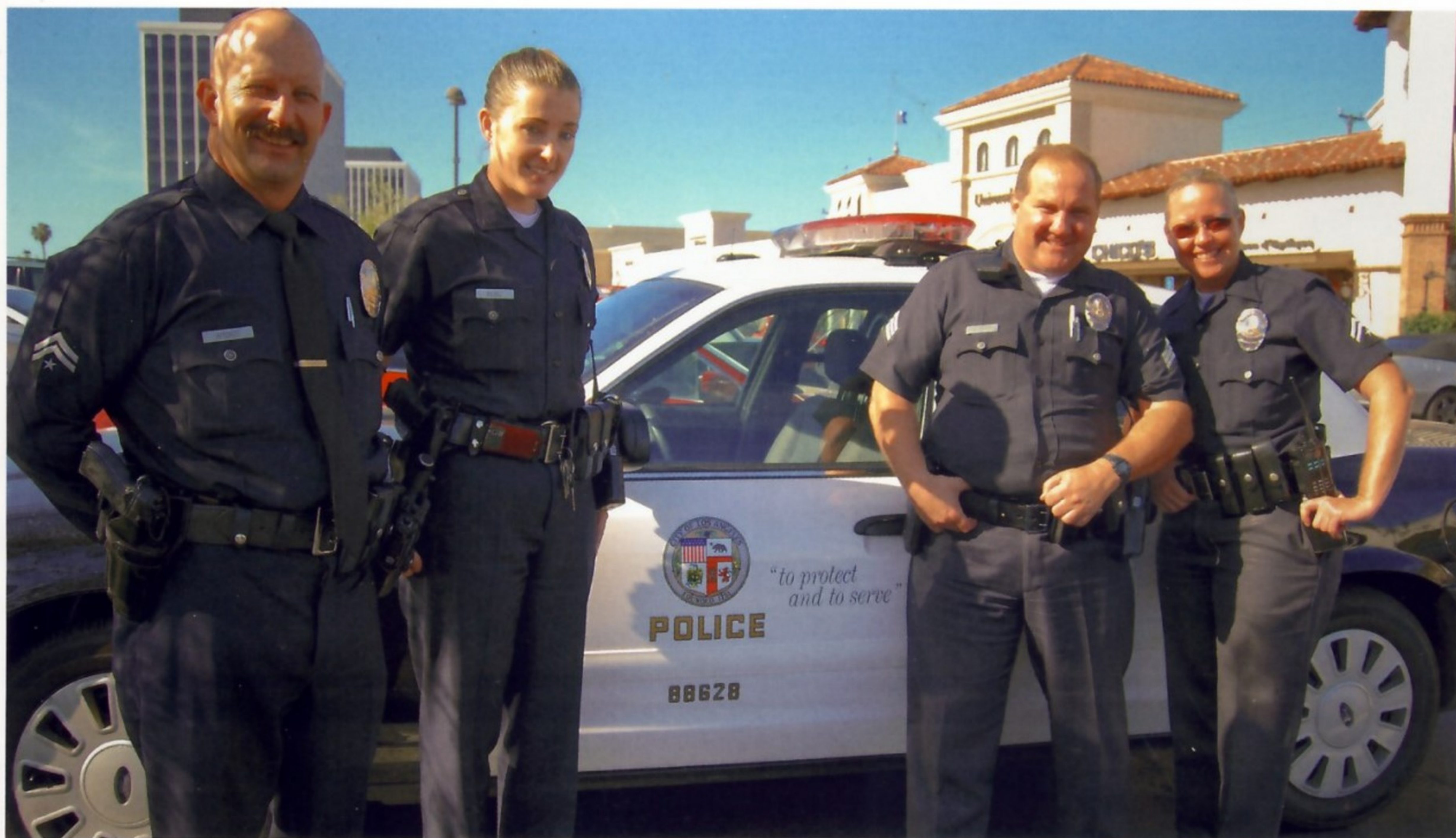
ОФИЦЕРЫ ПОЛИЦИИ ЛОС-АНДЖЕЛЕСА ПОЗИРУЮТ НА ФОНЕ СВОЕГО АВТОМОБИЛЯ НА ОДНОЙ ИЗ ГОРОДСКИХ УЛИЦ

Лос-Анджелес, или Город ангелов, как его еще называют, расположен на юге штата Калифорния на берегу Тихого океана. Это крупнейший город штата (на 1 июля 2009 года в нем насчитывалось 3 831 868 жителей), административный центр округа с тем же названием и агломерации, население которой превышает 17 млн человек. А еще это один из крупнейших культурных, научных, экономических и образовательных центров мира. Первое полицейское формирование под названием «Рейнджеры Лос-Анджелеса» появилось в городе в 1853 году. Это был отряд добровольцев, помогавших поддерживать порядок. Спустя некоторое время на смену рейнджерам пришло другое добровольное формирование — «Гвардия Лос-Анджелеса». Регулярная полицейская служба в городе была создана только в 1869 году. Тогда мэрия наняла шестерых полисменов, работавших под началом маршала Уильяма Уоррена. Лос-Анджелес быстро разрастался, и концу XIX века там несли службу уже 70 офицеров полиции — один на 1500 жителей. В 1903 году число полицейских увеличилось до 200 человек и в дальнейшем продолжало расти.