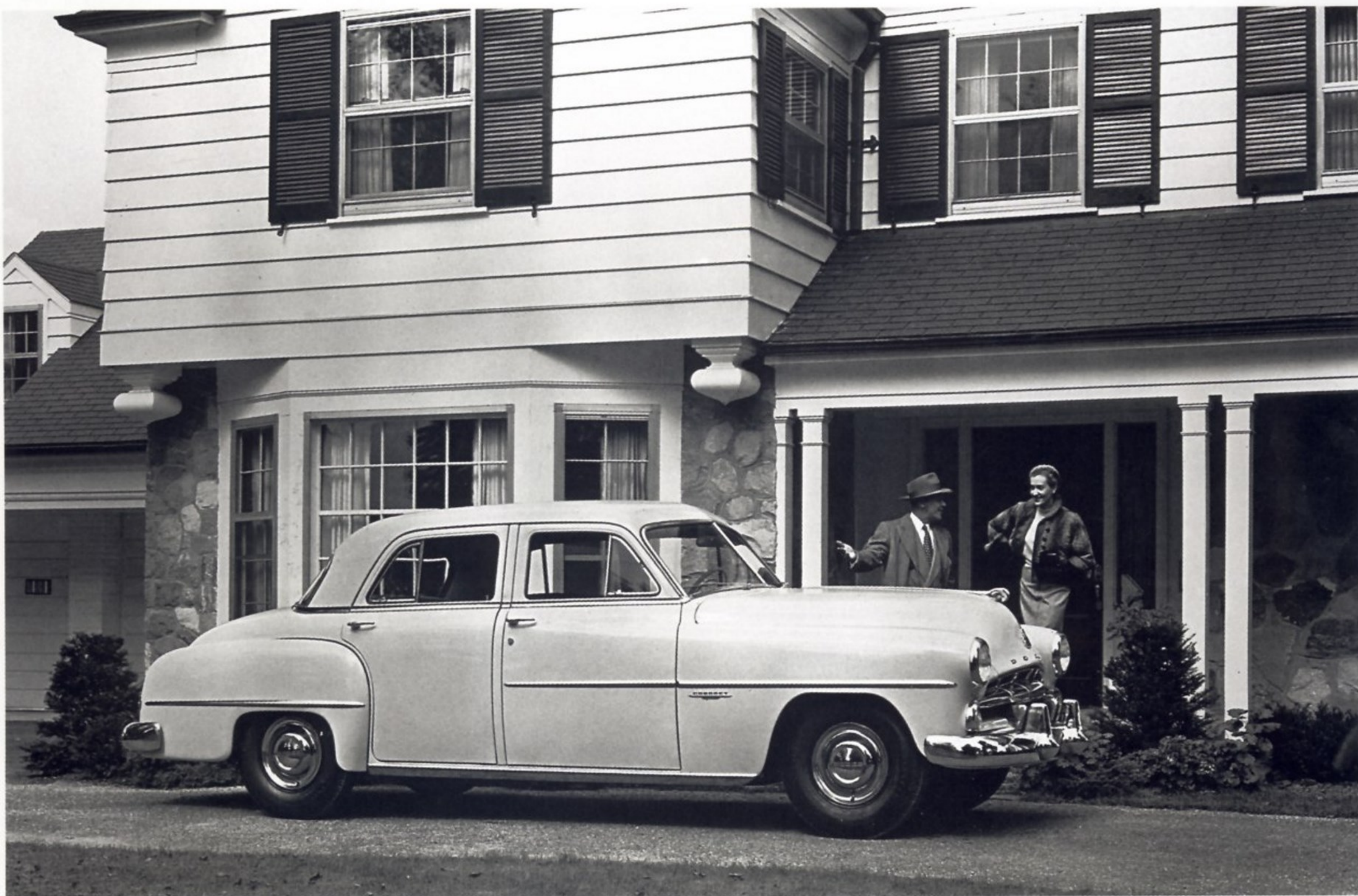
DODGE CORONET HEMI RT 1952 ГОДА, ПРИПАРКОВАННЫЙ ПЕРЕД ДОМОМ

Компания продолжала успешно развиваться до конца 20-х годов прошлого века, когда она попала в тяжелое финансовое положение и была приобретена другим американским производителем — Chrysler Corporation. Слияние пошло на пользу обеим маркам, и на протяжении 30-х годов Dodge выпустила несколько успешных моделей.