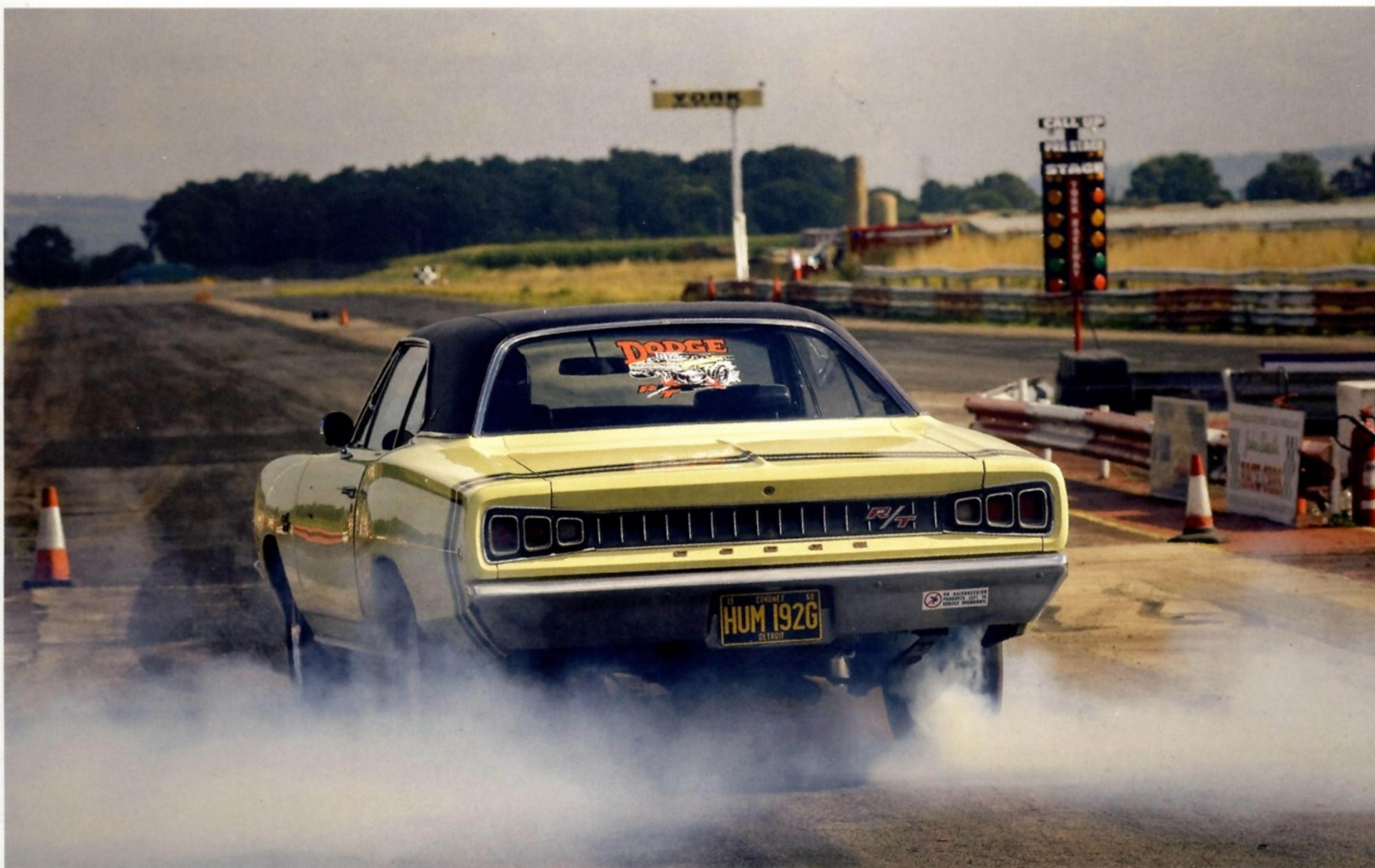
СОСТЯЗАНИЯ ВИНТАЖНЫХ АВТОМОБИЛЕЙ НА СКОРОСТЬ ВЕСЬМА ПОПУЛЯРНЫ В США. DODGE CORONET 1968 ГОДА СТАРТУЕТ В ОДНОМ ИЗ ТАКИХ ЗАЕЗДОВ

желающие могли приобрести машину с кузовом «универсал» или «купе» со съемным жестким верхом. В 1973 году на модели появилась система TorsionQuiet, позволявшая понизить уровень внутренних шумов в автомобиле за счет применения резиновых амортизационных прокладок.