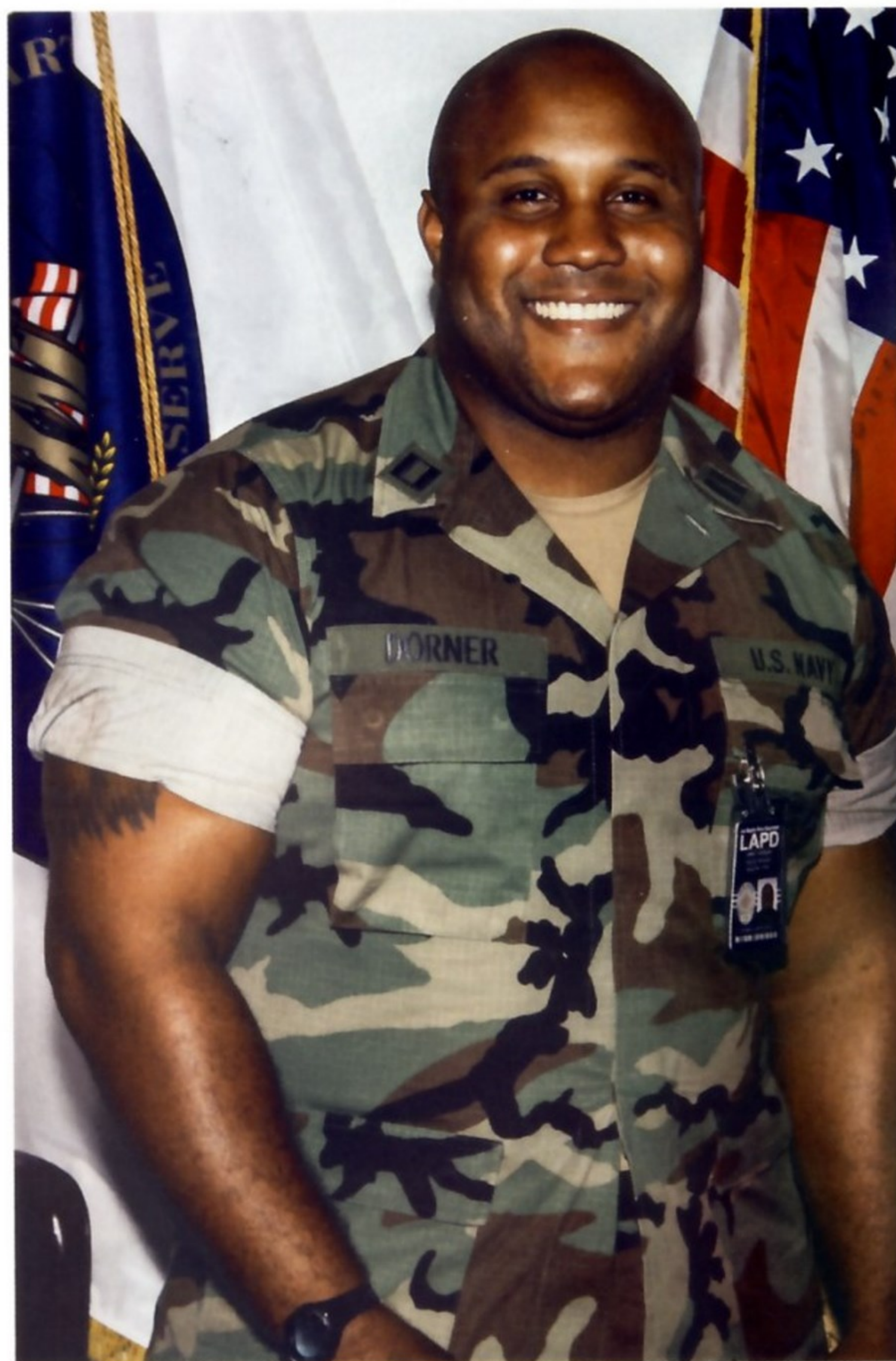
КРИСТОФЕР ДОРНЕР: КТО БЫ МОГ ПОДУМАТЬ, ЧТО ЭТОТ СИМПАТИЧНЫЙ ПАРЕНЬ ВСКОРЕ СТАНЕТ «ОХОТНИКОМ НА ПОЛИЦЕЙСКИХ»

Первыми жертвами экс-полисмана стали дочь одного из его бывших сослуживцев и ее жених. Потом он застрелил двоих полицейских, пытавшихся его арестовать. В городе и его окрестностях началась облава на «охотника на полицейских» — так окрестила Дорнера местная пресса. Операция по его поимке стала самой крупной в истории города: в ней принимало участие несколько тысяч человек, применялись вертолеты, оснащенные тепловизорами. Около