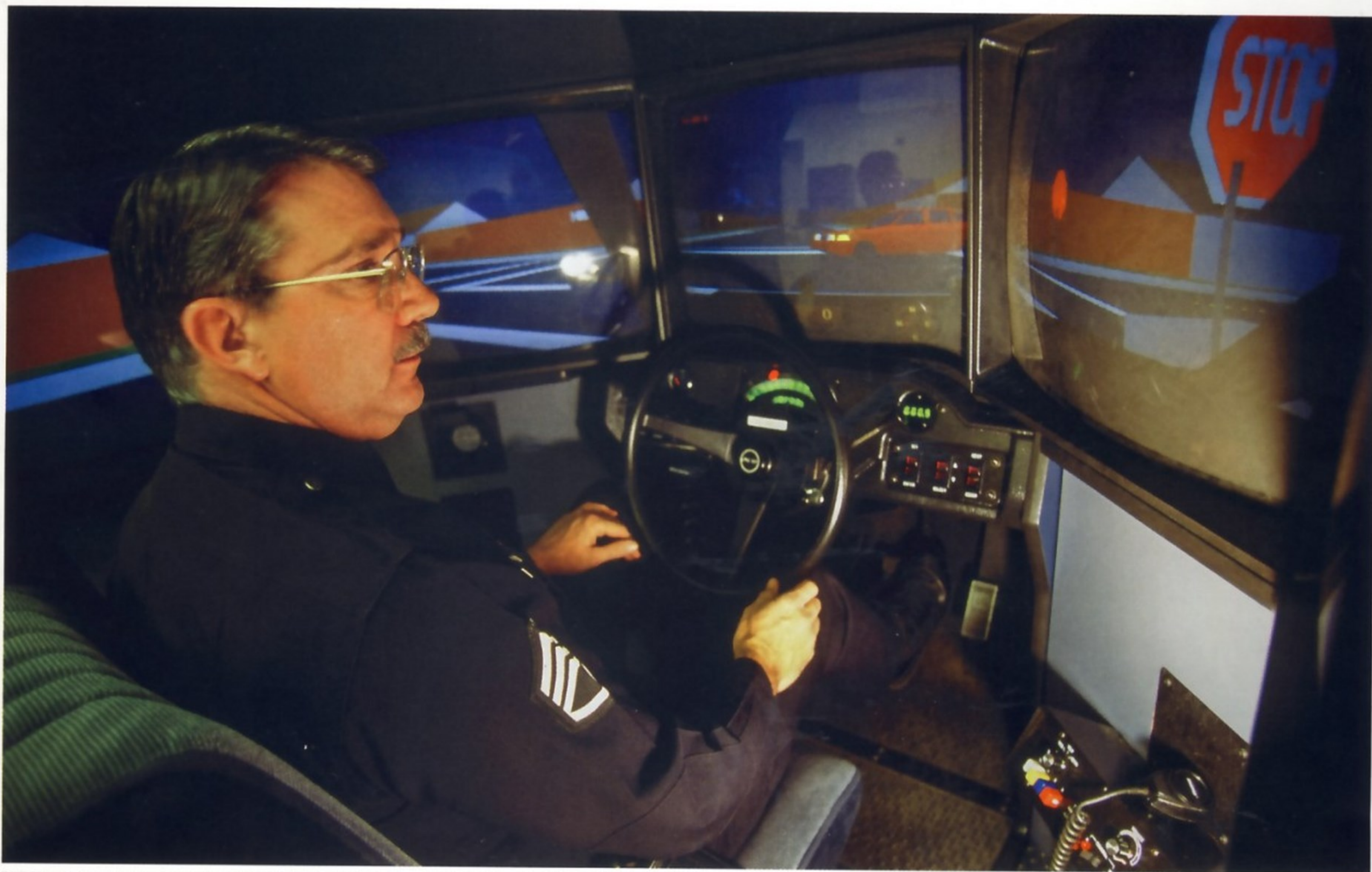
ВИРТУАЛЬНЫЕ ТРЕНИРОВКИ В ВОЖДЕНИИ АВТОМОБИЛЯ — НЕОБХОДИМАЯ ЧАСТЬ ПОДГОТОВКИ ЛОС-АНДЖЕЛЕССКИХ ПОЛИЦЕЙСКИХ

В 1965 году сотрудник департамента Джон Нельсон разработал программу для борьбы с угрозами, исходящими от радикальных политических организаций внутри США. Укреплению и развитию программы в немалой степени способствовал другой полицейский инспектор — Дерил Гейтс. Правда, многие считали, что Нельсон и Гейтс просто-напросто создали подразделение, основной задачей которого был поиск инакомыслящих. В качестве примера часто приводят историю борьбы с партией «Черные пантеры», выступавшей за равноправие афроамериканцев. Полицейские Лос-Анджелеса стали героями многочисленных литературных произведений, кинофильмов и телесериалов. Стоит вспомнить популярный сериал «Морская полиция: Лос-Анджелес», демонстрировавшийся несколько сезонов, или фильм Кёртиса Хенсона с участием Рассела Кроу «Секреты Лос-Анджелеса».