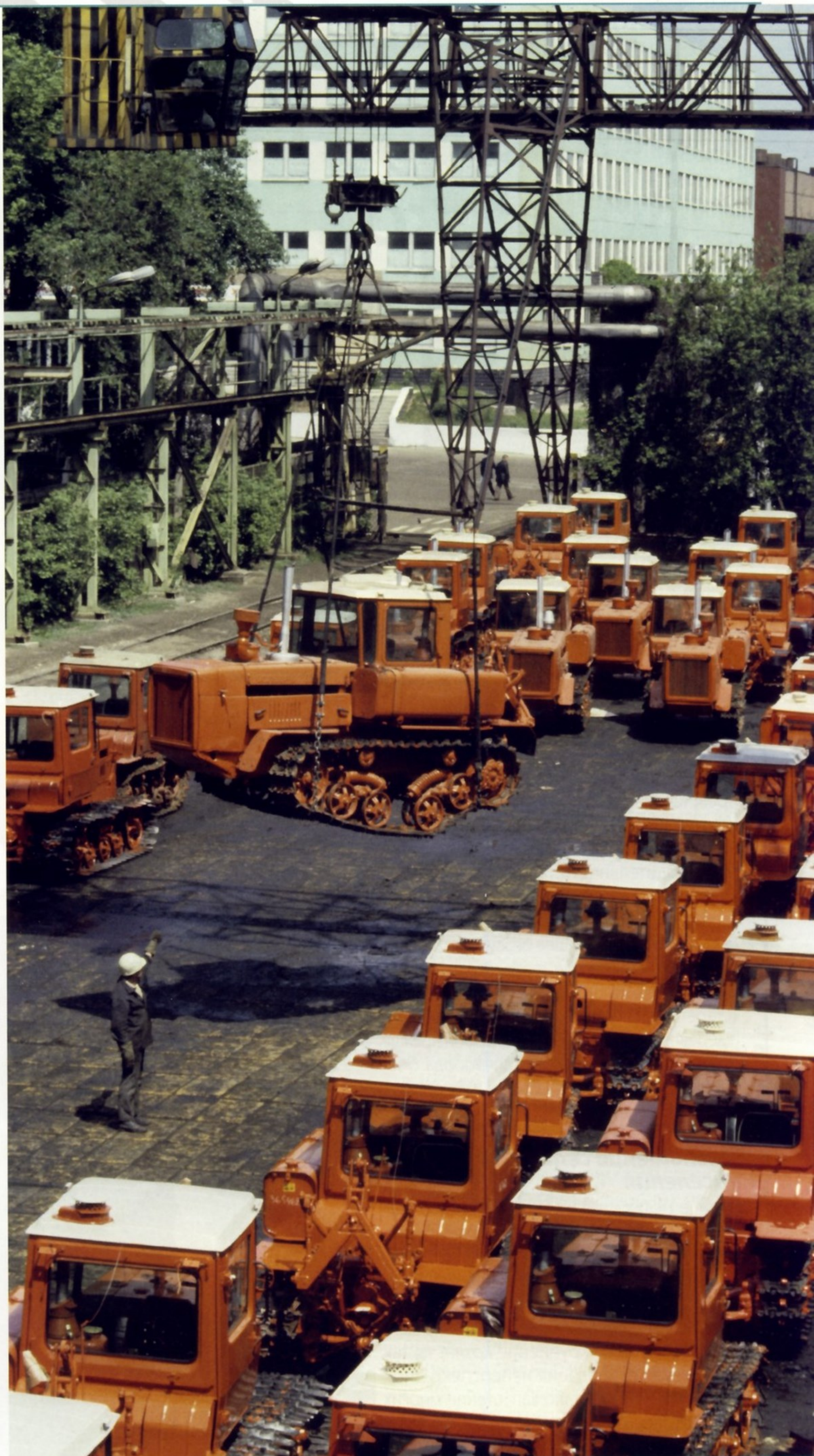
Первая партия тракторов «Волгарь».

Удобство управления трактором обеспечивается не только плавной гидромеханической трансмиссией, но и удобной компоновкой приборной панели. Большая площадь остекления дает отличный обзор и спереди, и сзади. Таким образом трактористу легко управлять как движением трактора, так и работой навесных орудий. Оба окна оборудованы стеклоочистителями, причем у заднего он ручной, а у переднего – электромеханический.