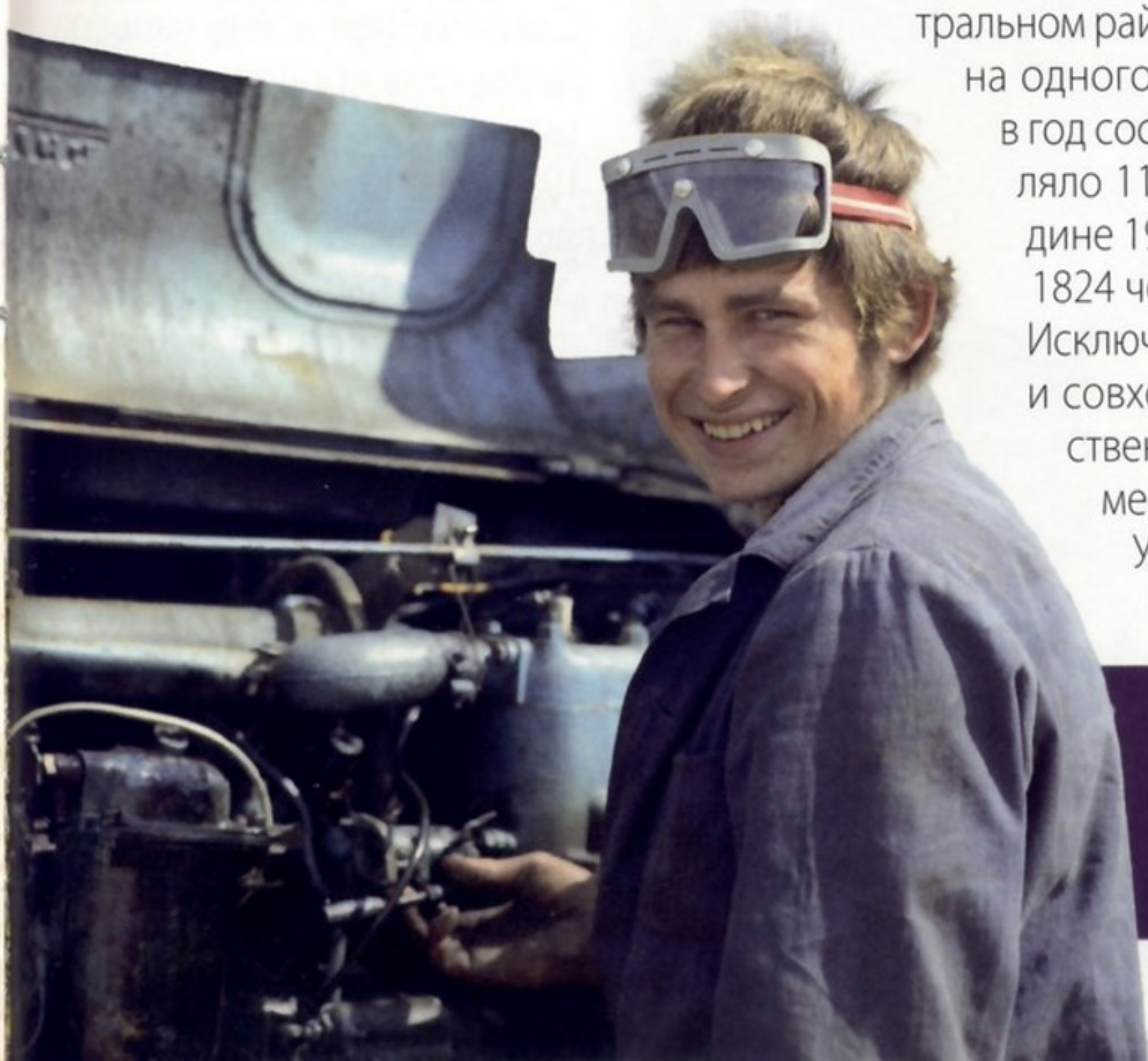
По понятным причинам хозяйства Московской области не так страдали от дефицита механизаторов, как провинциальные.

Самым же печальным следствием была потеря привязанности к земле, чувства ответственности за нее, поскольку люди не ощущали себя ее хозяевами. Одно из ярких проявлений этого – снижение доходов от личного подсобного хозяйства: к 1980 году их доля в совокупном доходе составляла 26,1 %, в 1985-м – 21,8, в 1988-м – 20 %. А одна из множества уже названных и неназванных причин – механическое перенесение черт городской застройки в село. С середины 1970-х годов в селах Центрального района России стали строить многоэтажные дома без надворных построек. Это вело к разрушению семейно-усадебного уклада жизни. Связь с природными циклами, близость к земле, содержание скота, обособленность семейной жизни, передающиеся из поколения в поколение навыки и традиции, прочные родственные и соседские связи, принципы самоуправления в селе – все эти особенности ушли. Вместе с индустриализацией сельского труда и быта крестьянин превратился в работника-поденщика, практически не заинтересованного в истинном результате своего труда.