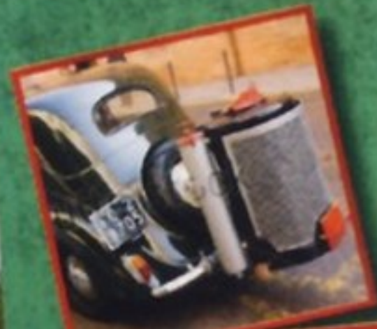
Принцип работы газогенератора