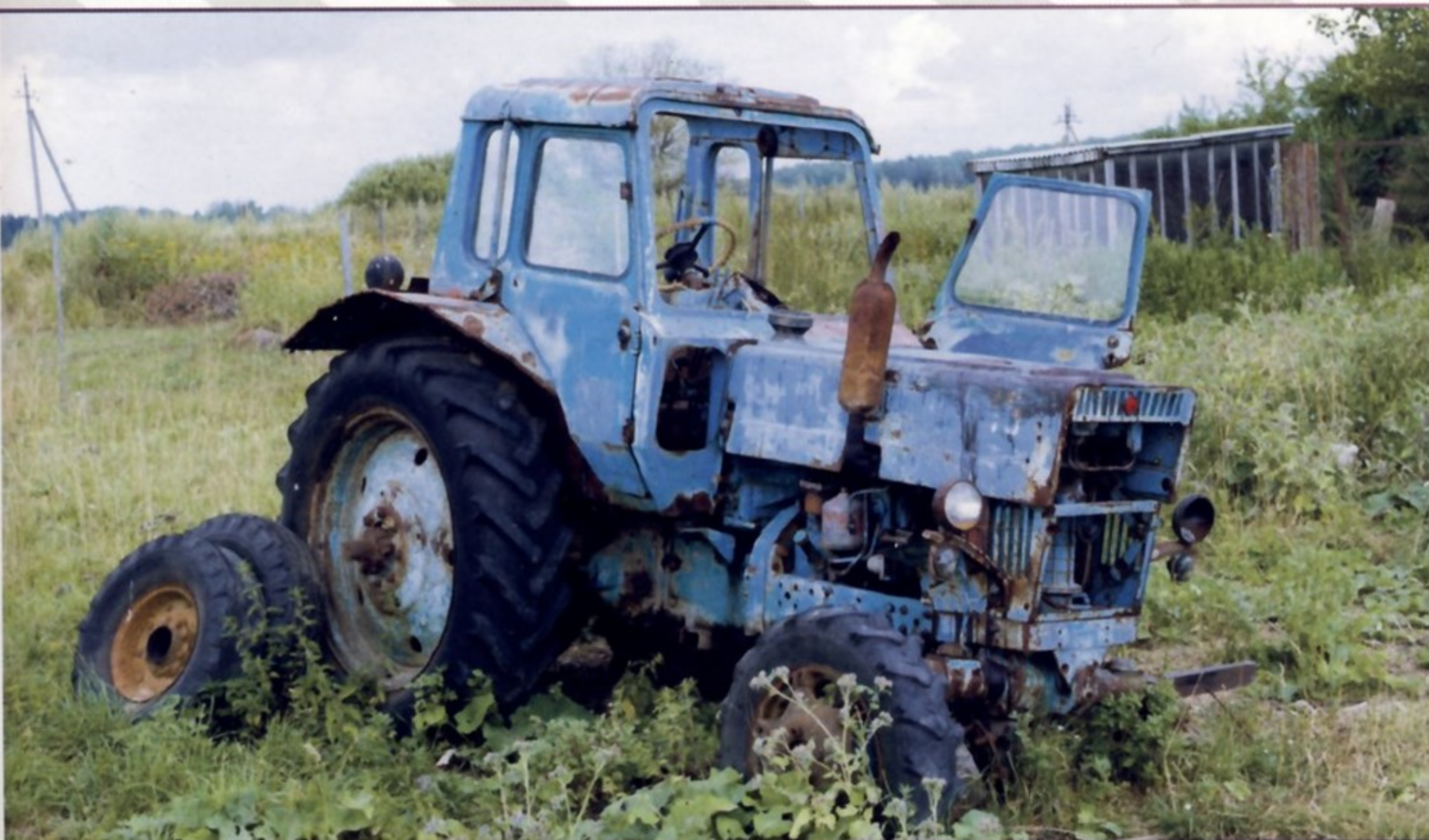
К 1980-м годам на тракторах порой некому было работать. Некому было и их ремонтировать.

Не задерживала людей в колхозах даже гарантированная теперь государственная зарплата, поскольку она не особенно улучшала условия жизни. Статистика в 1970-е годы фиксировала сокращение доли расходов на питание и непродовольственные товары и рост доли накоплений. У работников колхозов и совхозов росли вклады на сберкнижках, причем быстрее, чем у горожан. Но это демонстрировало не улучшение благосостояния, а неудовлетворенный спрос: из-за снижения товарных запасов в стране и горожанам нелегко было купить нужные вещи, а для жителей сел это становилось просто неразрешимой проблемой.