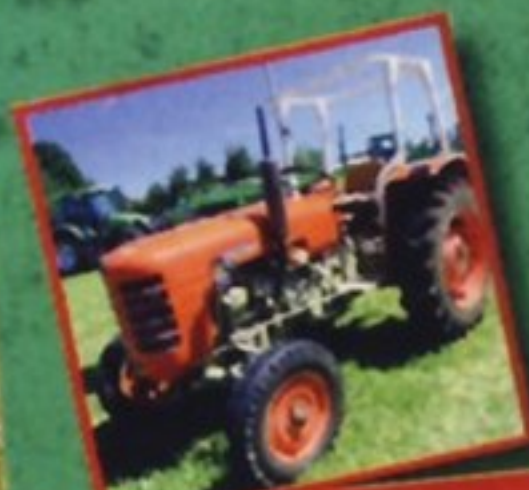
Чешские тракторы Zetor