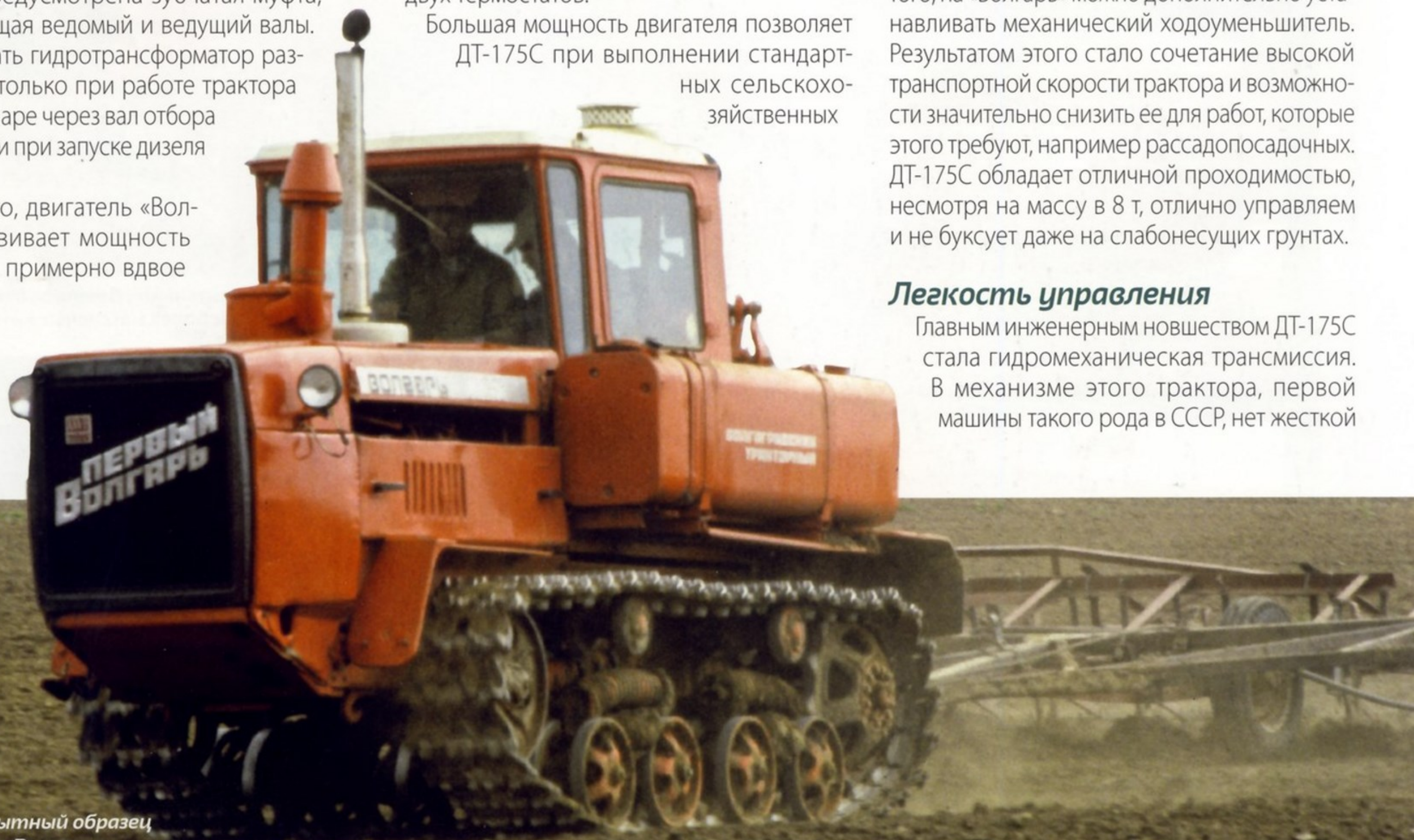
Первый опытный образец трактора «Волгарь».

Главным инженерным новшеством ДТ-175С стала гидромеханическая трансмиссия. В механизме этого трактора, первой машины такого рода в СССР, нет жесткой