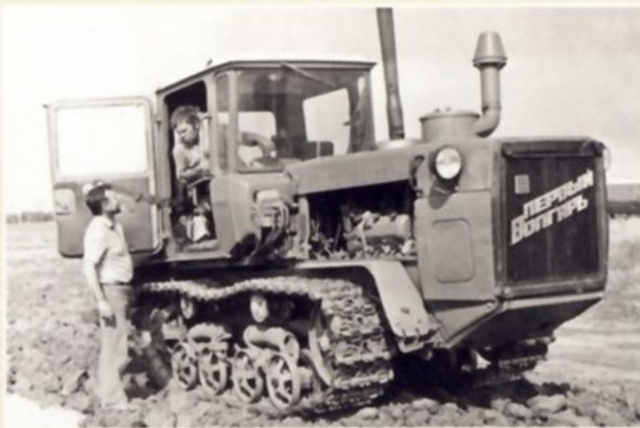
Кабина ДТ-175С обеспечивает трактористу довольно комфортные условия работы.