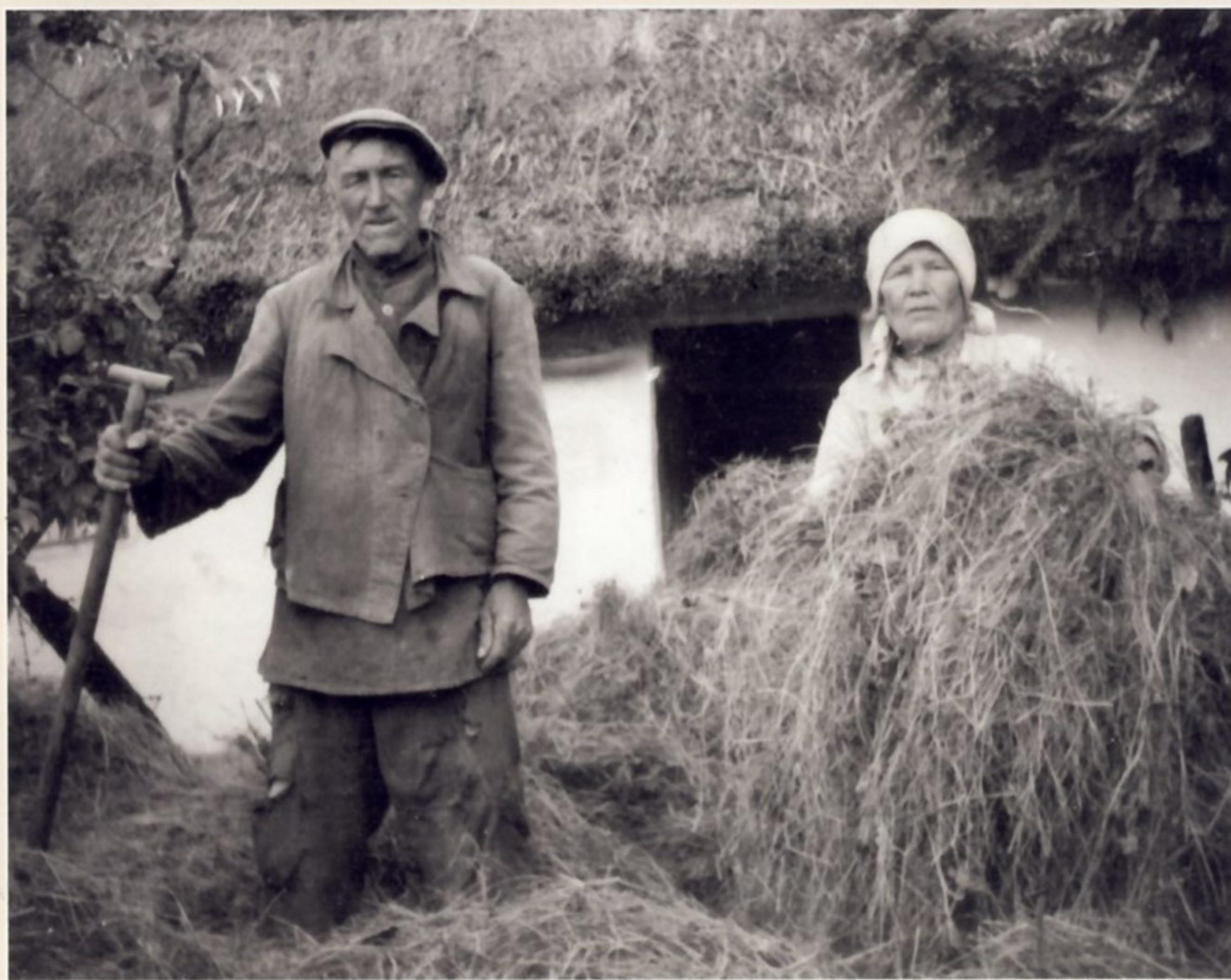
К 1980-м годам население деревень сильно постарело, особенно в РСФСР.

Кроме государственных компаний по реорганизации села были и другие причины миграции в города. Прежде всего, оставшийся очень низким уровень механизации большинства процессов в сельском хозяйстве, особенно в животноводстве. Так, к 1969 году на фермах крупного рогатого