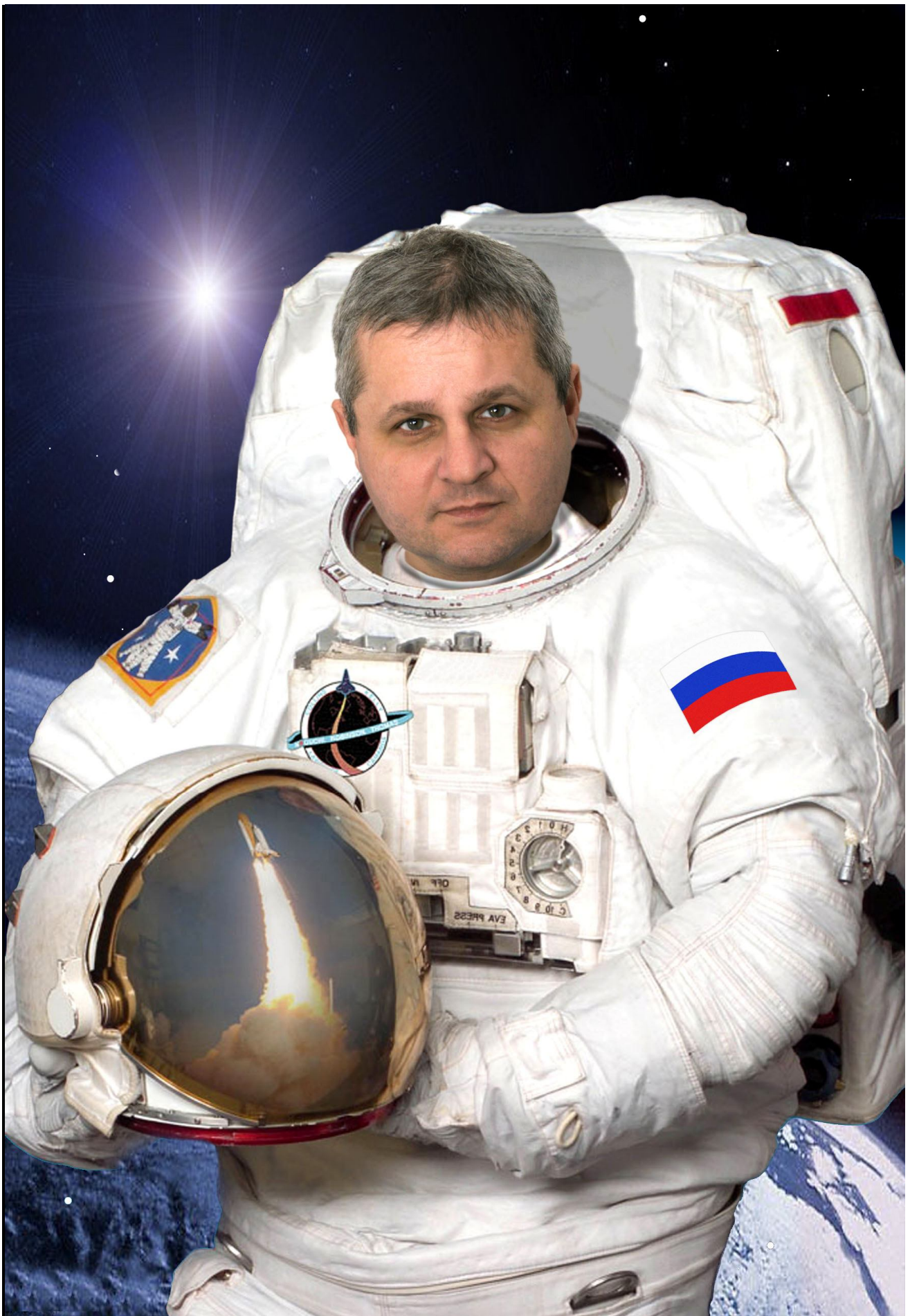
L una * O leg * V ladimirovich * E rmakov