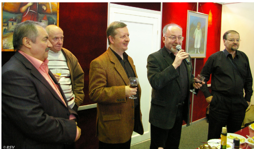
Открытие «Булгаковского бала»