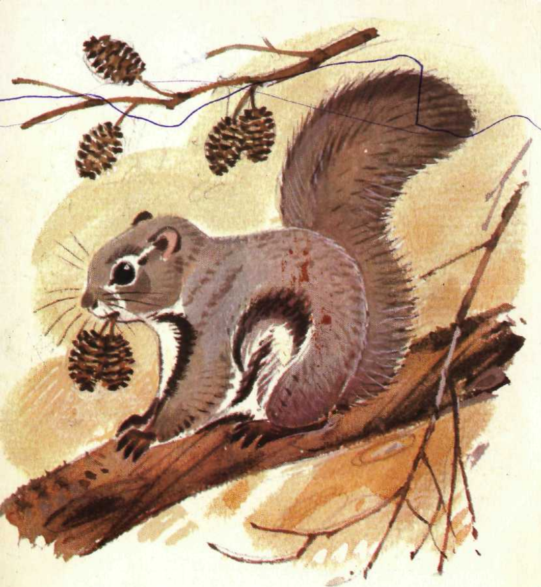
Летяга ольховые и берёзовые серёжки в своё дупло натаскала.