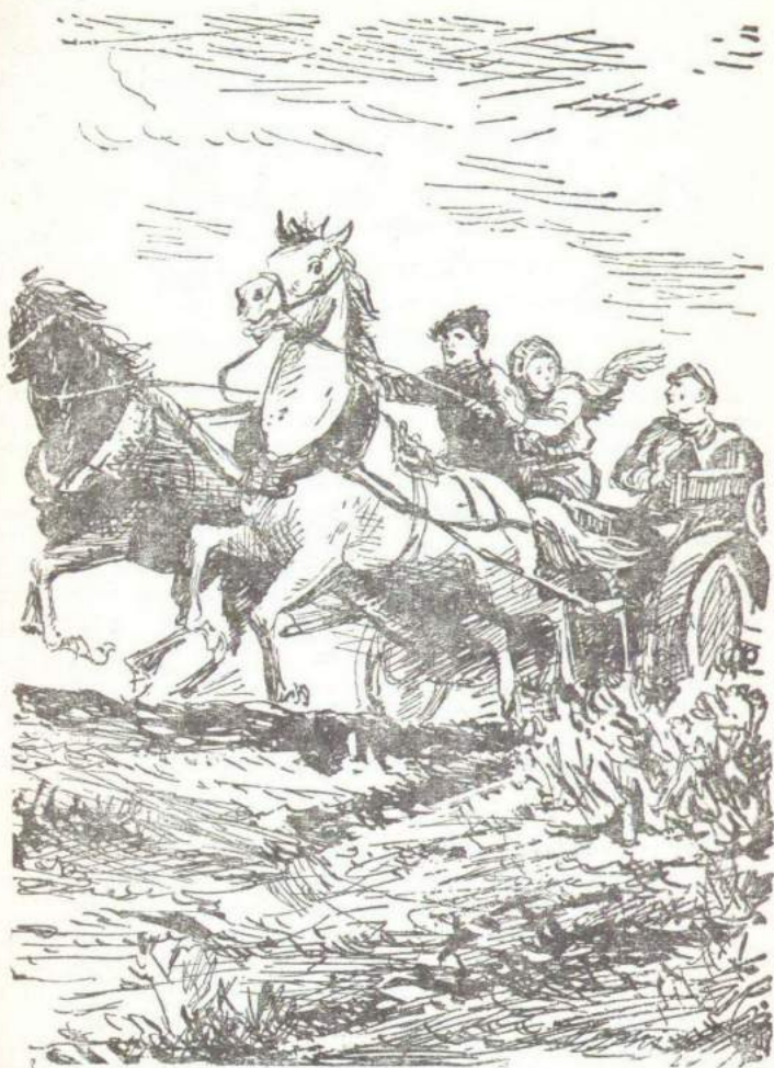
Семен, припав к пулемету, подпрыгивал на заднем сиденье.