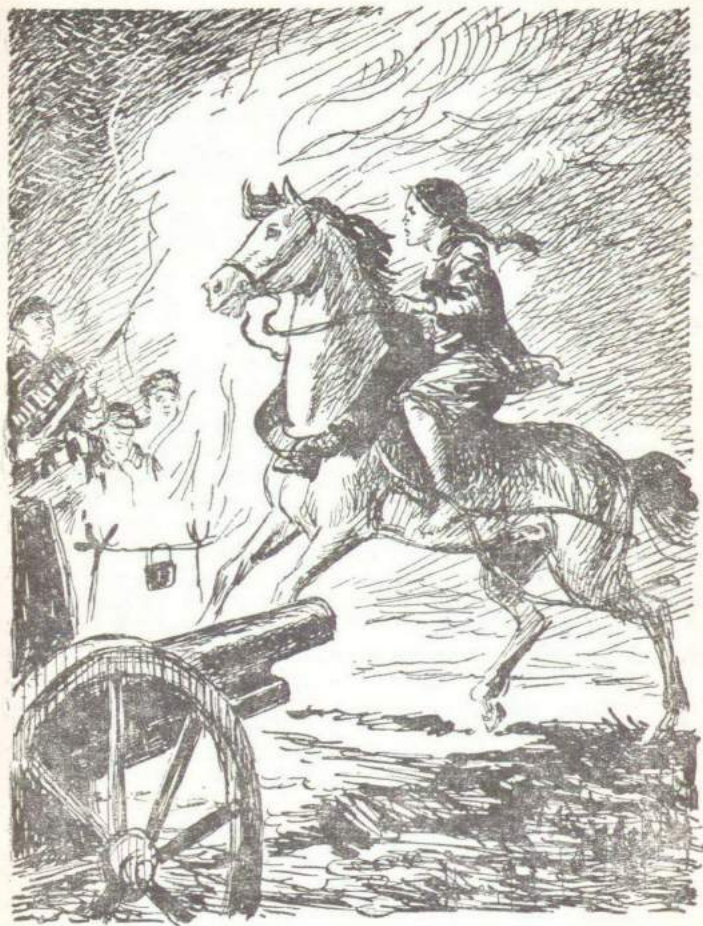
Это была действительно тот самый партизанский отряд.