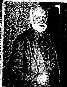
Кир БУЛЫЧЕВ: «Мне нужно писать рассказы...»