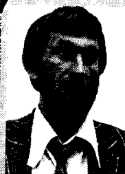
История советской фантастики-2: версия Геннадия ПРАШКЕВИЧА.