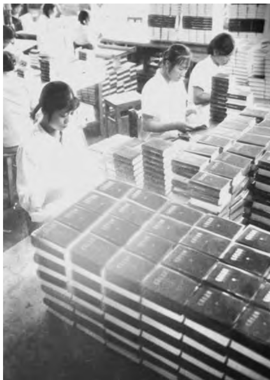
«Сборник изречений Председателя Мао»

В принятом пленумом Основном законе отчетливо прослеживается линия на ограничение функций коллегиальных органов ради укрепления личной власти Мао Цзэдуна и его ближайшего окружения. Несмотря на многократное упоминание о «диктатуре пролетариата», «демократии народа», о «новых формах, созданных народными массами» в 1966–1969 гг., вроде «широкого высказывания мнений, полного изложения взглядов, написания дацзыбао и проведения широких дискуссий» (ст. 13), в Конституции фактически закреплялось сложившееся в период культурной революции положение, когда граждане КНР были лишены элементарных демократических прав и свобод. В ст. 22 ревкомы были названы «постоянно действующими органами местных