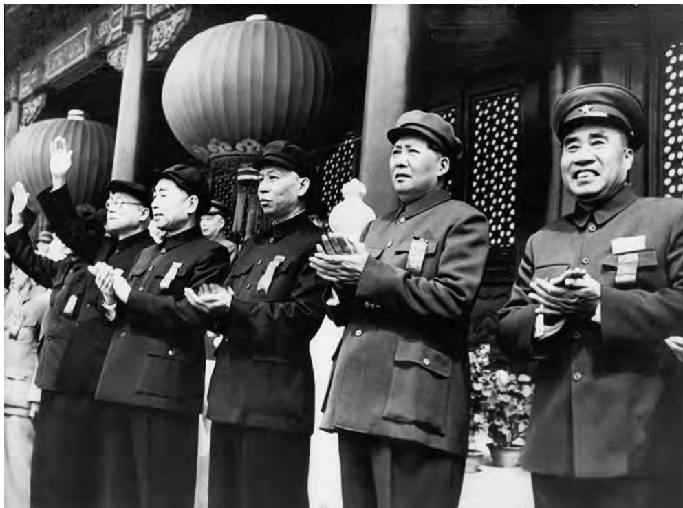
Справа налево: Чжу Дэ, Мао Цзэдун, Лю Шаоци, Чжоу Эньлай на Первомайской демонстрации в Пекине. 1952 г.

в форму китайскую». Лю Шаоци характеризовал «теоретические достижения Мао Цзэдуна» как «дальнейшее развитие марксизма в национально-демократической революции», «один из лучших образцов национальной формы марксизма». К 30-й годовщине КПК, в июле 1951 г., политический секретарь Мао Цзэдуна Чэнь Бода издал книгу «Идеи Мао Цзэдуна – соединение марксизма-ленинизма с китайской революцией». К той же дате был приурочен выход книги Ху Цяому «Тридцать лет Коммунистической партии Китая», в которой вся история революционной борьбы КПК освещалась сквозь призму личной деятельности Мао Цзэдуна. В сентябре 1951 г., апреле 1952 г. и апреле 1953 г. в КНР были выпущены заново отредактированные три тома «Избранных произведений» Мао Цзэдуна, охватывающие его работы, написанные в период с 1926 г. по август 1945 г. Издание трехтомника способствовало формированию образа Мао Цзэдуна как теоретика и пропагандиста коммунистического учения мирового масштаба.