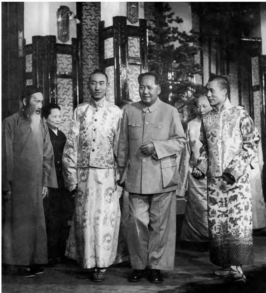
Мао Цзэдун с далай-ламой (справа) и панчэн-ламой (слева). Сентябрь 1954 г.

к новой власти, к иностранному влиянию на политическую, хозяйственную и экономическую жизнь страны. Важнейшими задачами считались привлечение руководителей религиозных организаций и течений к активному сотрудничеству с новой властью, нейтрализация и изоляция религиозных деятелей, враждебных ей.