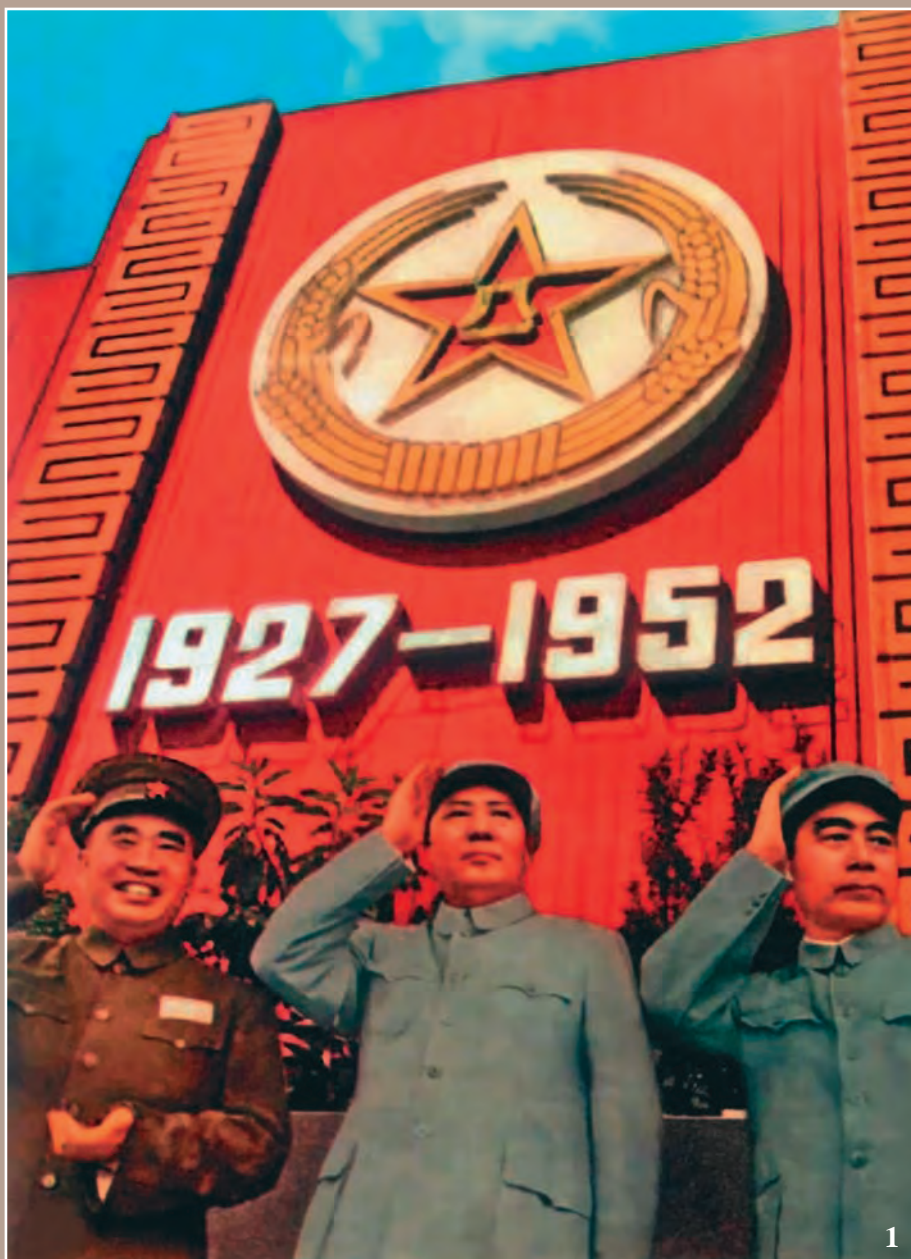
1 . Мао Цзэдун, Чжу Дэ и Чжоу Эньлай на всеармейской спартакиаде. 1952 г.