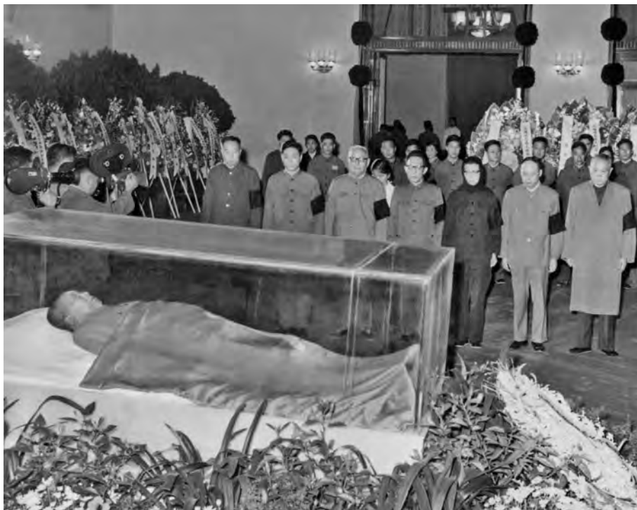
У гроба Мао Цзэдуна. Справа налево: Хуа Гофэн, Ван Хунвэнь, Е Цзяньин, Чжан Чуньцяо, Цзян Цин, Яо Вэньюань, Ли Сяньнянь. Сентябрь 1976 г.

жестокая засуха. Эти события были использованы местными кадровыми работниками для торможения и свертывания политической кампании критики, вместо того чтобы «углублять» ее, как требовали директивы ЦК. Поводами для таких действий стали задачи мобилизации всех сил для ликвидации последствий стихийных бедствий и помощи пострадавшим. Однако выдвиженцы культурной революции и в таких условиях настаивали на продолжении кампании.