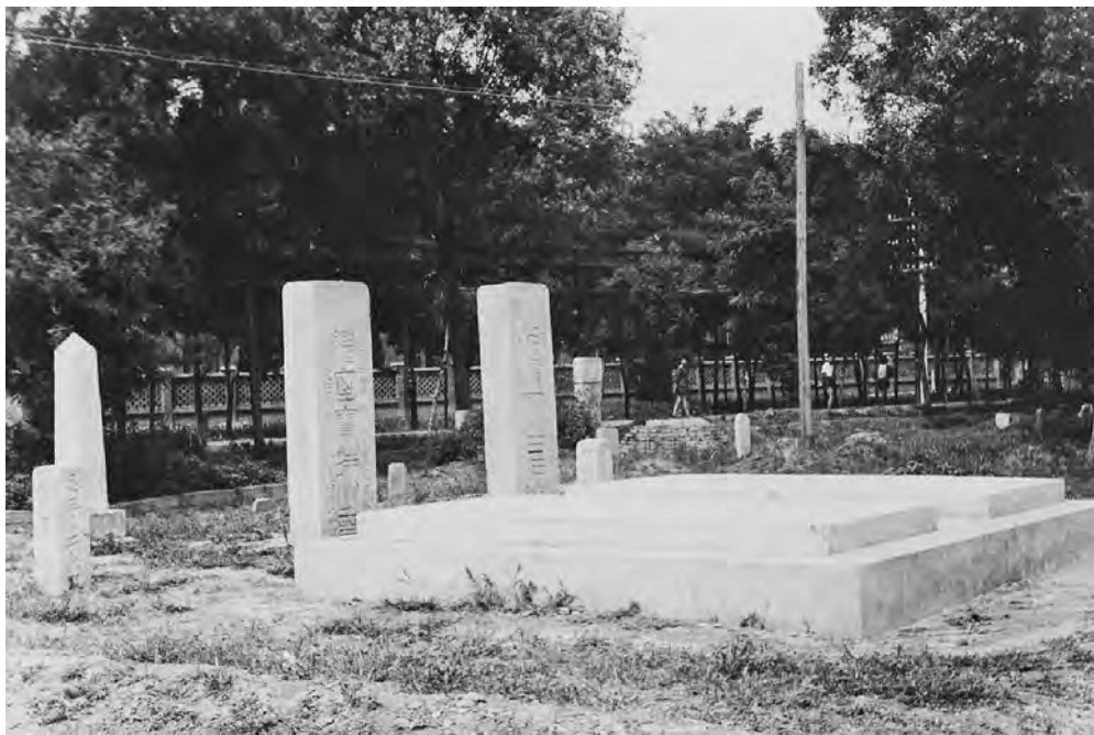
Могила известного художника Ци Байши, которую разрушили во время «культурной революции»

Во время обысков «вызывали подозрение», а значит, подлежали конфискации любые ценности: предметы антиквариата, каллиграфические свитки, иностранная валюта, золото, серебро, ювелирные изделия, музыкальные инструменты, живопись, фарфор, старые фотографии, манускрипты, научная литература, пластинки. То, что не уносили с собой, ломали и разбивали. В Шанхае в результате таких обысков конфисковали 32 т золота, 150 т жемчуга и нефрита, 450 т ювелирных изделий и более 6 млн долл. США наличными. В Пекине примерно за месяц было отобрано 5155 кг золота, 17260 кг серебра и 55 456 600 юаней наличными, 613 600 единиц материальных ценностей и драгоценностей. За 1966–1976 гг. у частных лиц было незаконно конфисковано 520 тыс. жилых домов и комнат, среди них 82 230 домов частных владельцев. Только в 12 районах Шанхая в тот же период было конфисковано 1240 тыс. кв. м частной площади.