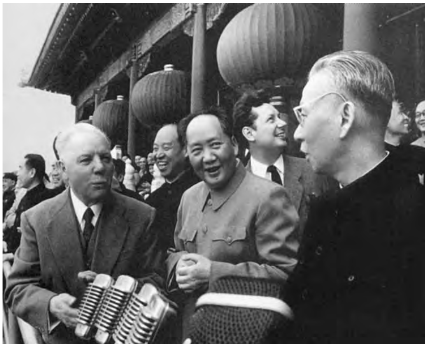
Мао Цзэдун и Лю Шаоци с председателем Президиума Верховного Совета СССР К.Е. Ворошиловым на трибуне Тяньаньмэнь. 1 мая 1957 г.

уже полностью или частично построены и стали выпускать соответствующую продукцию. ГДР, Чехословакия, Болгария, Венгрия, Польша и Румыния к концу пятилетки ввели в строй 27 промышленных объектов. В тот период КНР оказалась уже в состоянии, частично или полностью опираясь на собственные силы, спроектировать и оснастить оборудованием и сдать в эксплуатацию 413 крупных и средних промышленных объектов.