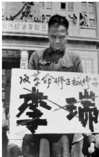
Одна из жертв «культурной революции» в Харбине

События в Гуанси вынудили ЦК КПК, Госсовет, Военный совет и ГКР направить в провинцию экстренную телеграмму «Пять указаний относительно восстановления транспортного железнодорожного сообщения в районе Лючжоу». Однако она не возымела действия. 3 июля 1968 г. от имени ЦК КПК, Госсовета КНР, Военного совета ЦК и ГКР по стране был разослан утвержденный Мао Цзэдуном более строгий документ «Уведомление о положении в Гуанси», предписывавший немедленно прекратить действия с применением силы, восстановить железнодорожное сообщение, вернуть оборудование и материалы, предназначавшиеся для Вьетнама, а также оружие и снаряжение, захваченное у НОАК, вернуть в деревню самовольно возвращавшуюся