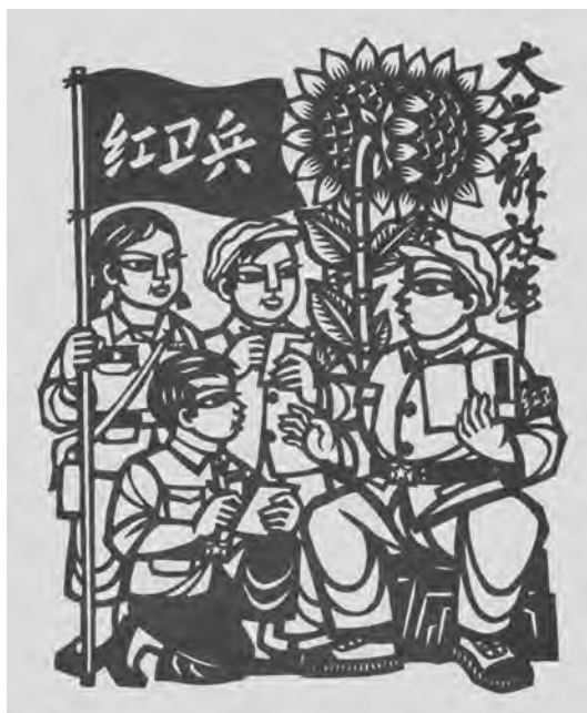
Вырезка из бумаги: «Хунвейбины учатся у Освободительной армии».