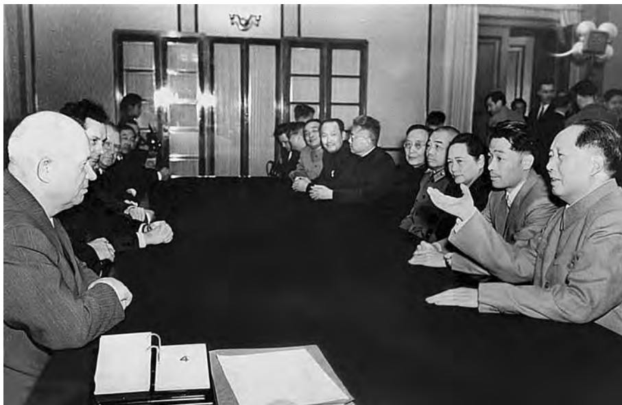
Беседа Н.С. Хрущева с Мао Цзэдуном в Москве в ноябре 1957 г.

издание советской литературы в КНР. За 1950–1958 гг. было переведено и издано более 13 тыс. названий произведений советских авторов общим тиражом около 230 млн экземпляров.