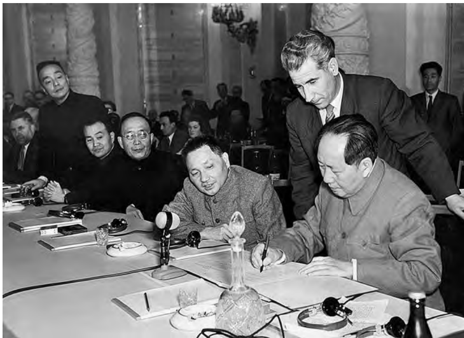
Мао Цзэдун от имени КПК ставит подпись под «Декларацией коммунистических и рабочих партий социалистических государств». Москва, ноябрь 1957 г.

в июле 1958 г. в Пекин. В ответ на просьбу китайской стороны о поставках советских атомных подводных лодок советская сторона выдвинула встречные предложения о создании совместной группировки военно-морского флота и совместном осуществлении строительства длинноволновой радиостанции, способной обеспечить связь с советским военным флотом в Тихом океане. СССР брал на себя 70% расходов по строительству. Предложения были негативно восприняты Мао Цзэдуном, который назвал их посягательством на суверенитет КНР.