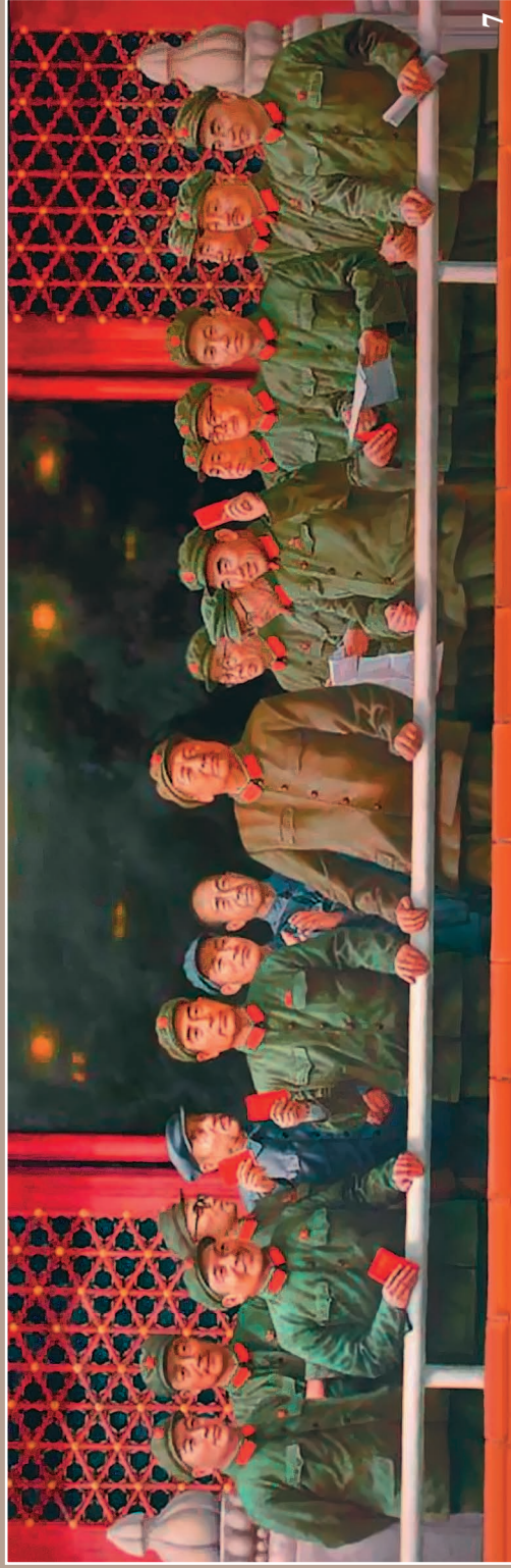
7. Плакат с изображением Мао Цзэдуна и его соратников на трибуне Тяньаньмэнь