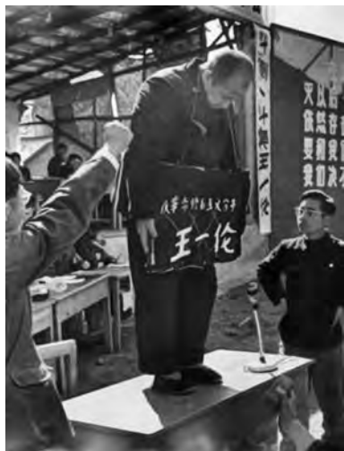
Публичные издевательства над людьми

замазали краской. В ходе бесчинств из 6843 исторических и культурных памятников Пекина, охраняемых с 1958 г. как национальное достояние, 4922 подверглись разрушению, причем большинство из них в августе–сентябре 1966 г. Акты вандализма продолжались и впоследствии: так, с 9 ноября по 7 декабря 1966 г. хунвэйбины организации «Цзинганшань чжаньдоу бинтуань» («Корпус имени боев в Цзинганшане») Пекинского педагогического университета уничтожили 66 культурно-исторических памятников столицы.