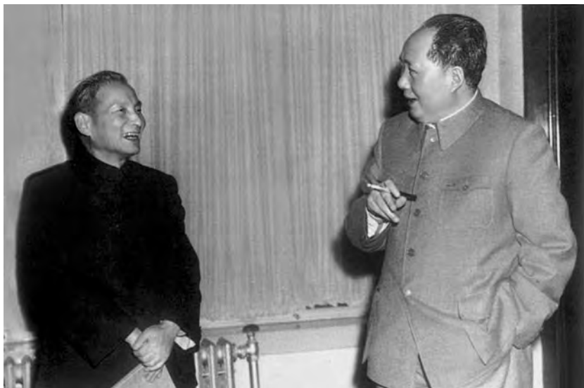
Мао Цзэдун и Чэнь Юнь. 1961 г.

экономическим вопросам идеологическую окраску и связать их с поисками внутренних врагов. На пленуме Дэн Сяопин от имени Секретариата ЦК КПК заявил о создании 10 групп, ответственных за проведение в жизнь намеченного пленумом курса, в первую очередь в экономике и на транспорте. Возглавлять работу групп должен был кандидат в члены Политбюро ЦК КПК, руководитель Комитета по экономике Бо Ибо, а в его отсутствие – заместитель премьера Госсовета КНР, руководитель Комитета по капитальному строительству Гу Му.