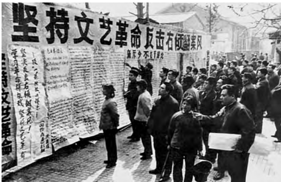
Дацзыбао в кампании против пересмотра дел «правых уклонистов»

и своевременными» и призывая на местах действовать так же. Однако его оппоненты так не считали. Цзян Цин, Чэнь Бода, Кан Шэн и их сторонники сначала всячески провоцировали студентов, а затем представляли доклады Мао Цзэдуну.