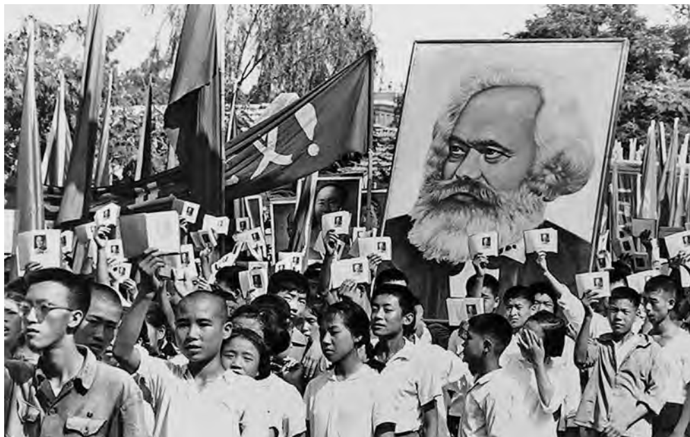
Молодежь с цитатниками Мао Цзэдуна. Пекин, 1966 г.