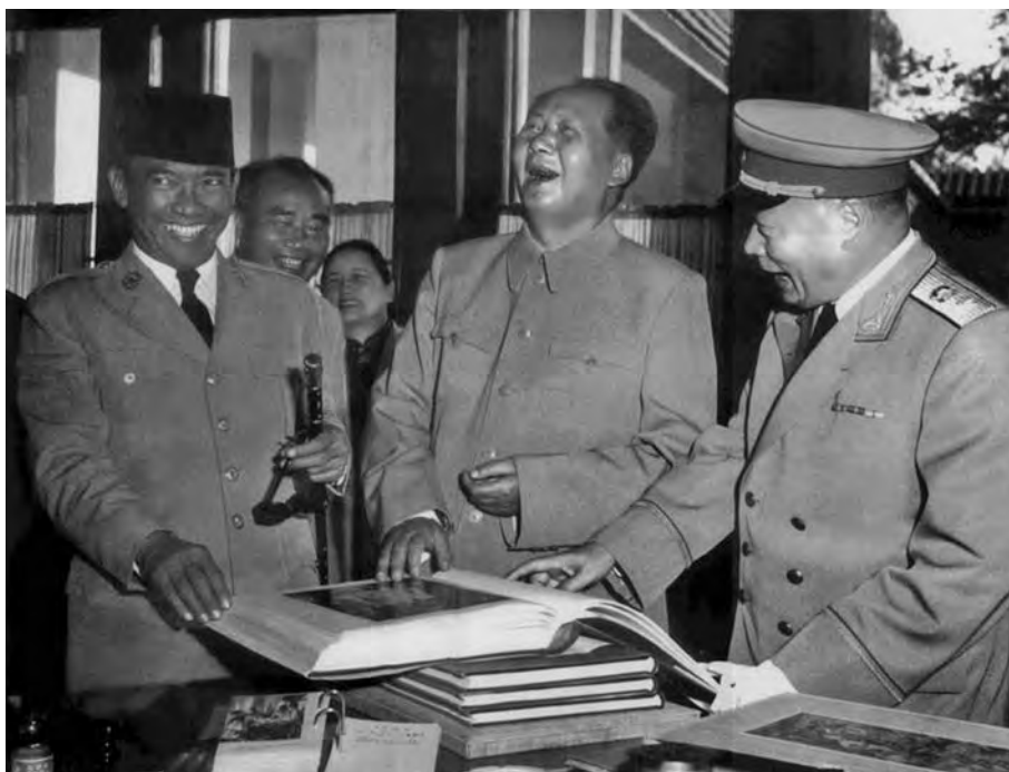
Визит президента Индонезии Сукарно в Пекин в 1956 г. Справа налево: Чэнь И, Мао Цзэдун, Сун Цинлин, Чжу Дэ, Сукарно

Помимо этого война в Корее привела к серьезной международной изоляции Китайской Народной Республики, прежде всего со стороны стран Запада. Несмотря на все усилия нового руководства, КНР признали лишь страны социалистического лагеря и отдельные развивающиеся страны. Большинство стран мира продолжали поддерживать дипломатические отношения с Китайской Республикой на Тайване.