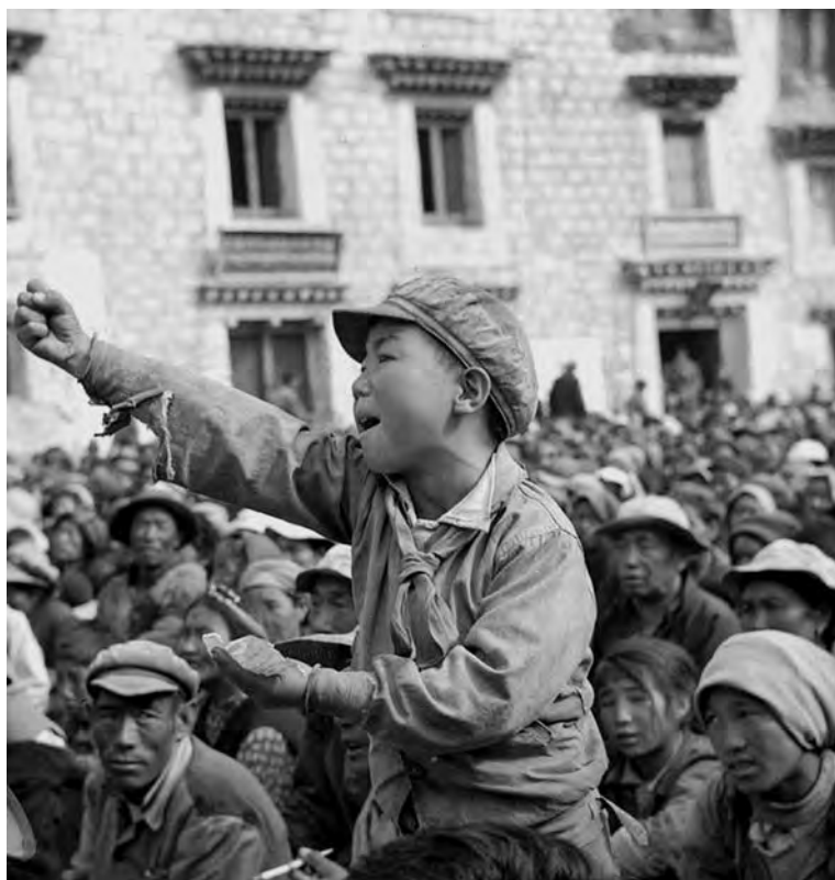
Маленький участник «культурной революции»

тельно охранять ЦК партии и председателя Мао, стать молодой сменой тех, кто отстаивает «идеи Мао Цзэдуна». По «характеру» организация хунвэйбинов должна была быть пролетарским революционным авангардом из людей «пяти красных категорий»: детей рабочих, крестьян, солдат, революционных кадровых работников и детей погибших революционеров. В ее задачи входили борьба, критика и преобразования; поддержка вьетнамского народа в его борьбе против США; уничтожение старого мира и построение нового; осуществление деятельности под руководством «комитетов по делам культурной революции». Условия приема предполагали допуск в организацию детей «революционных кадров» из семей рабочих, крестьян, бывших бедняков и низших середняков. Дети погибших революционеров, если среди их родителей, родственников и друзей были «разложившиеся элементы», в хунвэйбиновские организации не допускались. Их участники обязывались выполнять «три великих правила дисциплины и памятку из восьми пунктов». Ослушники, нарушители дисциплины и политики партии должны были быть наказаны организацией. Прием в организацию осуществлялся при наличии внешней рекомендации, решением организации после «массового обсуждения» и проверки