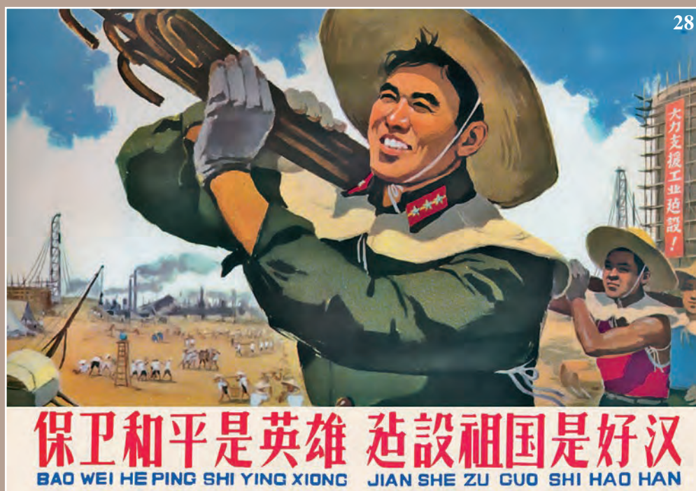
27. Плакат «Получим еще больший урожай в дар социализму» 28. Плакат «Слава защитникам и строителям промышленности»