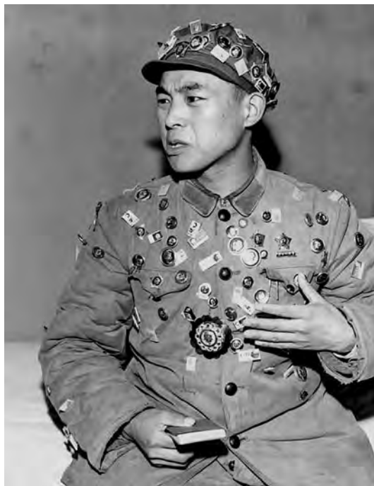
«Эпидемия» поклонения значкам с изображением Мао Цзэдуна

В марте–апреле 1967 г. проводниками культурной революции была развернута деятельность по «захвату предателей» и «широкой революционной критике».