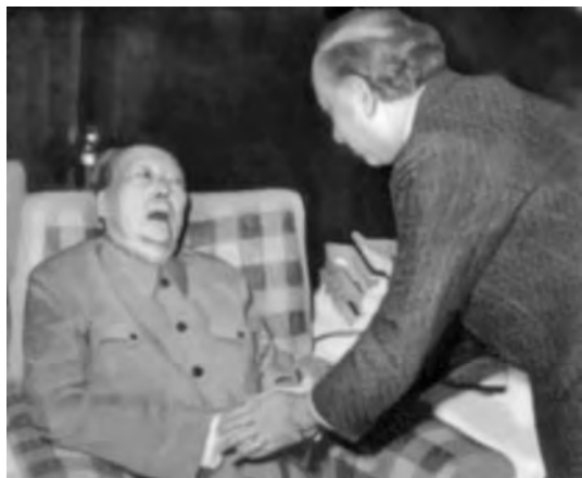
Мао Цзэдун (последняя прижизненная фотография) и премьер-министр Пакистана Бхутто. 27 мая 1976 г.

Кайши и загнал его на острова. В результате восьмилетней войны с Японией заставил японцев вернуться к себе домой. Не так уж много людей признают эти вещи. И всего лишь несколько человек прожужжали мне все уши, советуя поскорее вернуть эти острова. Другую вещь вы все знаете — это развертывание великой культурной революции. Тех, кто ее поддерживает, немного, а тех, кто выступает против — немало. Оба дела еще не окончены. Это наследие следует передать следующему поколению. Как передать? Если не удастся мирным путем, надо будет сделать это путем потрясений.