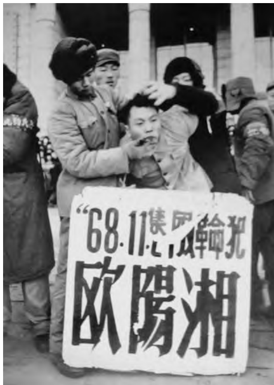
Издевательства над людьми в годы «культурной революции»

Однако, судя по дальнейшим событиям, данный список не являлся постоянной охранной грамотой от нападков «красных охранников». Так, в Тайюане (пров. Шаньси) семья известного гоминьдановского генерала Фу Цзои, в 1949 г. без боя сдавшего Пекин коммунистам и впоследствии считавшегося «революционным кадровым работником», подверглась нападению 150 хунвэйбинов – учащихся средней школы. В течение семи суток они издевались над ним и его семьей, били, оплеывали, не давали спать. В результате «критики и борьбы» старый генерал скончался. До этого учащиеся «разобрались» со своими учителями: более чем 70 преподавателям надели шутовские колпаки, повесили на грудь таблички с перечислением обвинений, затем всех выслали в деревню. С середины августа до середины сентября 1966 г. из Тайюаня было выслано 270 тыс. человек. Порядок изгнания определялся специальным документом, присланным сверху. Предписывалось направлять высылаемых по месту их рождения, а уроженцев города – в отдаленные районы провинции. Каждую отправляемую семью должны сопровождать трое-четверо «революционных учащихся». Билеты «сопровождавших» и их питание в пути должны были оплачивать изгоняемые. В дороге им не разрешали снимать «шутовские колпаки» и таблички, запрещалось даже садиться в поезде на скамьи. В лучшем случае можно было сесть на пол, и то лишь при дальних переездах.