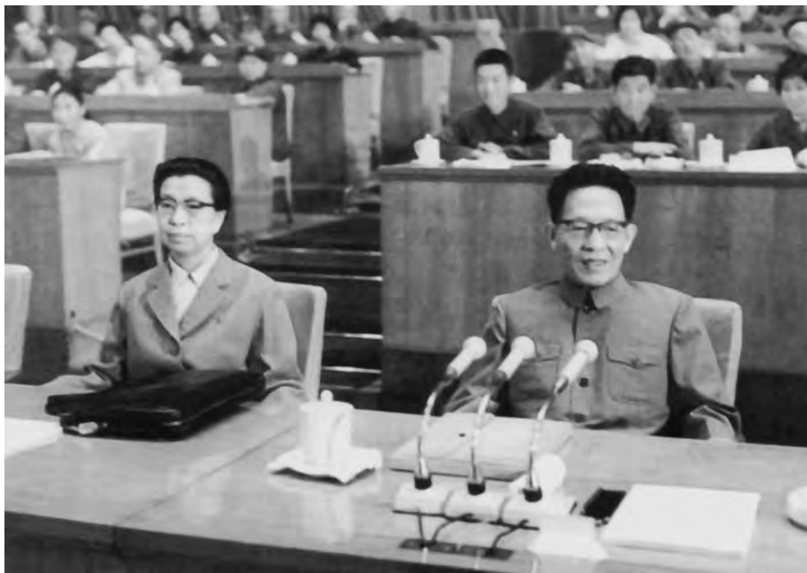
Цзян Цин и Чжан Чуньцяо на X съезде КПК

и искусства, просвещения и здравоохранения, «поддерживать социалистическую новь», возникшую в ходе культурной революции, и т.д. Вместе с тем в докладе были провозглашены и требования «усиливать планирование и координацию», «совершенствовать разумные правила и распоряжки», «выполнять и перевыполнять государственный план развития народного хозяйства».