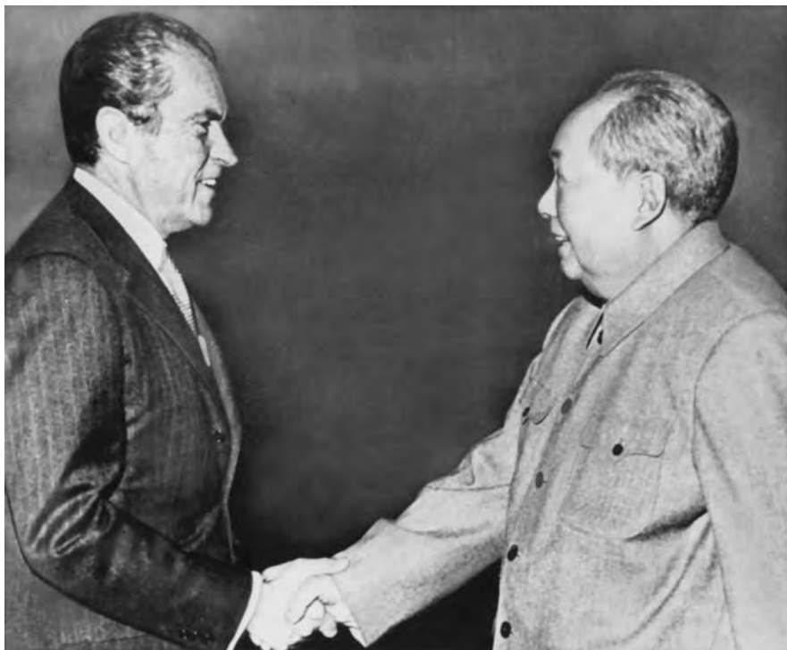
Рукопожатие Мао Цзэдуна и президента США Р. Никсона в Пекине в 1972 г.

странами Северной Америки и юго-западной части Тихого Океана, включая Канаду, Австралию и Новую Зеландию.