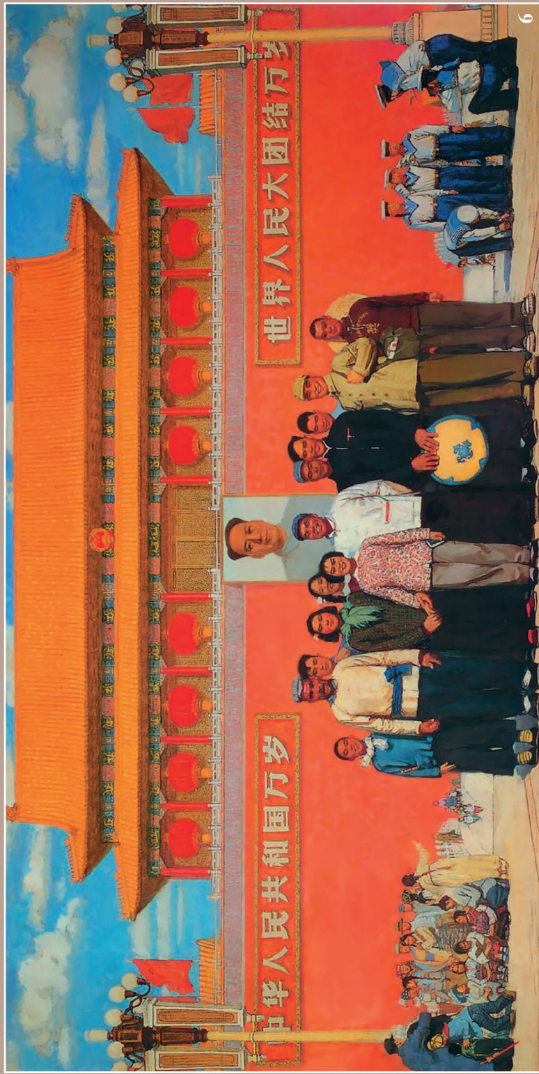
6. Картина «Перед воротами Тяньаньмэнь». 1964 г.