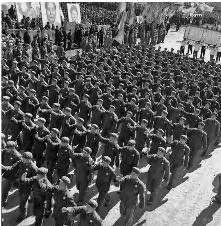
Армия клянется в верности вождю

и заместитель начальника Генштаба Янь Чжунчуань. Группу прикрепили к отделу оперативного планирования Генштаба. В сентябре Госсовет КНР и Военный совет ЦК КПК распространили директиву о необходимости «строительства коммуникаций» в военных целях. Еще в 1968 г. Чжоу Эньлай утвердил план строительства шоссейных дорог для усиления обороны страны в 1969 г. Планировалось построить 26 шоссейных дорог и продолжить строительство 37, инвестировать в это строительство 200 млн юаней. В течение трех лет, начиная с 1970 г., в северных районах страны предполагалось построить 33 шоссейные дороги общей протяженностью 6095 км.