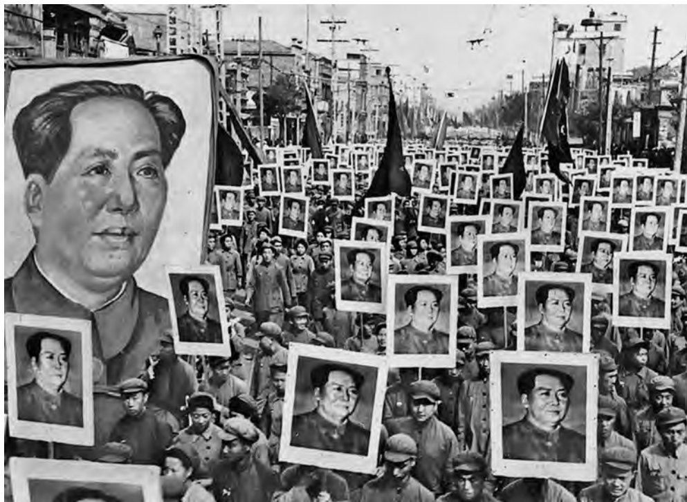
Демонстранты с портретами вождя. Пекин, 1966 г.

о ниспровержении Чэнь И и предложить ему вернуться к руководству работой МИДа.