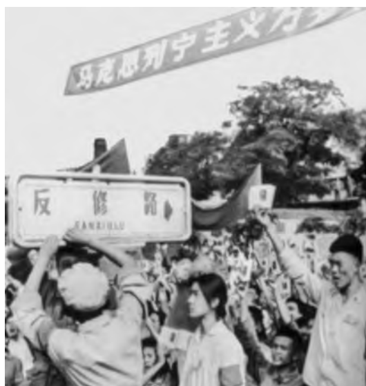
Переименование улицы, ведущей к посольству СССР в КНР, в «Улицу борьбы против ревизионизма». 1966 г.

Советское посольство в Пекине в августе 1966 г. подвергалось круглосуточной и жестокой осаде в течение полумесяца, с применением громкоговорящих устройств, изрыгавших угрозы в адрес сотрудников посольства. 17 августа большая группа военнослужащих в гражданской одежде ворвалась на территорию посольства, разбила будку дежурного, перебила стекла в служебном здании. Было объявлено о переименовании улицы, на которой расположено советское посольство, в «Улицу