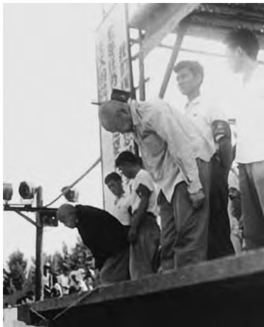
Публичные издевательства над Пэн Дэгуа (слева) и Чжан Вэньтянем. 26 июля 1967 г.

Помимо него в декабре 1966 – начале 1967 г. опале подвергся целый ряд кадровых работников высшего ранга: Пэн Чжэнь, Лю Жэнь, Вань Ли, Чжэн Тяньсян, Лу Динъи, Чжан Вэньтянь, Линь Фэн, Ян Сяньчжэнь, Ли Вэйхань, Цзян Наньсян, Лу Пин, Ян Шо, Чжоу Ян, Линь Мохань, Тянь Хань, Ян Ханьшэн, У Хань, Ло Жуйцин, Сяо Сянжун и Лян Бие.