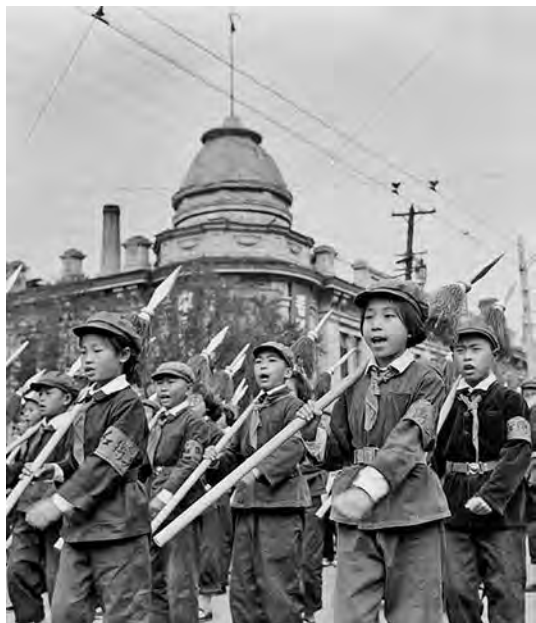
Маленькие хунвэйбины маршируют по улицам Харбина

на практике потеряли роль авангарда» среди детей. Их заменили отряды хунсяобинов («красных солдатиков»), которые были созданы во всех начальных школах и просуществовали около 11 лет.