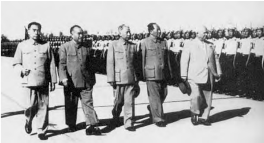
Чжоу Эньлай, Чжу Дэ, Лю Шаоци, Мао Цзэдун, Н.С. Хрущев в аэропорту Пекина. 30 сентября 1959 г.

Трещину в союзнических связях КНР и СССР явственно обнаружил китайско-индийский пограничный конфликт. Если во время тайваньского кризиса 1958 г. Москва решительно поддержала Пекин, то в территориальном споре с Индией она отказала ему в поддержке, ограничившись заявлением ТАСС от 9 сентября 1959 г., призывавшем обе стороны разрешить возникший между ними спор «в духе традиционной дружбы». Мао Цзэдун расценил