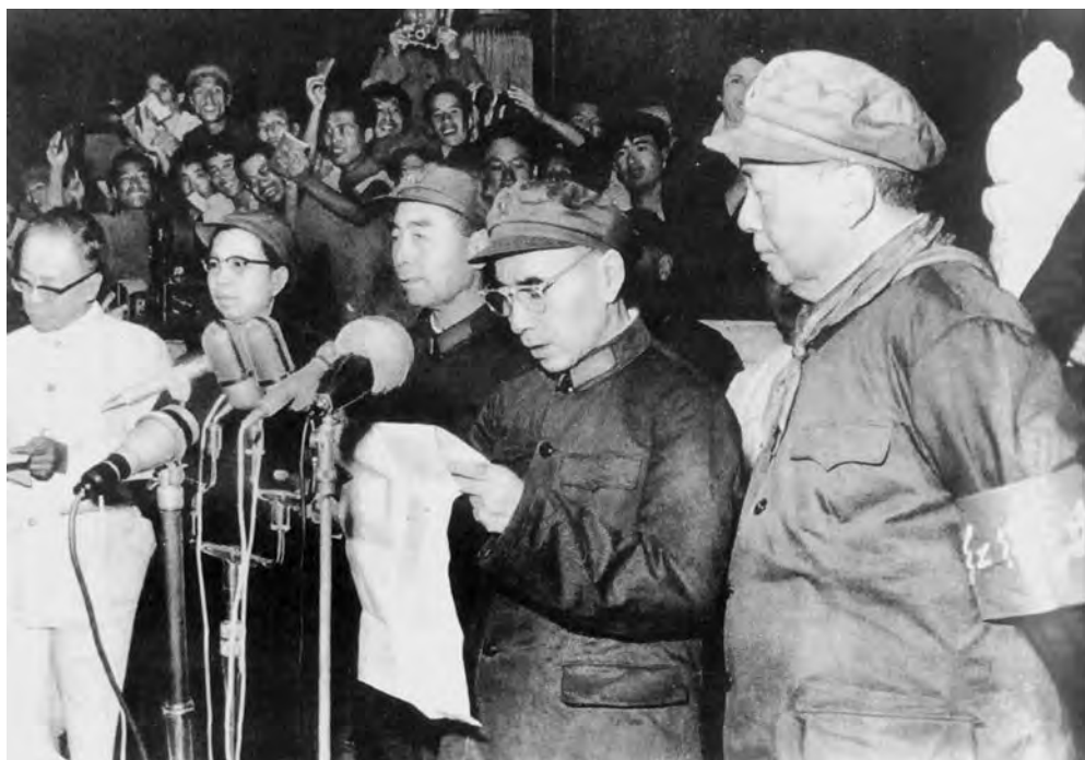
Слева направо: Кан Шэн, Цзян Цин, Чжоу Эньлай, Линь Бяо, Мао Цзэдун

Решения пленума принимались в закрытом порядке. Единственным открыто опубликованным документом стало Коммюнике пленума. Документ претерпел три редакции. Так, Мао Цзэдун вычеркнул из него пассаж о том, что «идеи Мао Цзэдуна являются новейшим этапом развития марксизма-ленинизма», оставив констатацию подтверждения культурной революцией «исключительно глубокого, далеко идущего значения учения товарища Мао Цзэдуна о продолжении революции при диктатуре пролетариата». Из утверждения о том, что идеи Мао «являются единственными руководящими идеями в любой работе» Мао Цзэдун удалил слово «единственными»,