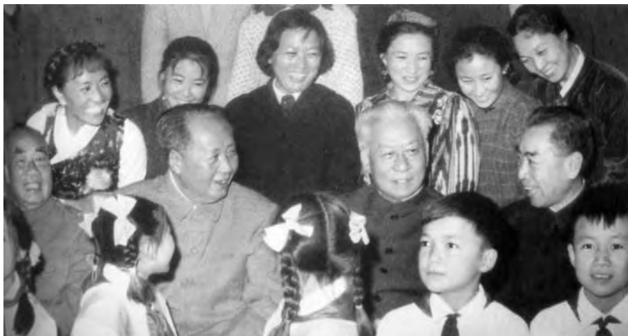
Слева направо: Чжу Дэ, Мао Цзэдун, Лю Шаоци, Чжоу Эньлай на встрече с артистами. 1964 г.

в кампанию политической критики. С лета 1964 г. она распространилась на сферу гуманитарных и общественных наук, затронув философию, экономику и историю. В каждой из областей культуры и науки были найдены персональные объекты особенно острых критических нападок.