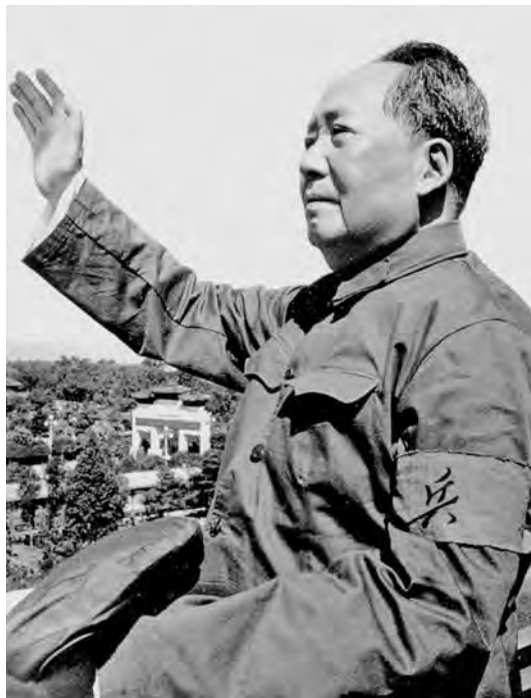
Мао Цзэдун принимает парад хунвэйбинов. 18 августа 1966 г.

Планируя активнее использовать «красных охранников» для массовых расправ над инакомыслящими, Мао Цзэдун и руководители ГКР предприняли ряд мер, развязывавших руки «бунтарям». Они в первую очередь позаботились об уничтожении собранных парткомами и рабочими группами материалов о преступлениях