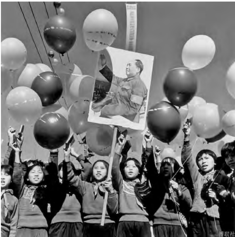
Демонстрация школьников под лозунгами верности Председателю Мао Цзэдуну

В 1966 г. с началом культурной революции вузы и школы прекратили набор учащихся. Такое «прекращение занятий во имя революции» растянулось на четыре года. Образованность стала восприниматься как символ политической неблагонадежности («чем больше знаний, тем больше реакционности»). «Читая много книг, – поучал “бунтарей” Мао Цзэдун, – императором не станешь». В результате такой политики около 100 млн учеников начальных школ, 14 млн учащихся средних учебных заведений и около 800 тыс. студентов на несколько лет были оторваны от учебы. За это время страна, остро нуждавшаяся в квалифицированных кадрах, где неграмотные составляли 40% населения, недополучила почти 5 млн специалистов высшей и средней квалификации.