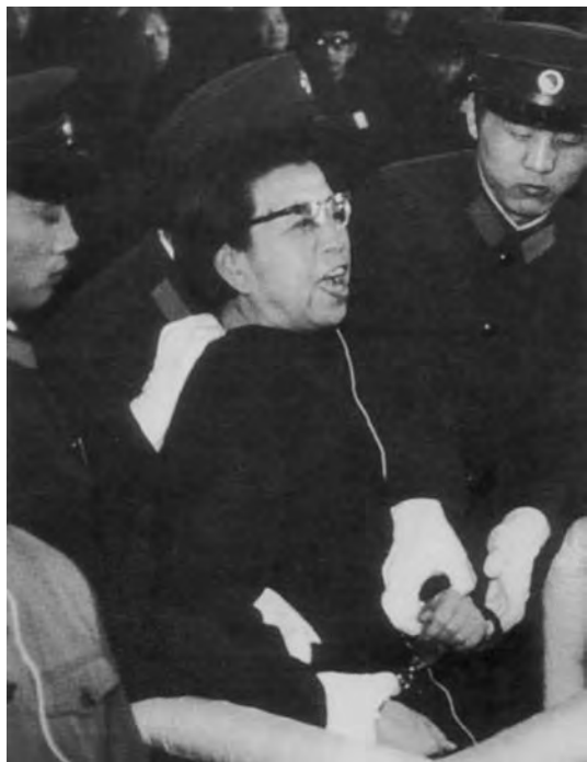
Цзян Цин во время суда над ней

1965 г. в шанхайской газете «Вэньхой бао» и стала сигналом к новому массовому движению, получившему вскоре название «великая пролетарская культурная революция».