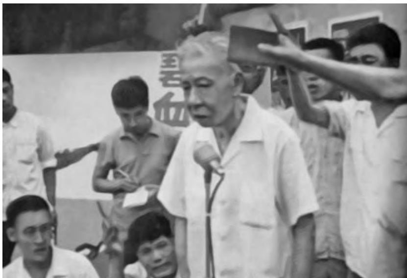
Публичные издевательства над Председателем КНР Лю Шаоци в 1967 г.

18 июля на квартире Лю Шаоци были произведены обыск и конфискация имущества. С этого времени он лишился личной свободы. 19 июля обыск произвели и на квартире Дэн Сяопина. 5 августа 1967 г., в годовщину написания Мао Цзэдуном своей дацзыбао, было устроено судилище над Лю Шаоци и Тао Чжу, которых выволокли вместе с женами на улицу и подвергли физическому насилию. Этим мероприятием руководила жена Кан Шэна Цао Йоу. Лю Шаоци был в нижнем белье, его периодически избивали на глазах у жены и четырех детей. Аналогичное судилище в здании МИДа устроили над министром иностранных дел Чэнь И.