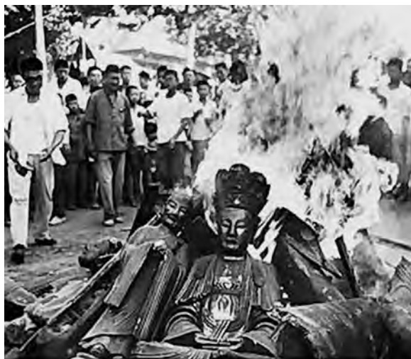
Сожжение статуй Будды в период «культурной революции»

В Тяньцзине, по сообщениям печати, почти все 40 тыс. универмагов, продовольственных магазинов и лавок, существовавших еще до 1949 г., были переименованы. Центральный пассаж в этом городе был переименован в «Народный пассаж», а аналогичный торговый центр в Пекине «Дунъянь шичан» («Восточное спокойствие») – в «Дунфэн шичан» («Ветер с Востока»). В летней резиденции императоров Ихэюань (Парк процветания и гармонии), в знаменитой пагоде Фосянгэ («Терем возжигания благовоний в честь Будды») – деревянном трехъярусном сооружении, хунвэйбины отряда «18 августа» Пекинского института физкультуры разбили несколько статуй, а две небольшие фигуры будд были ими украдены. В том же парке есть единственная в своем роде Длинная галерея (Чанлан) протяженностью в 728 м, отстроенная после пожара в конце XIX в. Ее поперечные балки сплошь покрыты цветной росписью в стиле традиционной китайской живописи, в том числе иллюстрациями к известным классическим романам и историческим сюжетам. Эти уникальные картины в ходе борьбы с «четырьмя старыми» хунвэйбины