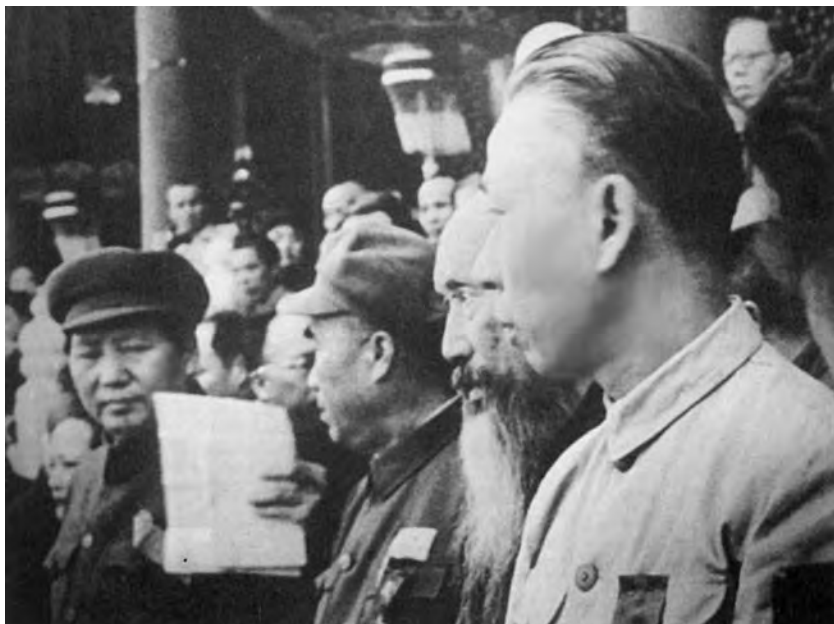
На трибуне Тяньаньмэнь в Пекине 1 октября 1949 г. Мао Цзэдун, Чжу Дэ, Чжан Лань, Лю Шаоци

за независимость, демократию, мир, единство и создание процветающего и сильного Китая». Рядом с Мао Цзэдуном стояли Чжу Дэ, Лю Шаоци, Чжоу Эньлай и другие руководители партии и нового государства, а также лидеры демократических партий, входивших в состав нового правительства Китая.