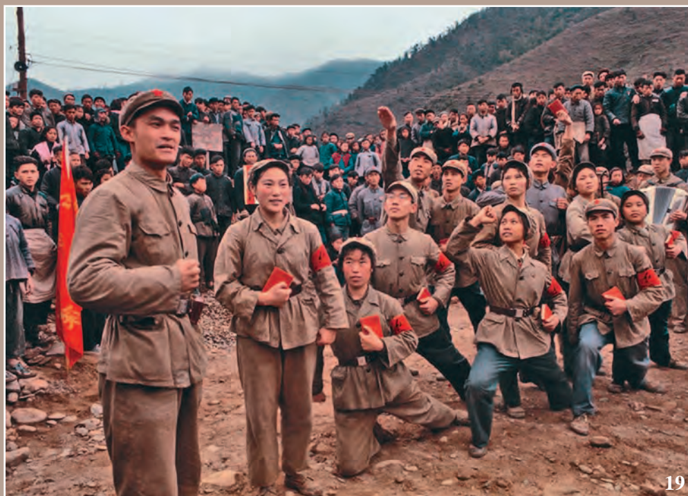
18. Городскую молодежь направляют в деревню 19. Клятва на верность. Культбригада НОАК