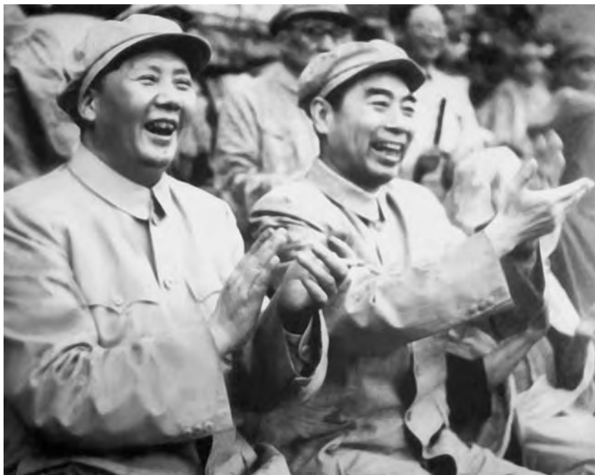
Мао Цзэдун и Чжоу Энълай. Август 1952 г.

Ответственными за развертывание движения были назначены секретарь Пекинского горкома КПК, член Центрального народного правительственного совета Пэн Чжэнь и личный политический секретарь Мао Цзэдуна Ху Цяому. Для руководства осуществлением кампании была создана группа из пяти человек. В качестве материалов для изучения были определены работы классиков марксизма-ленинизма и Мао Цзэдуна. Целью создания руководящей группы была объявлена отработка образца проведения такого рода кампаний. Рекомендовались такие методы учебы, как заслушивание докладов, чтение руководящих документов, оценка соответствия личных взглядов и обстановки в учебном заведении этим документам, развертывание широкой критики и самокритики.