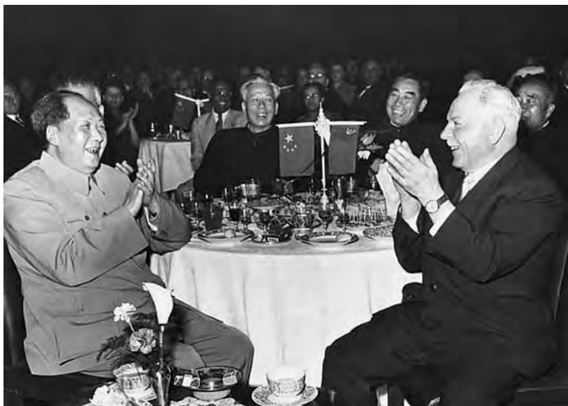
Прием в Пекине председателя Президиума Верховного Совета СССР К.Е. Ворошилова. 15 апреля 1957 г. Справа налево: К.Е. Ворошилов, Чжу Дэ, Чжоу Эньлай, Лю Шаоци, Мао Цзэдун