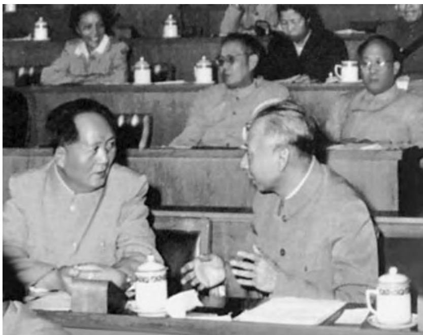
Мао Цзэдун и Лю Шаоци на VIII съезде КПК. 1956 г.