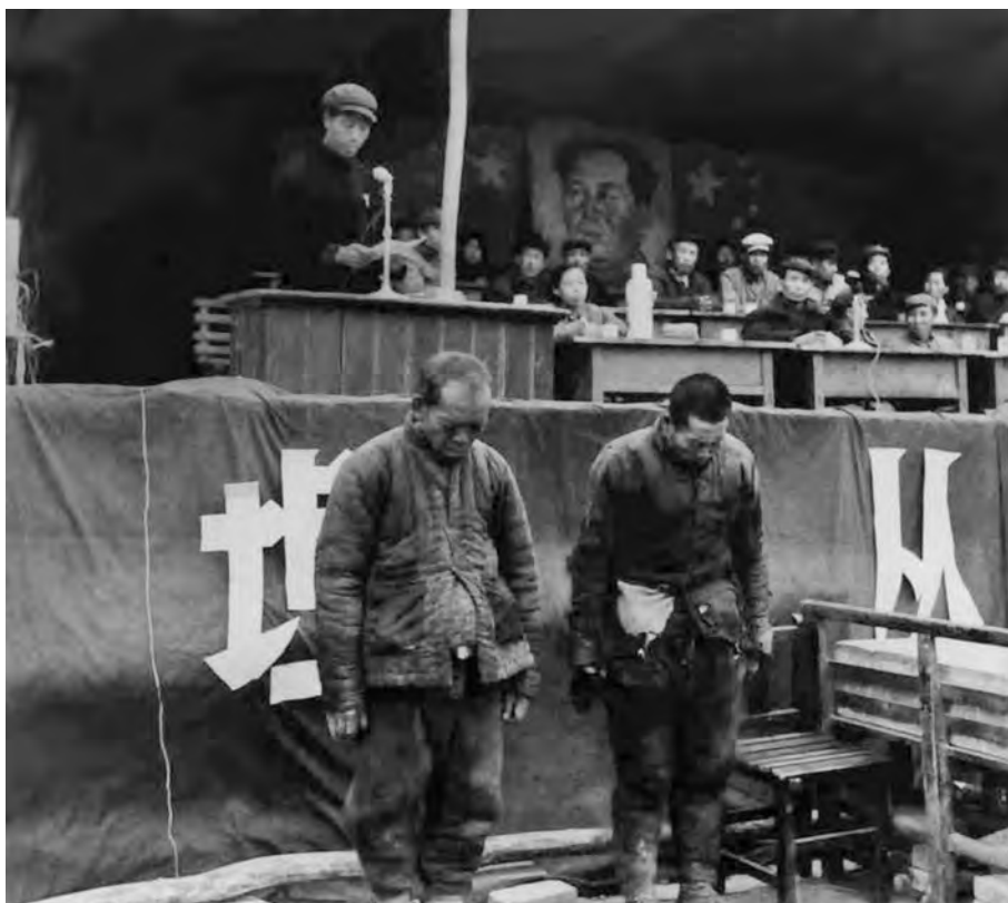
«Враги» культурной революции

Вскоре с делом Лю Шаоци связали дела «предательских группировок» Синьцзяна (против членов КПК, арестованных в сентябре 1942 г. милитаристом Шэн Шицаем и освобожденных только в 1946 г.), Северо-Восточного Китая (против бывших руководителей Бюро ЦК КПК по Северо-Восточному Китаю) и др. Одновременно были сфабрикованы дела членов КПК, работавших в подполье в период антияпонской и освободительной войны в Пекине, Тяньцзине, Шанхае, провинциях Гуандун, Сычуань, Юньнань и других