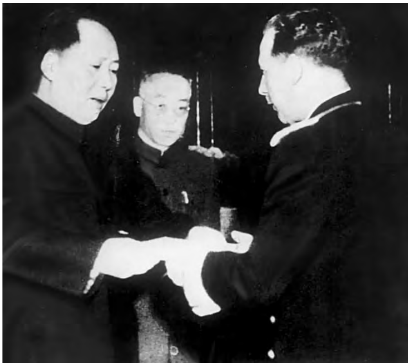
Первый посол СССР в КНР Н.В. Рошин вручает верительные грамоты Мао Цзэдуну. 16 октября 1949 г.

между двумя странами, – испытывают безграничную радость по поводу того, что сегодня Советский Союз стал первой дружественной державой, признавшей Китайскую Народную Республику».