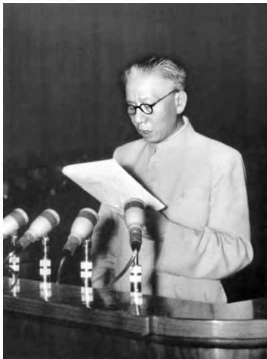
Лю Шаоци выступает с докладом на VIII съезде КПК. 15 сентября 1956 г.

«Вопрос о борьбе против культа личности занимал важное место в работе XX съезда КПСС, – говорилось в ней. – Съезд со всей остротой вскрыл