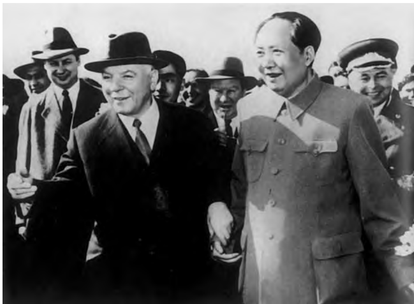
Визит председателя Президиума Верховного Совета СССР К.Е. Ворошилова в КНР. Апрель 1957 г.