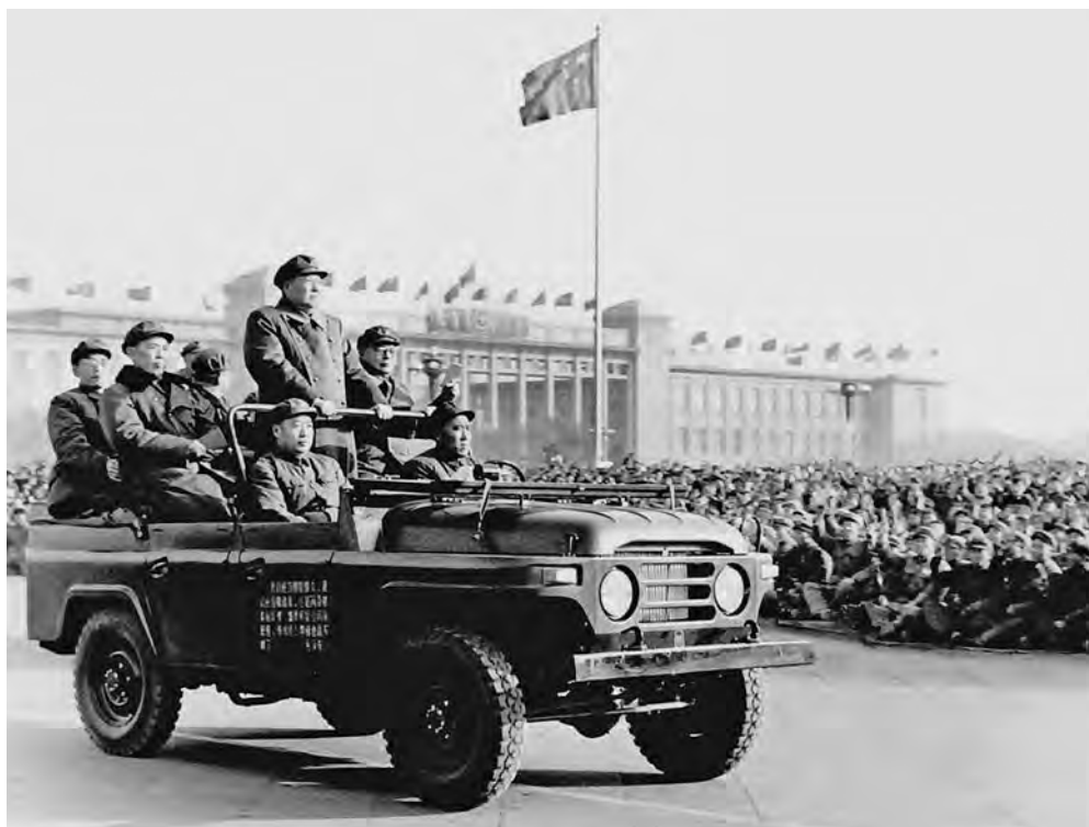
Мао Цзэдун объезжает колонны хунвэйбинов в Пекине в 1966 г.

и выставили на всеобщее обозрение, а их «копии» распределили между городскими организациями.