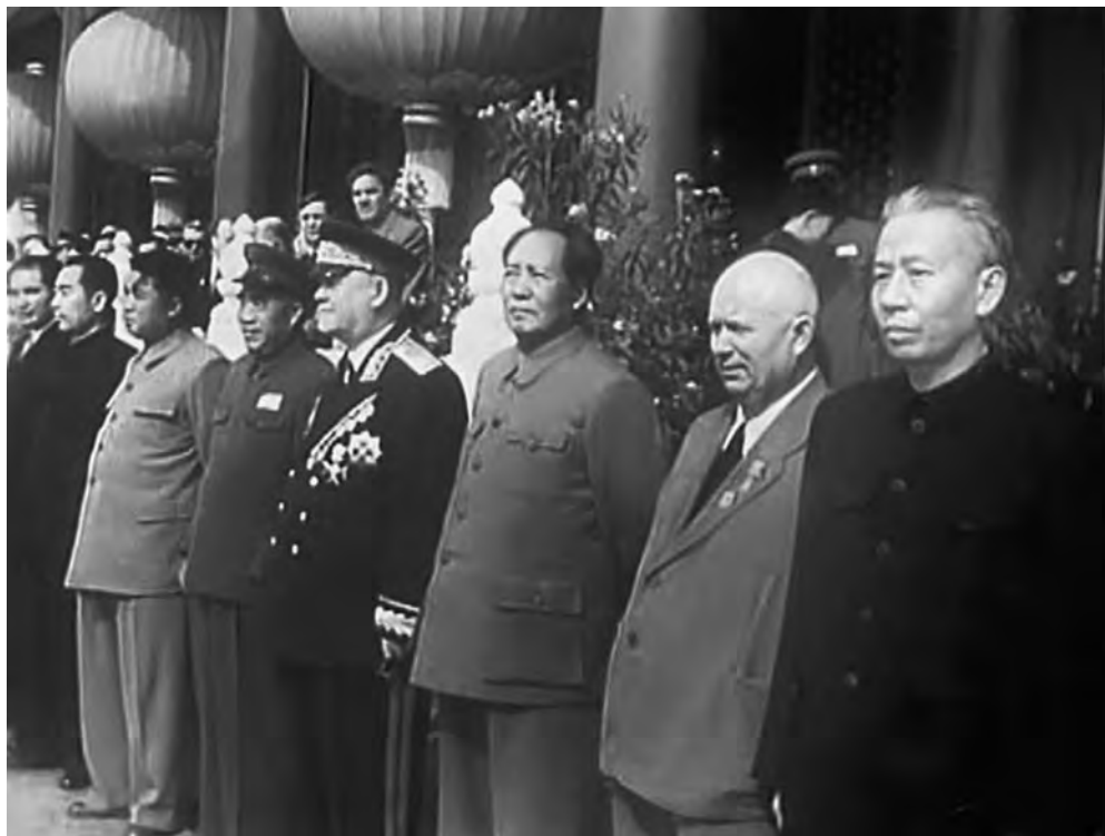
На праздновании пятой годовщины КНР. 1 октября 1954 г. Справа налево: Лю Шаоци, Н.С. Хрущев, Мао Цзэдун, Н.А. Булганин, Чжу Дэ, Ким Ир Сен, Чжоу Эньлай

с единым социалистическим экономическим укладом, т.е. от новодемократического общества к социалистическому обществу».