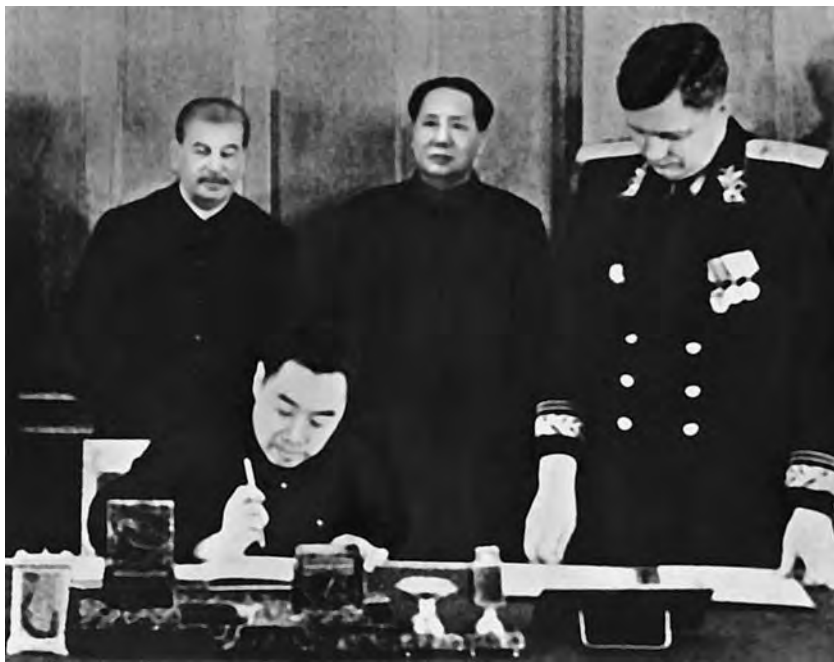
Чжоу Эньлай в присутствии И.В. Сталина и Мао Цзэдуна подписывает Договор между СССР и КНР о дружбе, союзе и взаимной помощи. 14 февраля 1950 г.

Договор имел историческое значение и для укрепления суверенитета Монгольской Народной Республики. Правительства СССР и КНР в совместном коммюнике констатировали полную гарантию независимости МНР, полученной в результате референдума 1945 г., и установления КНР дипломатических отношений с монгольским государством.