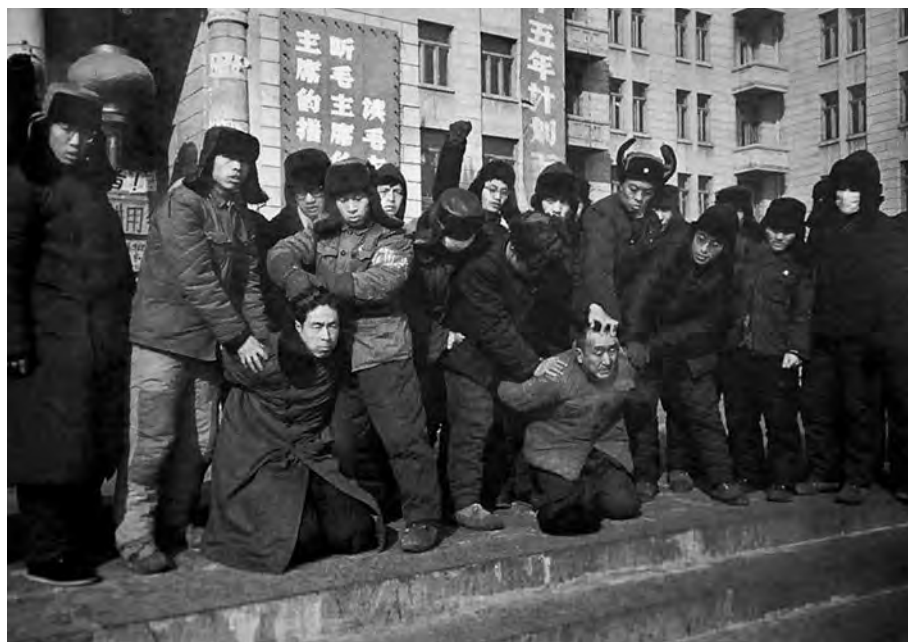
Митинг на фоне призывов «Читать книги Председателя Мао!», «Слушать слово Председателя Мао Цзэдуна!», «Выполнять указания Председателя Мао Цзэдуна!»