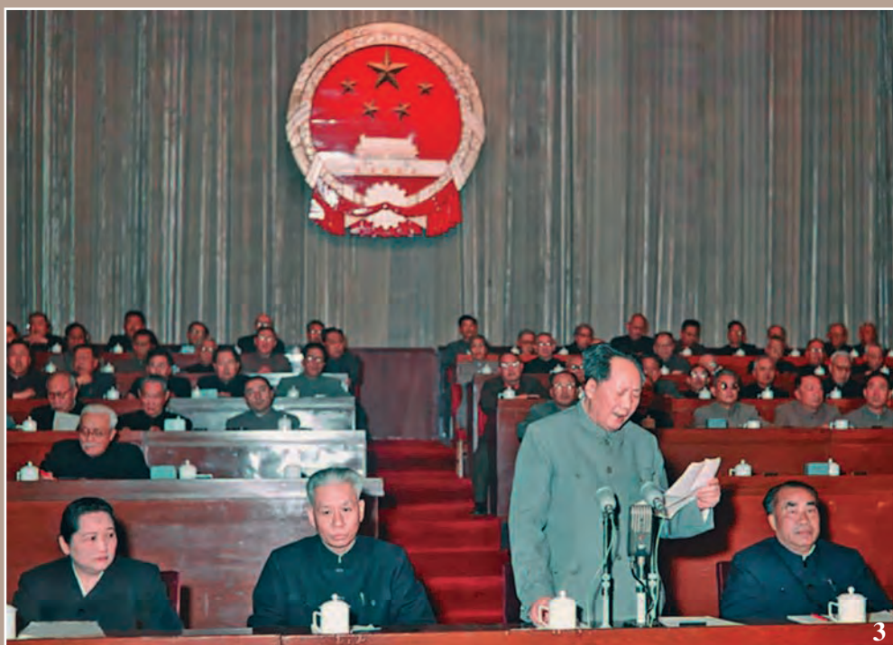
2. Мао Цзэдун и Чжоу Эньлай. Пекин, 1952 г. 3. Справа налево: Чжу Дэ, Мао Цзэдун, Лю Шаоци, Сун Цинлин на открытии первой сессии ВСНП 2-го созыва в Пекине 18 апреля 1959 г.