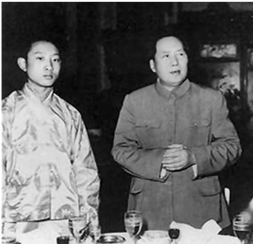
Мао Цзэдун с панчэн-ламой. 1951 г.

Основные усилия руководства КНР были направлены на организацию регистрации религиозных групп и объединений и контроль над их деятельностью. Она оценивалась, прежде всего, с точки зрения их отношения