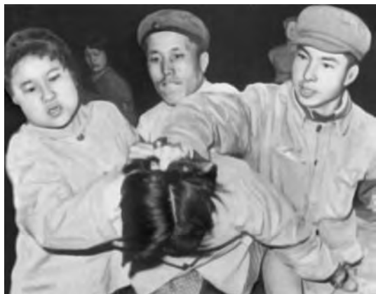
Глумление над «врагами народа»

Довольно! В наших сердцах клокочет вся старая и новая ненависть! Мы не забудем о ней ни через сто, ни через тысячу, ни через десять тысяч лет. Мы обязательно отомстим. Сейчас мы не мстим только потому, что еще не пришло время мщения. Когда же настанет это время, мы сдерем с вас шкуру, вытянем из вас жилы, сожжем ваши трупы и прах развеем по ветру!».