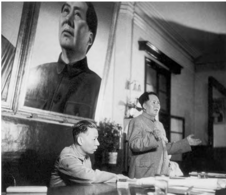
Мао Цзэдун и Лю Шаоци на пленуме ЦК КПК. Июнь 1950 г.

экономического характера. Так, правительство приняло решение об обеспечении полного денежного содержания всех без исключения военных чиновников и гражданских служащих государственного аппарата прежнего режима, насчитывавших несколько миллионов человек. В результате государству пришлось, взяв на себя тяжелое бремя, выплатить пособия более чем 9 млн человек. Значительные усилия власти прилагали также для стабилизации цен на товары повседневного спроса, рост которых в результате спекуляции был чреват взрывом общественного недовольства. Государственные органы организовали массовые перевозки и накопление запасов продовольствия, хлопка, тканей и угля в масштабах страны. В соответствии с единым планом центральных властей, в момент наиболее стремительного взлета цен в ноябре 1949 г. во всех крупных городах одновременно началась широкая распродажа запасов накопленных товаров, что привело к резкому снижению цен на них. В результате применения силовых и экономических форм борьбы со спекуляцией и централизации финансовой системы в начале 1950 г. цены были в основном стабилизированы, сложились благоприятные условия для нормализации жизни людей, восстановления и развития промышленного и сельско-