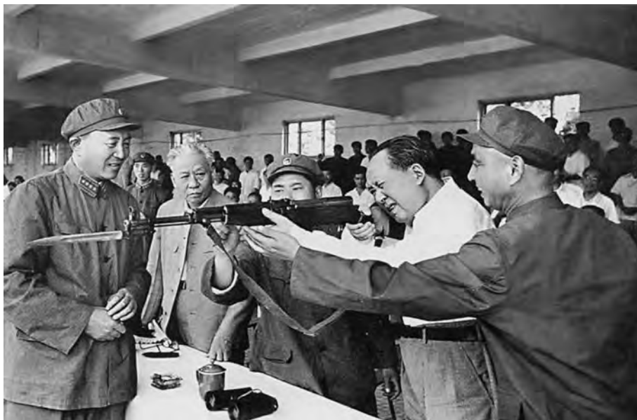
Мао Цзэдун инспектирует НОАК. 1964 г.

В январе 1964 г. было созвано всеармейское совещание по вопросам политической работы, призвавшее «еще выше поднять красное знамя Мао Цзэдуна», достичь новых высот в деле строительства рот «четырёх хорошо». По окончании совещания, засвидетельствовавшего успешное проведение «чисток» в вооруженных силах, партийное руководство приняло решение рекомендовать армию в качестве образца для всей страны. Кампания «учебы у армии», а затем создание политорганов по армейскому образцу в гражданских учреждениях должны были способствовать предотвращению «мирного перерождения» Китая и наступления «ревизионизма».