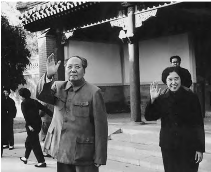
Мао Цзэдун и супруга председателя КНР Лю Шаоци Ван Гуанмэй приветствуют в Пекине иностранных гостей. 1965 г.

сравнительно всестороннего и детального проведения кампании» на селе. В резолюции ЦК КПК от 1 сентября 1964 г. на этот документ говорилось, что представленный в нем опыт одной производственной бригады «по многим вопросам имеет всеобщий характер».