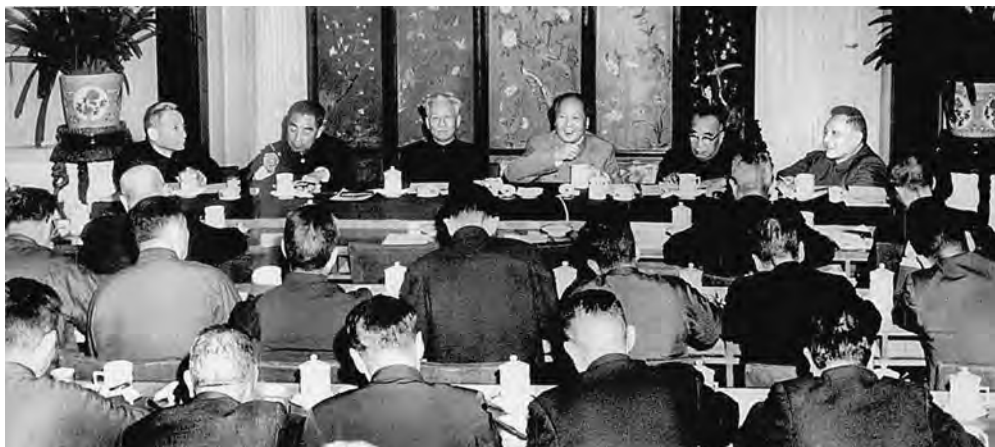
Девятый пленум ЦК КПК 8-го созыва. Январь 1961 г. Справа налево : Дэн Сяопин, Чжу Дэ, Мао Цзэдун, Лю Шаоци, Чжоу Эньлай, Чэнь Юнь

решения Политбюро ЦК КПК о воссоздании шести региональных бюро ЦК КПК. 3. Заслушивание и обсуждение доклада Дэн Сяопина «О Совещании представителей коммунистических и рабочих партий в Москве в ноябре 1960 г.»