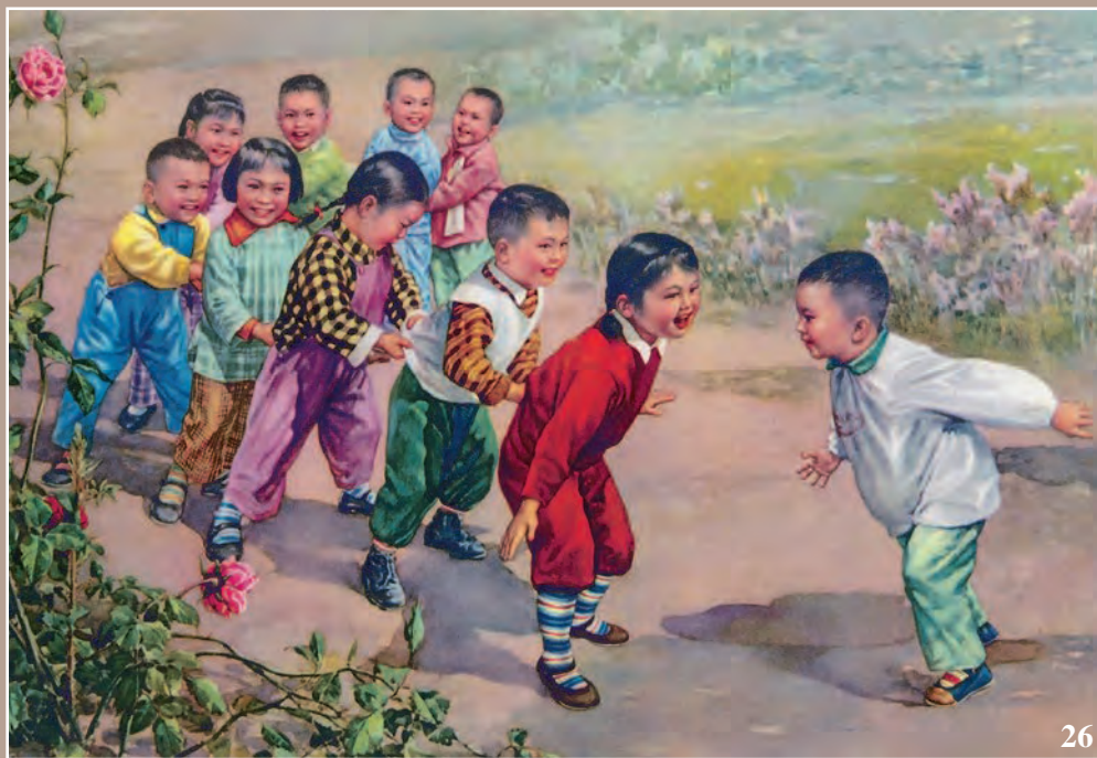
25. Дедушка (Дэн Сяопин) с внучкой 26. Маленькие граждане социалистической КНР