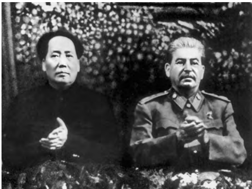
И.В. Сталин и Мао Цзэдун. Празднование 70-летия И.В. Сталина 21 декабря 1949 г. в Москве