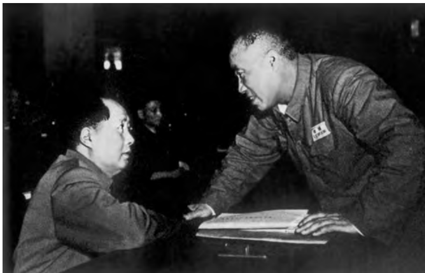
Мао Цзэдун и Чжу Дэ. 1950 г.

Затем были уничтожены войска Ху Цзуннаня и Сун Силян на Юго-Западе, были взяты под контроль города Чунцин и Чэнду в провинции Сычуань, и, с помощью транспортной авиации СССР, Синьцзян на Северо-Западе страны. В апреле 1950 г. была успешно осуществлена операция по десантированию на одном из самых крупных китайских островов – Хайнань – и архипелаге Чжоушань. К лету 1950 г. войска НОАК без боев заняли обширные районы провинций Юньнань, Сычуань и Сикан, регулярные военные действия практически были завершены. За восемь месяцев боев в общей сложности было уничтожено 1,3 млн гоминьдановских солдат и офицеров, а потери войск противника за весь период этой войны достигли 8 млн 70 тыс. человек. За исключением Тибета, Тайваня и небольшого числа островов на Юге было завершено взятие под контроль всей территории Китая.