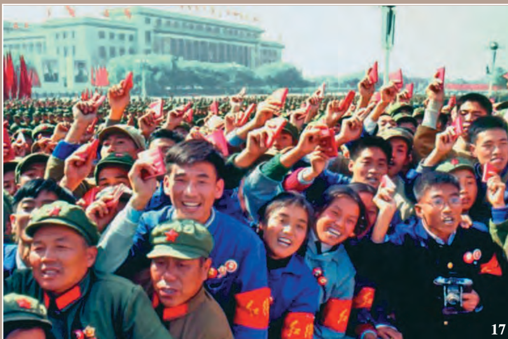
16. По пути на площадь Тяньаньмэнь. 1 октября 1966 г. 17. Хунвейбины на площади Тяньаньмэнь в 1966 г.