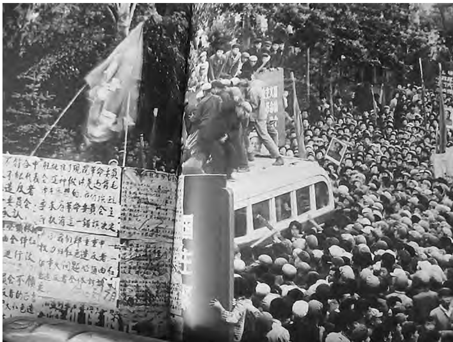
Борьба за автобус с громкоговорителем

на митинге. — Сегодня я видел нашего самого-самого-самого-самого дорогого и любимого вождя — Председателя Мао! Товарищи, честное слово, я видел Председателя Мао! Я так счастлив, что сердце мое готово выпрыгнуть из груди... Мы все прыгаем от радости! Мы поем песни! Посмотрев на наше Красное Солнышко, я как сумасшедший носился по улицам Пекина... Я видел его так ясно, так четко, и он выглядел таким могущественным... Товарищи, как мне описать, что я испытал в тот момент? Я не смогу сегодня заснуть! Пусть сегодняшний день будет днем моего рождения! Я начал новую жизнь!».