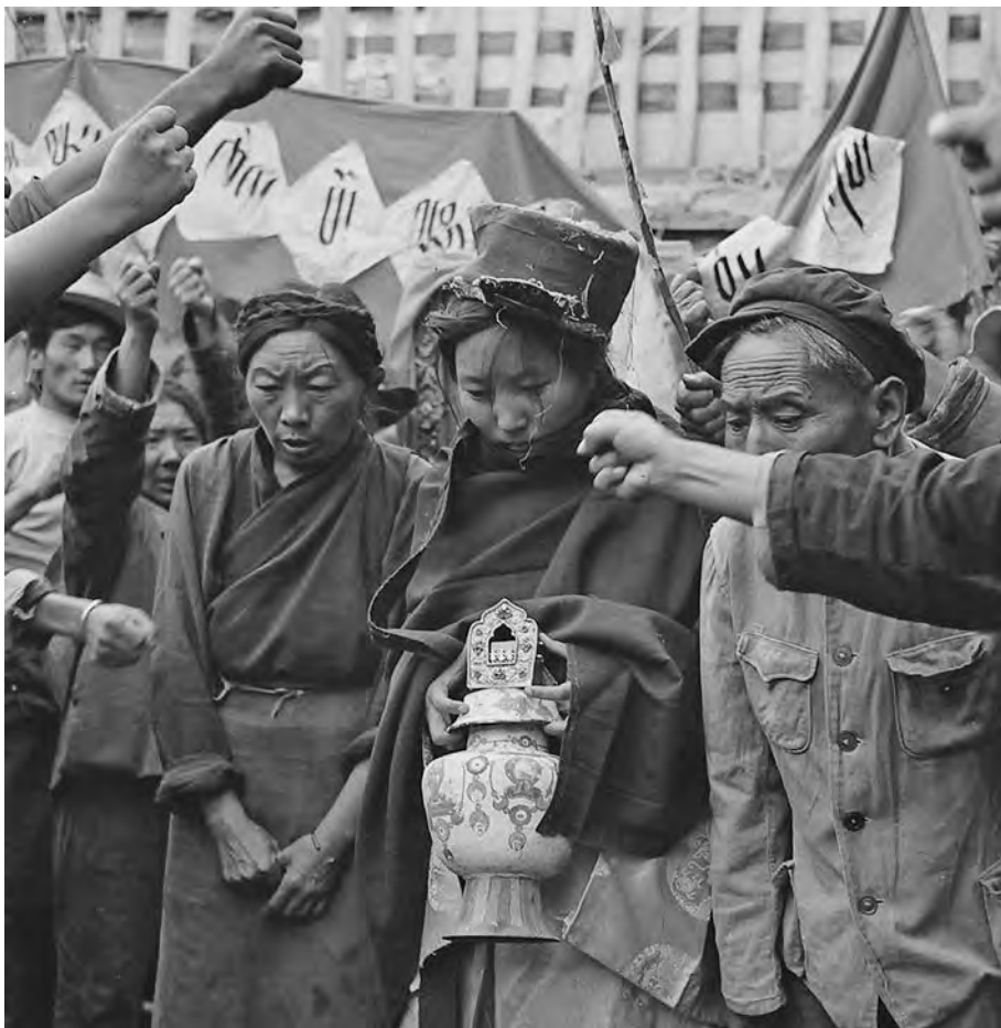
Осуждение «старой культуры» и «старых обычаев» во время «культурной революции»

После 20 августа по всей стране начались широкомасштабные беспорядки: переименовывались площади и улицы, совершались акты вандализма в отношении памятников истории, архитектуры и культуры, погромы в домах граждан, библиотеках и музеях, культовых сооружениях, на старых кладбищах, избивание простых граждан, нападки на патриотически настроенных деятелей демократической ориентации. В глазах хунвэйбинов всё это выглядело как борьба с «четырьмя старыми».