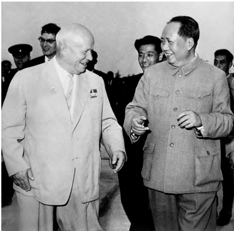
Встреча Н.С. Хрущева и Мао Цзэдуна в Пекине в сентябре 1958 г.

также ростки коммунизма. В учебных заведениях, на заводах, в городских кварталах – везде можно создавать народные коммуны. Не пройдет и несколько лет, как все объединится в одну большую коммуну».