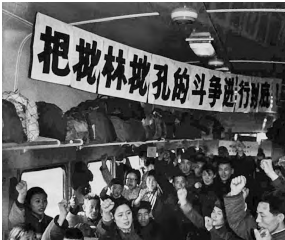
«Доведем до конца кампанию критики Линь Бяо и Конфуция»

31 января 1974 г. Чжоу Эньлай, председательствуя на заседании Политбюро, при поддержке Е Цзяньина, Дэн Сяопина и других своих сторонников потребовал не втягивать структуры вооруженных сил в кампанию «четырех больших свобод», запретить написание и расклеивание дацзыбао, проведение «широких дискуссий, широкой критики», превращавшихся в самосуд и персональные нападки. Соответствующие требования были изложены в специальном документе из восьми пунктов, регламентировавшем проведение кампании, который от имени ЦК был направлен на места.