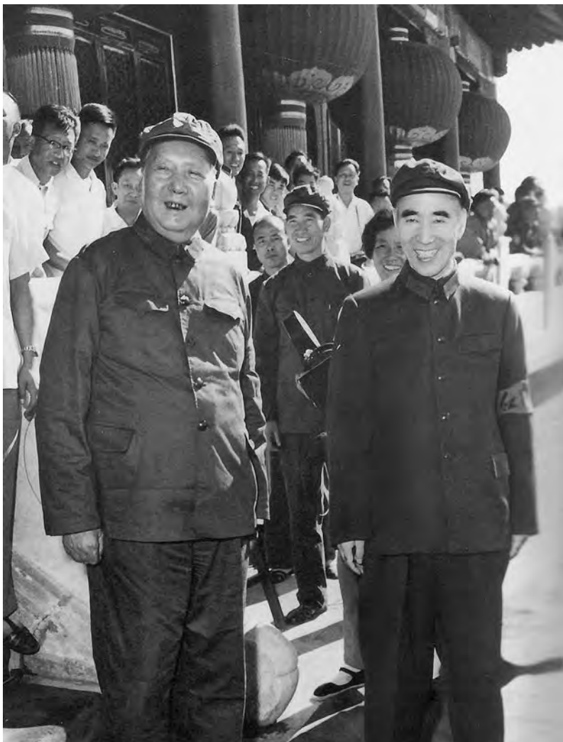
Мао Цзэдун и Линь Бяо. Осень 1966 г.

1. Напоминание о политических переворотах, которые имели место как в Китае, так и за рубежом. Линь Бяо подчеркнул, что Мао Цзэдун придает большое значение этой угрозе и «много раз собирал ответственных товарищей для обсуждения вопроса о предотвращении контрреволюционного переворота», который готовят «представители буржуазии», проникшие в ряды партии, такие как Ло Жуйцин, Пэн Чжэнь, Лу Диньи и его жена, Ян Шанкунь, — они захватили государственный аппарат, политическую власть и «штаб идеологического фронта», «учиняют смуту и беспорядки... помышляют об убийствах людей».