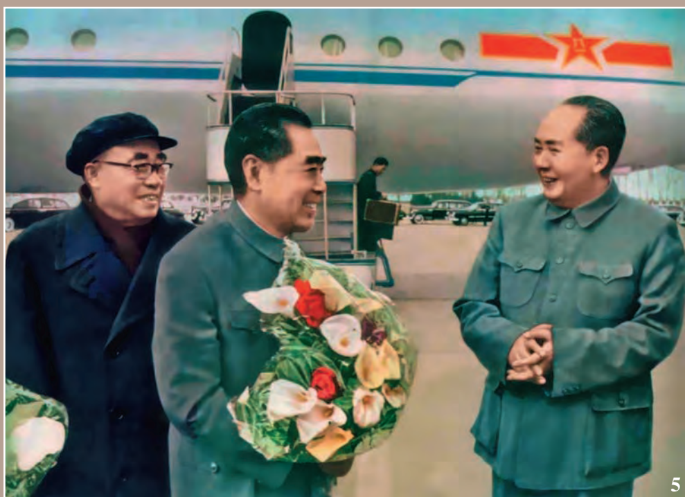
4. Н.С. Хрущев, Мао Цзэдун, Хо Ши Мин на праздновании 10-й годовщины КНР. Пекин, 1 октября 1959 г.