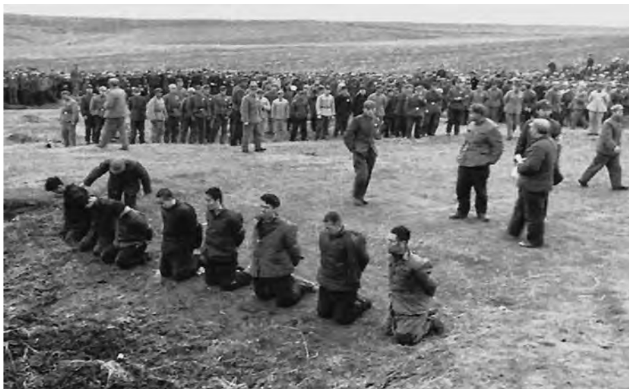
Расстрел «контрреволюционеров». Апрель 1968 г.

оттуда в города молодежь, наказать виновных в беспорядках. Вся полнота власти была отдана «группе по созданию ревкома в Гуанси», а ответственность за нормализацию положения возлагалась на части НОАК. Однако, несмотря на грозные распоряжения Пекина, столкновения на местах продолжались. В частности, события, аналогичные гуансийским, имели место в пров. Цзянси. 24 июля появился новый утвержденный Мао Цзэдуном документ ЦК КПК, Госсовета, Военного совета ЦК и ГКР, требовавший в соответствии с директивой от 3 июля немедленно прекратить вооруженную борьбу, а виновников беспорядков карать по закону.