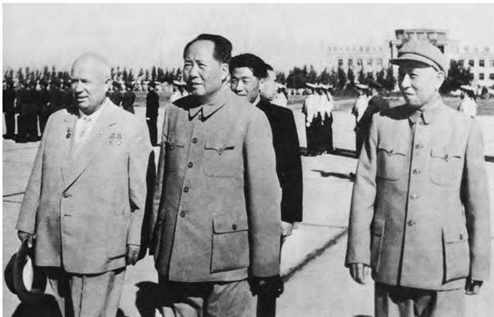
Мао Цзэдун и Лю Шаоци встречают Н.С. Хрущева

С конца апреля по июль 1954 г. представитель КНР – министр иностранных дел Чжоу Эньлай – участвовал наряду с министрами иностранных дел СССР, США, Великобритании и Франции в работе Женевской конференции, обсуждавшей положение в Корее и в Индокитае. В конференции с начала мая также принимали участие представители Северного Вьетнама – Демократической Республики Вьетнам под руководством Хо Ши Мина, пользовавшегося поддержкой со стороны Китая и СССР, представители Южного Вьетнама – профранцузского правительства бывшего императора Бао Дая, а также представители Лаоса и Камбоджи.