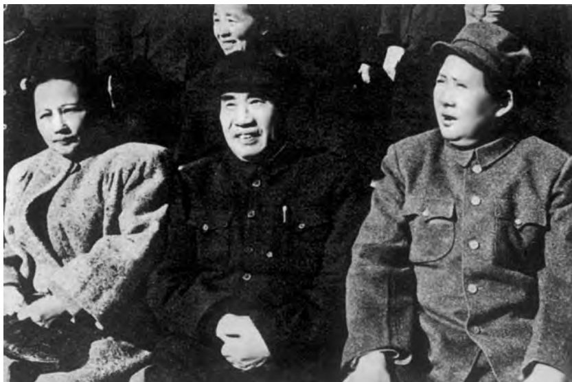
Справа налево: Мао Цзэдун, Чжу Дэ и Сун Цинлин. 1950 г.

феодализма и проведению социальных преобразований в стране. Так, началась борьба с преступностью, азартными играми, употреблением наркотиков и проституцией.