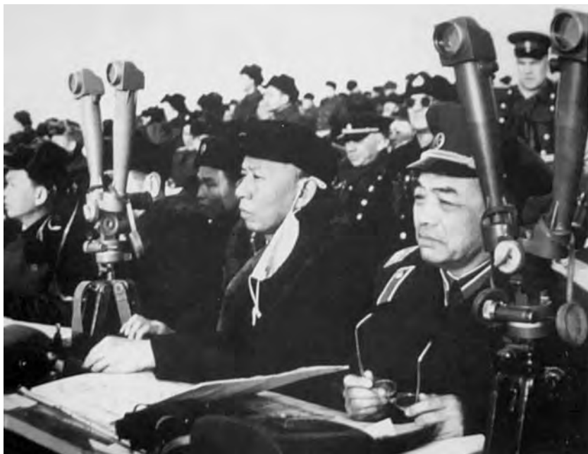
Лю Шаоци и Пэн Дэхуай на военных учениях в Даляне. 1955 г.

Сяочжоу, были и общественные столовые. Пэн Дэхуай просил его найти возможность сообщить об этом Председателю.