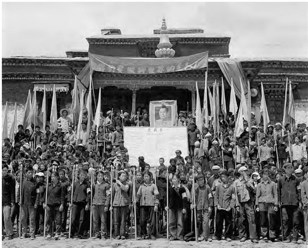
«Мы должны стать хозяевами нового мира!»

отдадим последнюю каплю крови, решительно доведем до конца культурную революцию». Первые организации хунвэйбинов сначала появились в средних школах столицы, в вузах — несколько позже.