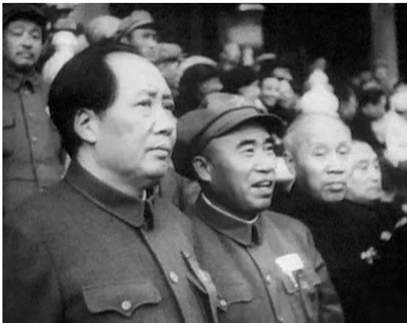
Мао Цзэдун и Чжу Дэ. 1 октября 1949 г.

народной революции (революции народа), мы провозглашаем образование Китайской Народной Республики. Наша нация отныне вступает в великую семью миролюбивых и свободолюбивых народов мира. Она будет самоотверженно и усердно трудиться, чтобы создать свою собственную цивилизацию и счастье и одновременно с этим продвигать вперед дело мира и свободы во всем мире. Наша нация никогда больше не будет униженной».