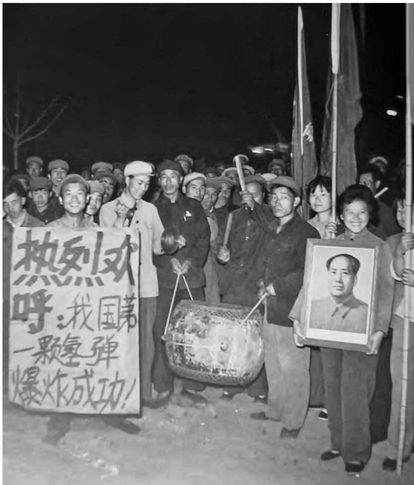
Демонстрация по случаю первого успешного испытания водородной бомбы

борьбы против ревизионизма». Повсюду виднелись плакаты и транспаранты с угрозами, с призывами «разгромить советских ревизионистов». Вокруг посольства бушевали организованные по воле Мао Цзедуна митинги, в которых принимали участие сотни тысяч людей. Было объявлено о провозглашении 29 августа праздником – «Днем борьбы против советского ревизионизма». Одновременно устраивались многочисленные и разнообразные провокации в отношении советских дипломатических и технических сотрудников и граждан на улицах столицы, на железнодорожном транспорте, против советских судов в портах КНР.