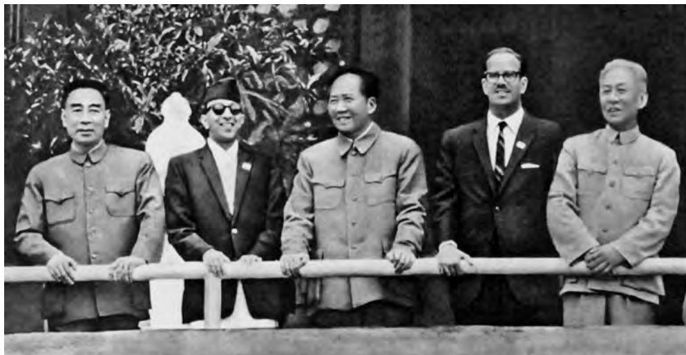
Празднование годовщины КНР в Пекине 1 октября 1961 г. Справа налево: Лю Шаоци, президент Кубы Освальдо Дортикос, Мао Цзэдун, король Непала Махендра, Чжоу Эньлай

Определенного прорыва китайской дипломатии удалось добиться после достижения с Индией в апреле 1954 г. «Соглашения о торговле и связях Тибетского района Китая с Индией», позволившего смягчить ситуацию в китайско-индийских отношениях. Несмотря на то что пограничные споры были, по сути, отложены на будущее (в 1962 г. они привели к военному столкновению), индийское руководство окончательно признало Тибет территорией Китая. А пять принципов мирного сосуществования (так называемые «панча шила»), записанные в преамбуле данного соглашения, подписанного премьер-министром Индии Джавахарлалом Неру и премьером ГАС Китая Чжоу Эньлаем, в дальнейшем стали одной из основ международной политики. Эти принципы включают в себя положения о взаимном уважении территориальной целостности и суверенитета друг друга, ненападении, невмешательстве во внутренние дела, равенстве и взаимной выгоде, а также о мирном сосуществовании.