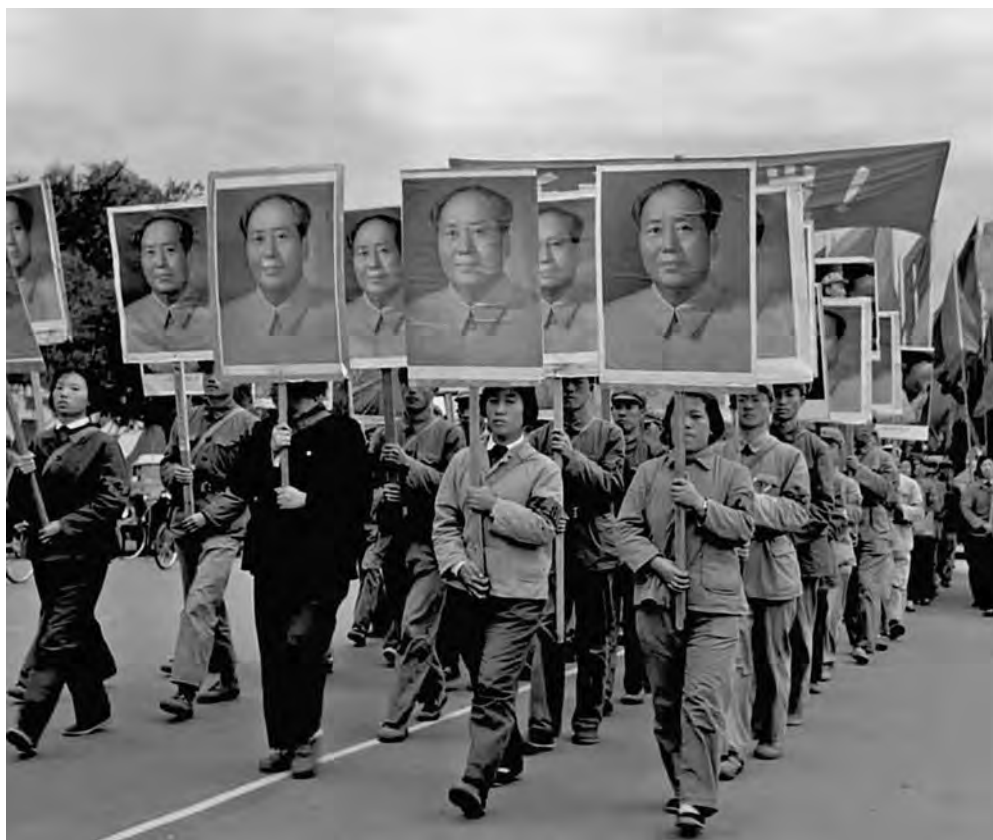
Демонстрация под лозунгом «10 000 лет Председателю Мао»

не употреблялся). Для активизации действий будущих «красных охранников» им авансом отпускаясь все прошлые и будущие грехи.