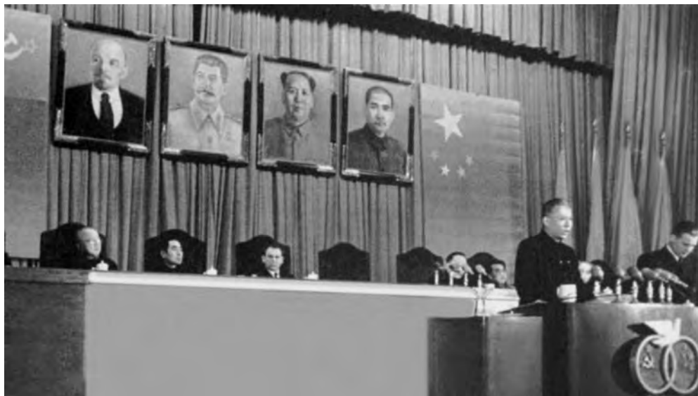
Лю Шаоци выступает с речью по случаю третьей годовщины подписания Договора между СССР и КНР о дружбе, союзе и взаимной помощи. 13 февраля 1953 г.

сделанное в сентябре 1952 г. о том, что «следует построить социализм в течение 10–15 лет, а не начинать переход к нему, спустя 10 лет», как думают некоторые. На ряде последующих экономических и политических совещаний высшего партийного руководства Мао Цзэдун подверг критике Лю Шаоци, Чэнь Юня, Бо Ибо, Дэн Цзыхоя и других, которые якобы «топчутся на одном месте» и препятствуют «скачку» к социализму. Разногласия в руководстве партии отразились на выработке в 1953–1954 гг. новой «генеральной линии» и разработке пятилетнего плана. В разработке и осуществлении этого плана содействие Китаю оказал Советский Союз. Успехи КНР были связаны с политической, экономической и научно-технической помощью, которую СССР предоставлял Новому Китаю.