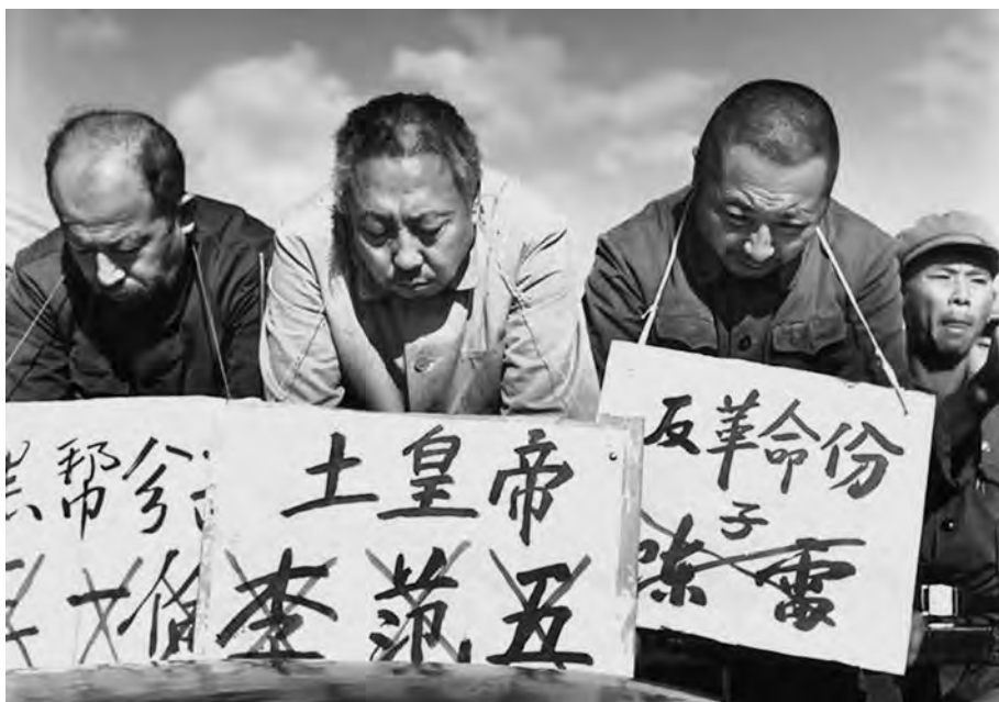
Публичное издевательство над партийными секретарями провинциального уровня

Кампания «чистки классовых рядов» принимала общенациональный характер. В качестве «образца» ее проведения был широко разрекламирован отчет члена ГКР Яо Вэньюаня от 13 мая 1968 г. «О работе военно-контрольного комитета в деле мобилизации масс на борьбу против врагов в Пекинской типографии Синьхуа», направленный Мао Цзэдуну. Последний назвал отчет