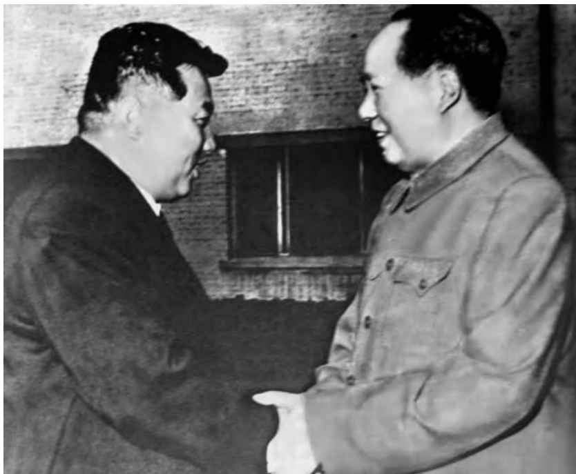
Мао Цзэдун и Ким Ир Сен. Июнь 1951 г.

в Корею», добившись включения его в повестку дня. 20 января 1951 г. делегация США внесла в Политический комитет Генеральной Ассамблеи свой проект резолюции по корейской проблеме, где КНР объявлялась «агрессором». 1 февраля 1951 г. Генеральная Ассамблея одобрила американскую резолюцию и поручила комитету по дополнительным мероприятиям, в составе представителей 14 стран во главе с представителем США, обсудить дальнейшие шаги, необходимые для противодействия «агрессии», и представить доклад Генеральной Ассамблее. СССР заседание Совета Безопасности бойкотировал, отозвав своего представителя в ООН Я.А. Малика.