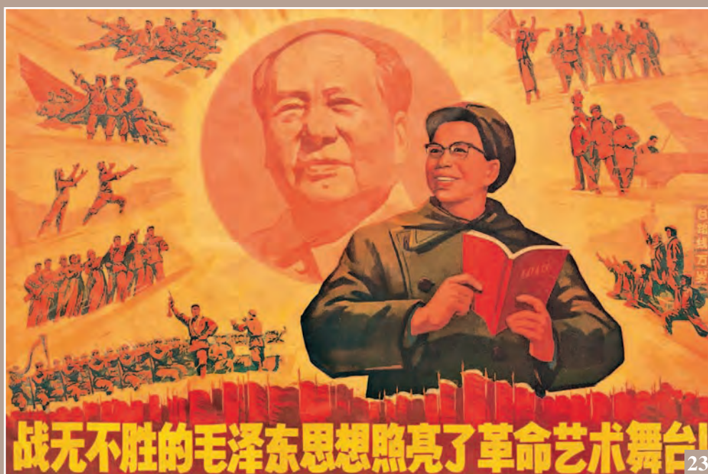
22. Плакат, прославляющий «великую пролетарскую культурную революцию» с изображением (слева направо) Кан Шэна, Чжоу Эньлая, Мао Цзэдуна, Линь Бяо, Чэнь Бода и Цзян Цин