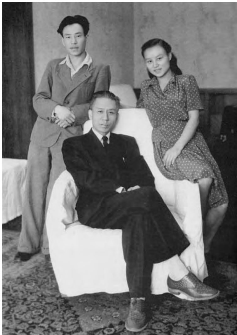
Лю Шаоци с дочерью и ее мужем

руководители, министры, некоторое число ученых и передовиков производства. Открывая вечер, Мао Цзэдун подверг критике «ошибочные» взгляды на «движение за социалистическое воспитание» — о «четырех чистых и нечистых», «переплетении противоречий в партии и вне нее», назвав их «антимарксистскими». Он осудил некоторые центральные учреждения как «независимые княжества» и вновь повторил, что в «партии возникла опасность ревизионизма». После совещания Лю Шаоци по совету Пэн Чжэня и первого секретаря бюро ЦК КПК по Центрально-Южному Китаю Тао Чжу выступил с самокритикой на заседании Политбюро. Он повинулся в том, что вел себя неуважительно, прерывая