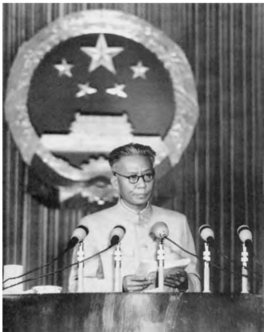
Лю Шаоци выступает с докладом о проекте Конституции КНР. 20 сентября 1954 г.

Цзэдуна Лю Шаоци написал Сталину письмо, в котором высказал соображения относительно созыва сессии ВСНП (т.е. о создании в КНР парламента и проведении выборов его депутатов) и выработки Конституции. Основываясь на мнении Сталина, Лю Шаоци получил возможность настаивать на начале выработки проекта Конституции КНР и проведении выборов в ВСНП. До того времени Мао Цзэдун планировал сделать все это несколько позднее, т.е. разработать Конституцию и созвать сессию ВСНП после того, как Китай в основном вступит в социализм.