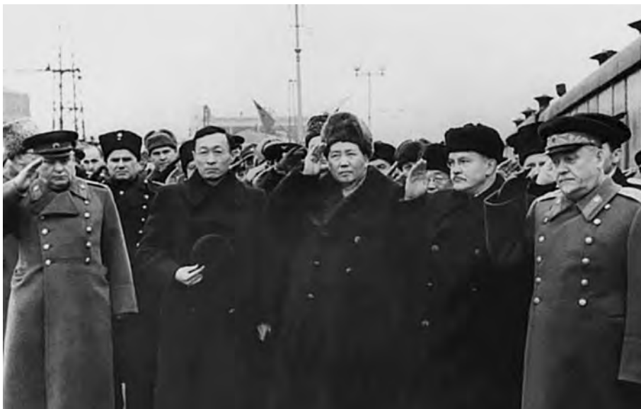
Прибытие Мао Цзэдуна в Москву на празднование 70-летия И.В. Сталина. 16 декабря 1949 г.