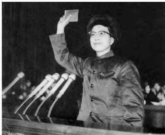
Цзян Цин во время «культурной революции». Февраль 1967 г.

Вскоре были сняты с постов четыре заместителя начальника Генштаба, арестованы 20 его высокопоставленных работников, отстранены от работы начальни-