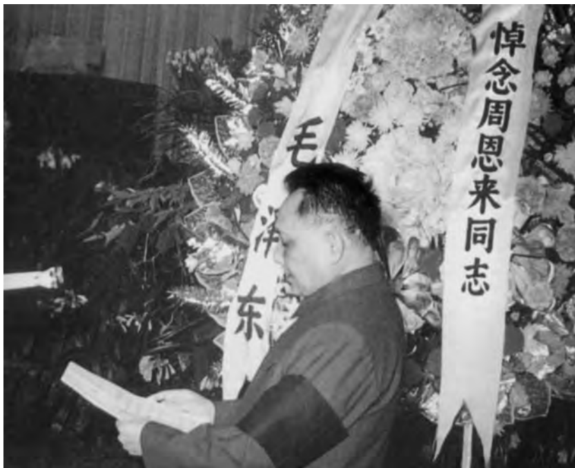
Дэн Сяопин произносит речь на похоронах Чжоу Эньлая

прошли в Шанхае, Тяньцзине, Гуанчжоу, Ухане, Сиане, Нанкине, Чунцине и других городах.