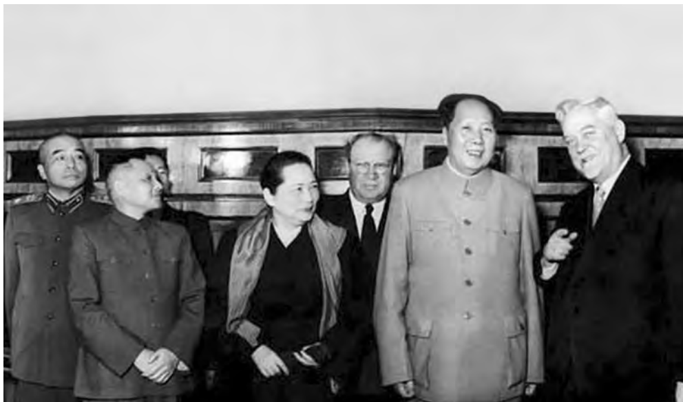
Поездка Мао Цзэдуна в Москву в ноябре 1957 г. Справа налево: Н.А. Булганин, Мао Цзэдун, П.Ф. Юдин, Сун Цинлин, Дэн Сяопин, Пэн Дэхуай

В ноябре 1957 г. в Москве состоялось Совещание представителей коммунистических и рабочих партий, в котором участвовала и делегация КПК во главе с Мао Цзэдуном. Н.С. Хрущев от имени СССР тогда заявил о намерении за 15 лет догнать и перегнать США, а Мао Цзэдун – о том, что через 15 лет КНР, возможно, догонит или перегонит Англию. Во время пребывания в Москве Мао Цзэдун в беседе с членом руководства Компартии Великобритании Г. Поллитом поинтересовался, сможет ли Англия через 15 лет увеличить производство стали с 20 млн т в год до 30 млн т. Китай, уверенно заявил Мао Цзэдун, к тому времени намерен выплавлять 40 млн т.