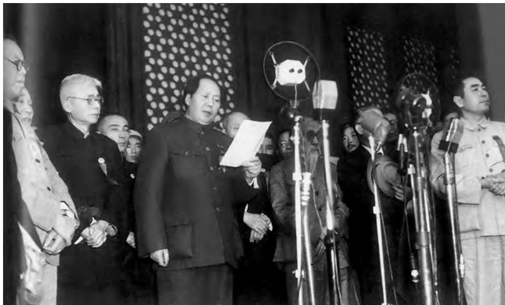
Провозглашение КНР Мао Цзэдуном. 1 октября 1949 г.

войны длились почти сорок лет и почти непрерывно: с 1911 по 1949 г. Народ жаждал мира, экономических преобразований и демократических свобод. Все это было обещано китайской коммунистической партией. КПК одержала победу в войне над Партией Гоминьдан Китая и ее государством, Китайской Республикой, благодаря тому, что составлявшие подавляющее большинство населения страны крестьяне, а также относительно немногочисленный рабочий класс, и традиционно играющий важную роль во внутривнутриполитической жизни Китая слой образованных людей, или интеллигенции, поверили китайским коммунистам. Коммунистическая партия Китая и Народно-Освободительная Армия Китая (НОАК; дословно: Армия Освобождения Народа Китая) добились того, что нация Китая стала независимой, а китайский народ поднялся во весь рост.