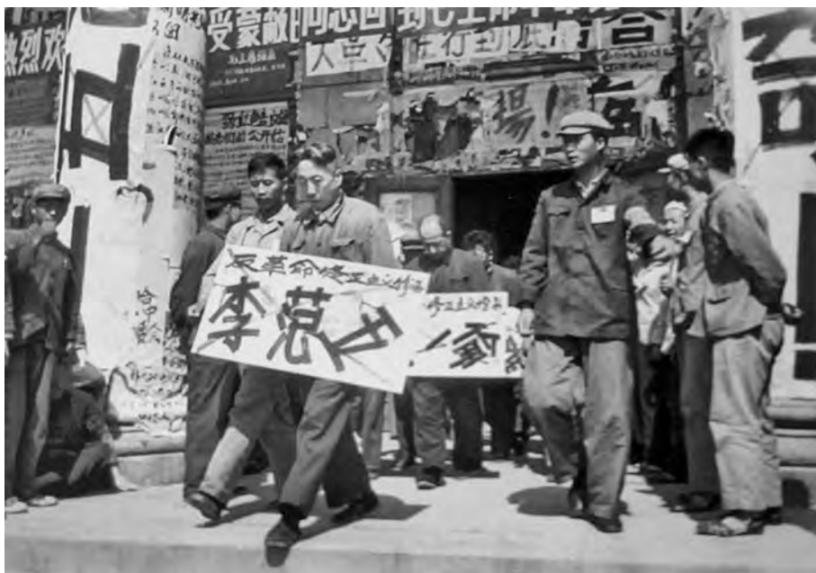
Критика партийного секретаря в Харбине

«лучшим» из подобного рода документов. Согласно документу, из 26 кадровых работников – руководителей отделов типографии, которые якобы в свое время состояли членами Гоминьдана, 22 человека проникли в ряды партии. После прихода в типографию членов военно-контрольного комитета, которые «взялись за классовую борьбу», 10 человек к моменту написания отчета были уже разоблачены как «контрреволюционеры».