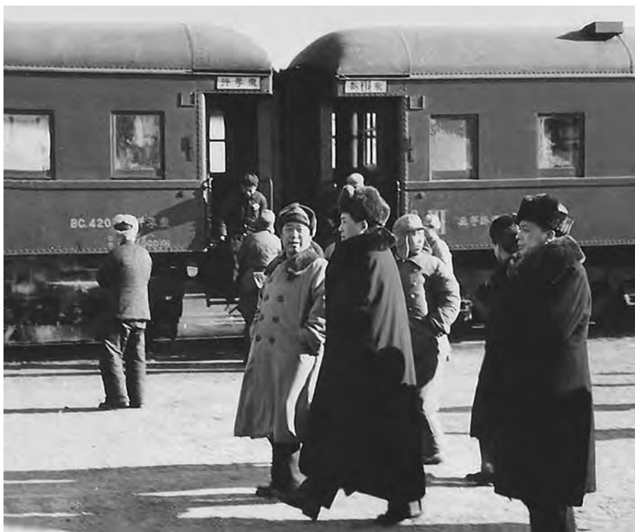
Мао Цзэдун на железнодорожной станции перед отправлением в СССР на празднование 70-летия И.В. Сталина

5 октября 1949 г. состоялась учредительная конференция новой массовой общественной организации. Первым председателем ОКСД стал Лю Шаоци, среди его заместителей были лидеры демократических партий и движений, включая руководителя Всекитайской федерации женщин Сун Цинлин, руководителя Народного университета Китая У Юйчжана, председателя Ассоциации демократического национального строительства Хуан Яньпэя и других. Лю Шаоци вскоре сменила Сун Цинлин, возглавлявшая Общество в течение почти 10 лет. Помимо центрального Общества были образованы отделения в провинциях, городах центрального подчинения,