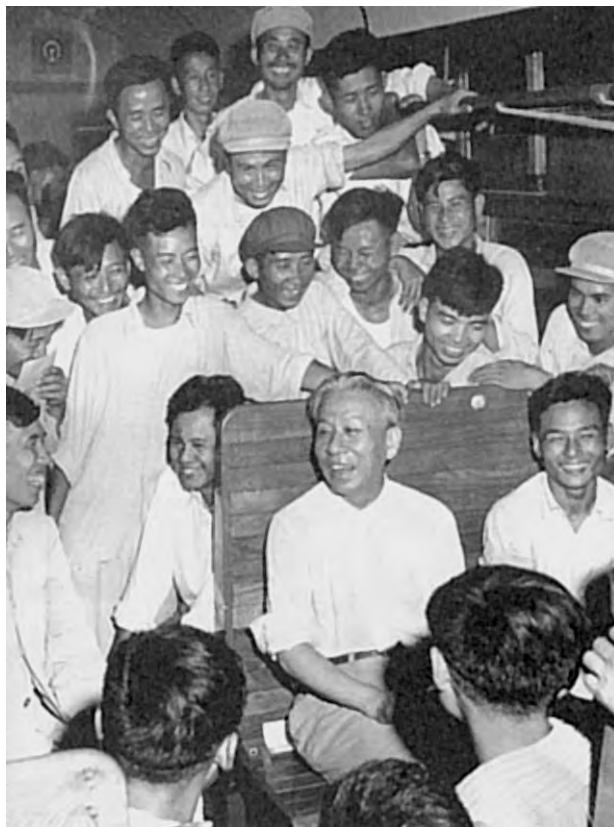
Лю Шаоци беседует с молодежью во время поездки по стране. Июль 1958 г.

во Франции. Китайские народные коммуны – это экономические и политические организации коммунистического типа. Они – великое достижение нашего народа». 9 августа 1958 г., уже будучи в Шаньдуне, Мао Цзэдун публично объявил: «Народные коммуны – это хорошо!», повторив, что они являются «величайшим достижением китайского народа». Через день эти «указания» были растиражированы на первых страницах всех газет.