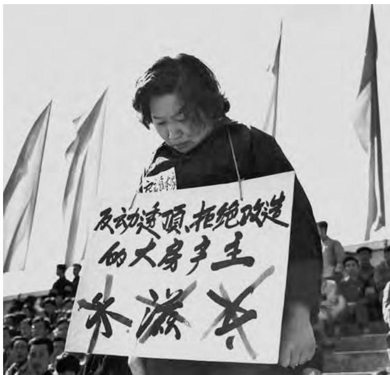
Осуждение крупной домовладелицы в годы «культурной революции»

В день создания «Первого штаба» в Пекине состоялся крупный митинг, на котором с речью выступил Чжоу Эньлай. Он указал на необходимость организации пункта (центра) связи хунвэйбиновских организаций высших, специальных и средних учебных заведений Пекина. Сразу же после митинга был создан пункт связи, расположившийся во Дворце культуры. Функции и полномочия этой организации строго регламентировались. В ее задачи входило осуществление связи со всеми хунвэйбиновскими объединениями вне страны; обслуживание приезжих «красных охранников», оказание им помощи; регистрация новых молодежных организаций; обмен мнениями и документами. «Создаваемый пункт связи станет органом связи, а не руководящим органом, – отметил Чжоу Эньлай на митинге. – По своему характеру он будет организацией переходного периода. Чтобы создать вам благоприятные условия для осуществления революции, мы создадим специальную телефонную связь, подготовим транспортные средства, обеспечим питание и жилье». Аналогичные определения статуса этой организации дал представитель нового Пекинского горкома КПК У Дэ.