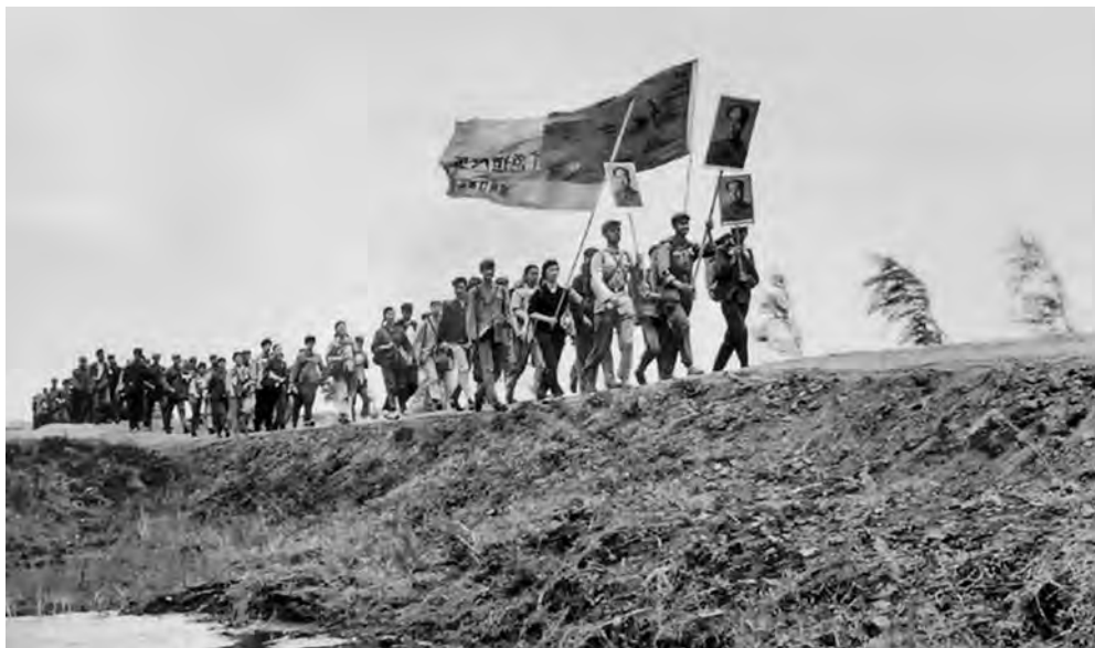
Члены молодежных организаций в походах по стране в годы «культурной революции»

Армейские кадры, возглавив 20 из 29 ревкомов, заняли господствующее положение в политической жизни Китая. Решающую роль в поддержании общественного порядка обеспечивали специальные воинские части, подчинявшиеся непосредственно Военному совету. Хотя командный состав НОАК подвергся значительной чистке (более 80 тыс. человек было ошельмовано, более 1100 военных погибли в результате репрессий), армия оставалась единственной организованной силой, система партийных органов в которой не была разрушена.