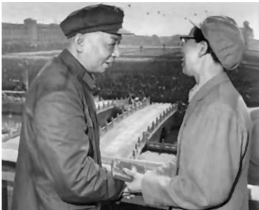
Лю Шаоци и Цзян Цин. 1 октября 1966 г.

На заседании Мао Цзэдун впервые встретился со всеми членами ГКР. Говоря о выработке «хорошего документа», он подчеркнул, что главным является изменение формы направления рабочих групп. Рабочие группы не понимают, что происходит в вузах, некоторые из них совершают «плохие дела», препятствуют развитию движения, «тормозят революцию». Поэтому надо опираться на внутренние силы учебных заведений, дать им возможность самим вести революцию. Мао Цзэдун особо отметил, что и рабочая группа Чжан Чэнсяня, посланная в Пекинский университет, также «тормозит движение». Было заявлено, что Лю Шаоци и Дэн Сяопин «совершили серьезную ошибку», приняв решение о направлении рабочих групп.