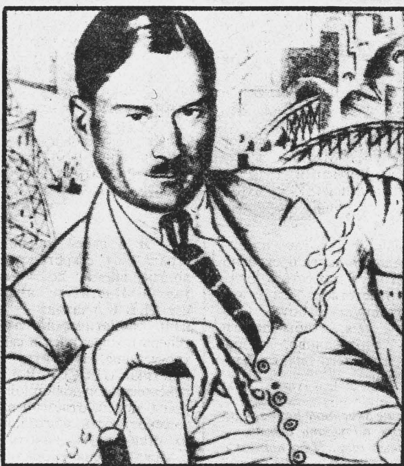
Портрет работы художника Б. КУСТОДИЕВА из коллекции Р. ГЕРРА (Париж)

... 300 человек их было заперто в тюрьме. Им приказали выходить по одному. Каждому привязывали к ногам старый колосник и за борт.