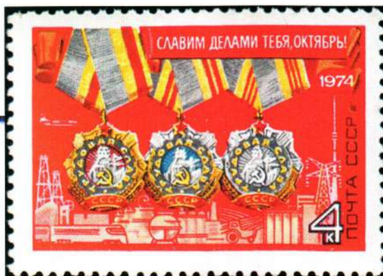
▲ Почтовая марка СССР с орденом Трудовой Славы трех степеней, 1974 год