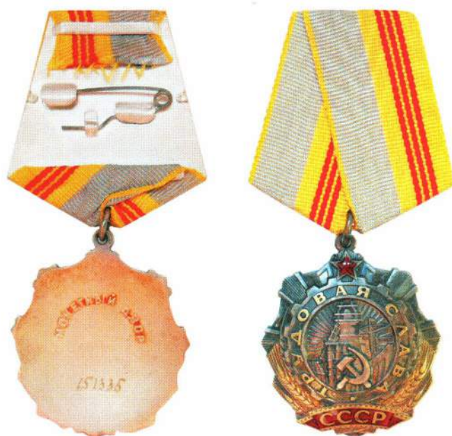
▲ Орден Трудовой Славы III степени (лицевая и оборотная стороны)

Постановлением Президиума Верховного Совета СССР от 19 февраля 1981 года награждение было распространено на рабочих и мастеров всех отраслей материального производства, а также на рабочих непроизводственной сферы. Указом от 25 июня 1984 года награждение было распространено на учителей, воспитателей и мастеров производственного обучения.