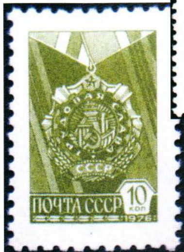
▲ Почтовая марка СССР с изображением ордена Трудовой Славы, 1976 год

(В. Тимоховцев. Газета «Новая Кондопога», 23 мая 1985 г.)