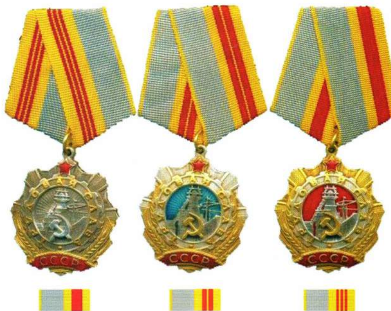
▲ Орден Трудовой Славы трех степеней

Планка с орденской лентой ордена носится после планки ордена Славы.