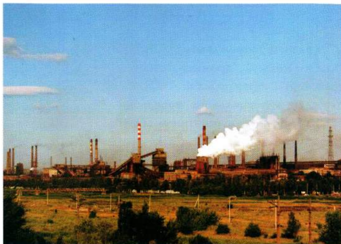
▲ Завод «Азовсталь» до сих пор является одним из крупнейших металлургических предприятий на территории бывшего СССР