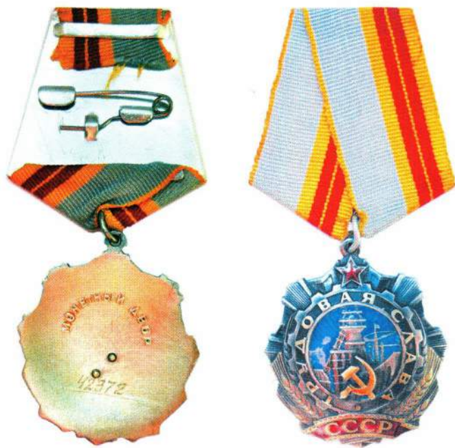
▲ Орден Трудовой Славы III степени (лицевая и оборотная стороны)

Последние награждения орденом Трудовой Славы I степени в истории СССР произошли согласно Указам Президента