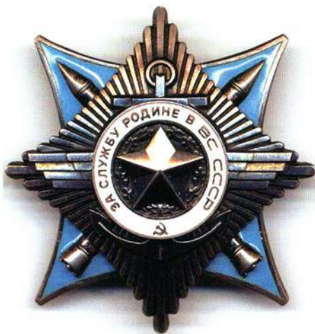
▲ Орден «За службу Родине в Вооруженных Силах СССР» III степени

Первое награждение орденом «За службу Родине в Вооруженных Силах СССР» III степени было произведено в канун празднования Дня Советской Армии и Военно-Морского Флота Указом Президиума Верховного Совета СССР от 17 февраля 1975 года. Ордена получила большая группа военнослужащих (57 человек), достигших больших успехов в боевой и политической подготовке и успешно освоивших новую боевую технику.