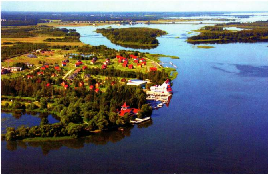
▲ Завидовский заповедник — настоящая жемчужина среднерусской возвышенности и традиционное место отдыха высшего руководства страны

окорока, с десятков уток, 10-15 килограммов свежей рыбы. Кандидатам в члены Политбюро — чуть меньше и без лосятины. Секретарям ЦК — ни марала, ни лося и ровно половину от нормы, установленной для кандидатов в члены Политбюро.