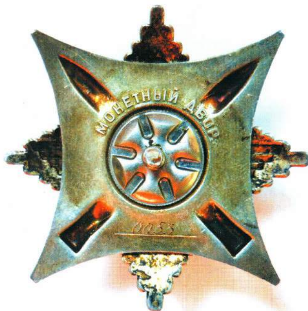
▲ Орден «За службу Родине в Вооруженных Силах СССР» II степени (лицевая и оборотная стороны)