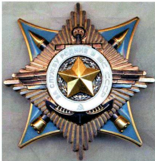
▲ Орден «За службу Родине в Вооруженных Силах СССР» II степени

Орден «За службу Родине в Вооруженных Силах