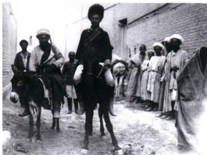
▲ Бойцы национальных частей туркестанской Красной Армии на одной из улиц Бухары. 1920 г.

5-й Всебухарский курултай Советов 19 сентября 1924 г. принял решение о переименовании БНСР в Бухарскую Советскую Социалистическую Республику, которая в результате национально-государственного размежевания советских республик Средней Азии 27 октября 1924 была ликвидирована.