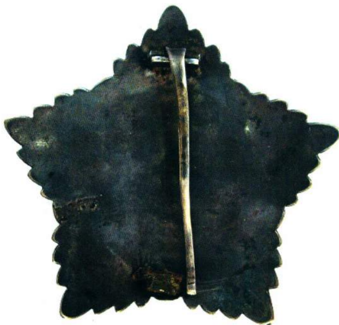
▲ Орден 2 степени, лицевая и оборотная стороны

3-Я СТЕПЕНЬ – серебряный знак грушевидной формы. В середине верхней фигурной части знака – красная эмалевая звезда с арабскими буквами в центре и между лучами звезды: «Ц.И.К.Б.Н.С.Р.». Под звездой – надпись арабскими буквами: «Защитнику революции». Такая же надпись, но русскими буквами – в нижней части знака.