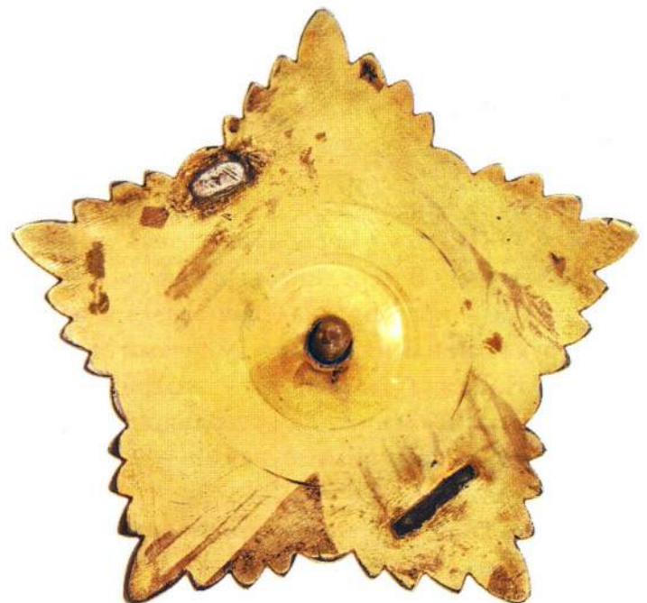
▲ Орден 1 степени, лицевая и оборотная стороны

2-Я СТЕПЕНЬ – такая же серебряная звезда, но без позолоты.