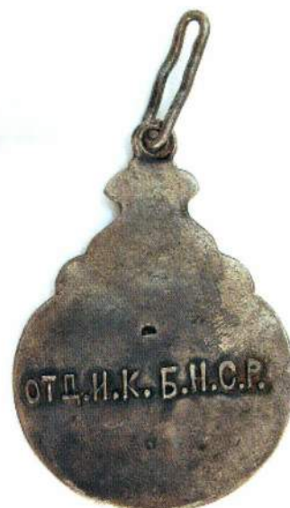
▲ Орден 3 степени, лицевая и оборотная стороны