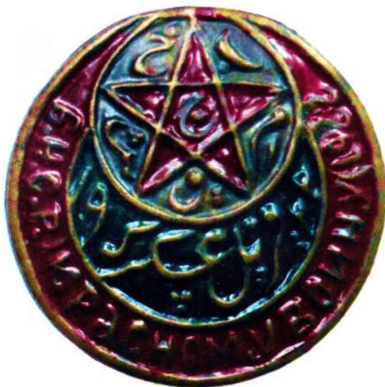
▲ Знак «Красному воину БНСР»

Второй вариант знака имел несколько большие размеры, диаметр его составлял около 45 мм. Кроме того, в пространстве между внешним и внутренним кантами находятся надписи арабской графикой. Всего знаков первого и второго варианта было изготовлено около 25.