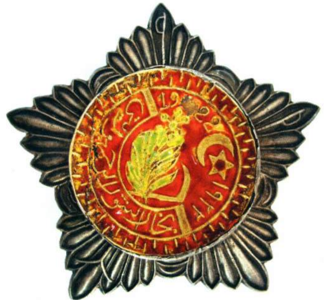
▲ Орден 2-ой степени с красной эмалью по центру

Путаница в названиях орденов так и не была решена – 14 мая 1924 г. в приказе о порядке замены утерянных орденов речь идет об ордене Красного Знамени трех степеней. Нет четких разграничений и во внешнем виде награды – известны